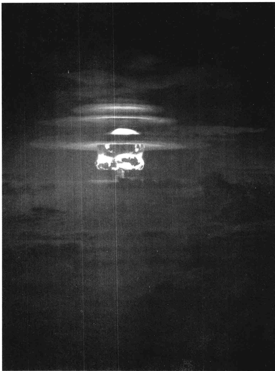
1954年5月4日，美国进行的TNT当量达1350万吨的氢弹试验