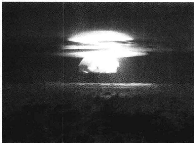
撒旦的烟火——犹如世界毁灭前夕的血色辉煌 (1954年3月1日美国进行的核试验)