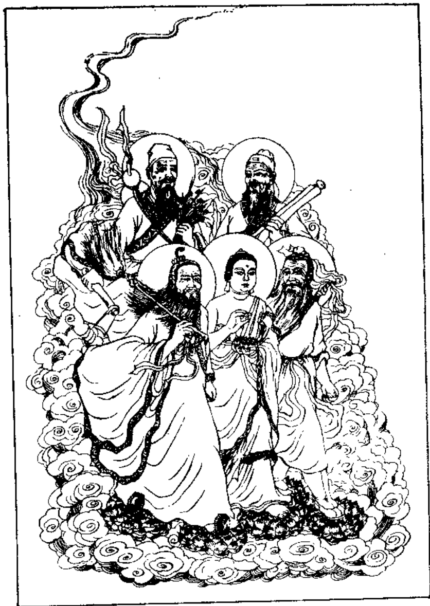
博大精深数中华，儒、释、道；医武诸家；圣佛仙神光照，五教精妙合一教。 图 1 五圣图