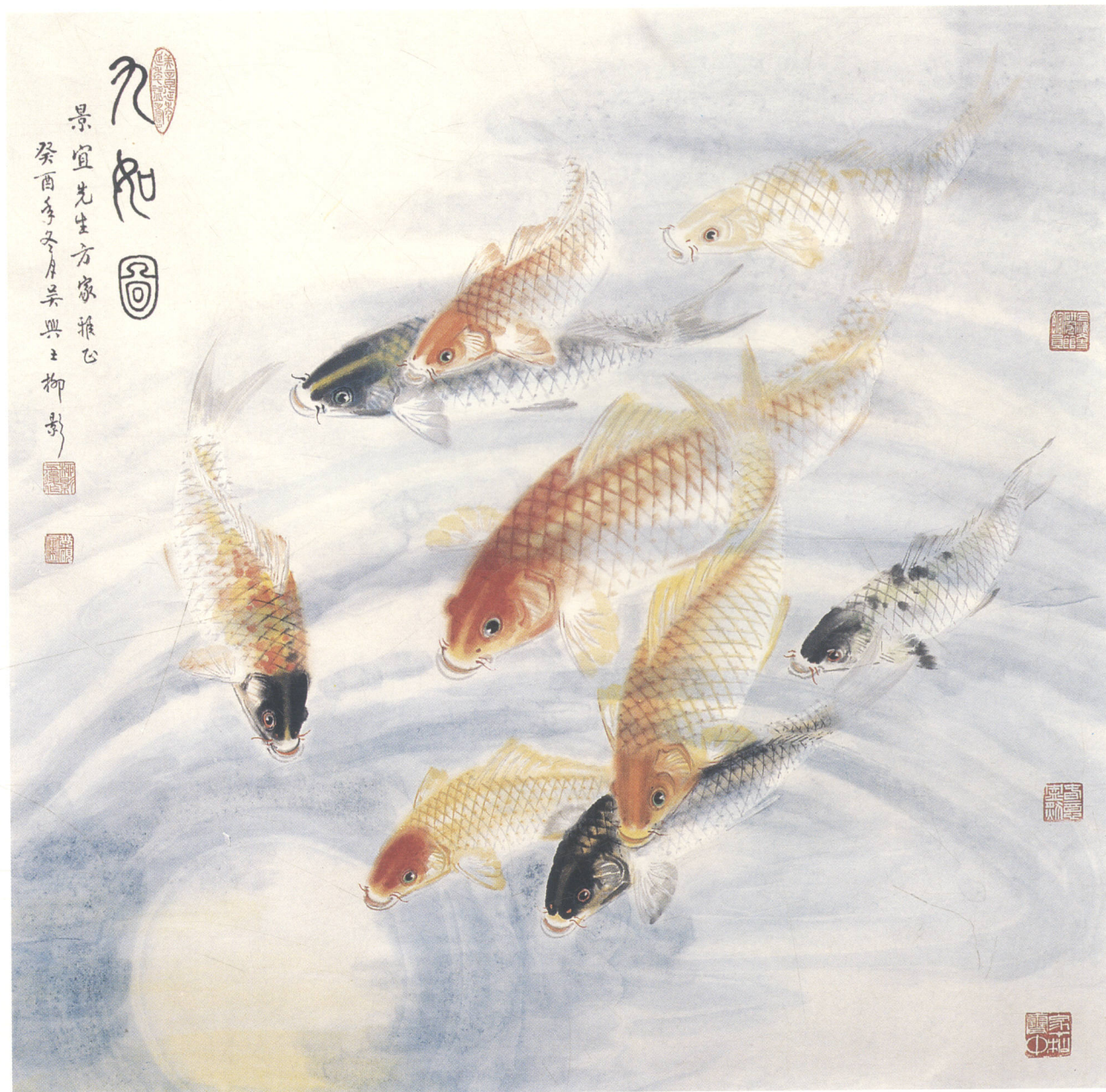
九 如 圖