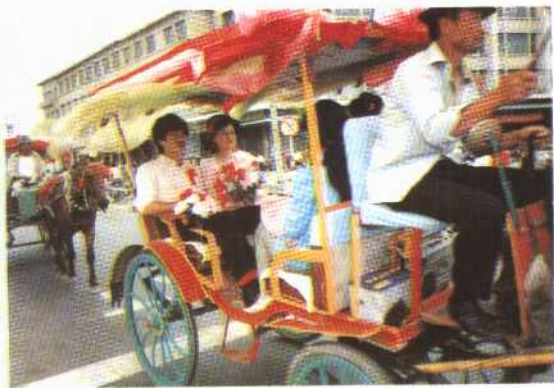
新 婚 马 车