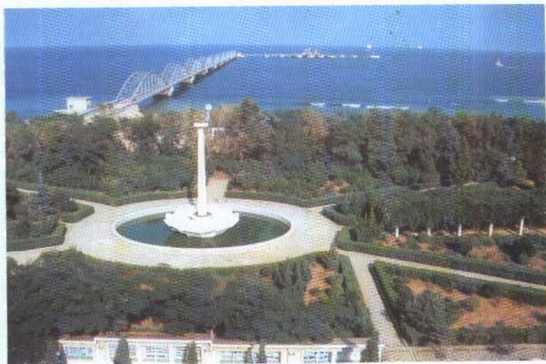
美丽的鲇鱼湾油港