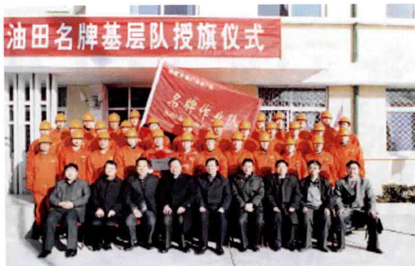
管理局名牌作业队 ——作业七队