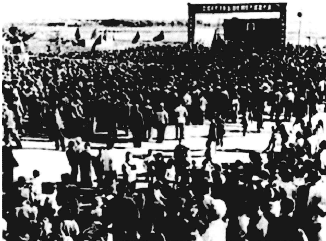
1970年9月20日，一分厂召开投产庆功大会