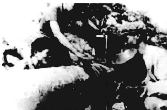
1973年，滨（南）纯（梁） 管线超声波探伤