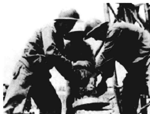
1977年，作业7队安装井口