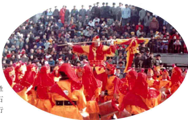
1996 年 9 月，采油二矿“胜利盘鼓队”在第二届全国石油职工运动会开幕式上进行精彩表演