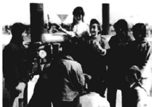
1974年，新老职工分析井况