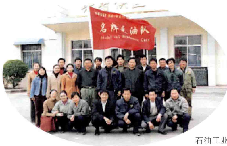
石油工业部金牌队、胜利石油管理局 名牌采油队——采油 105 队