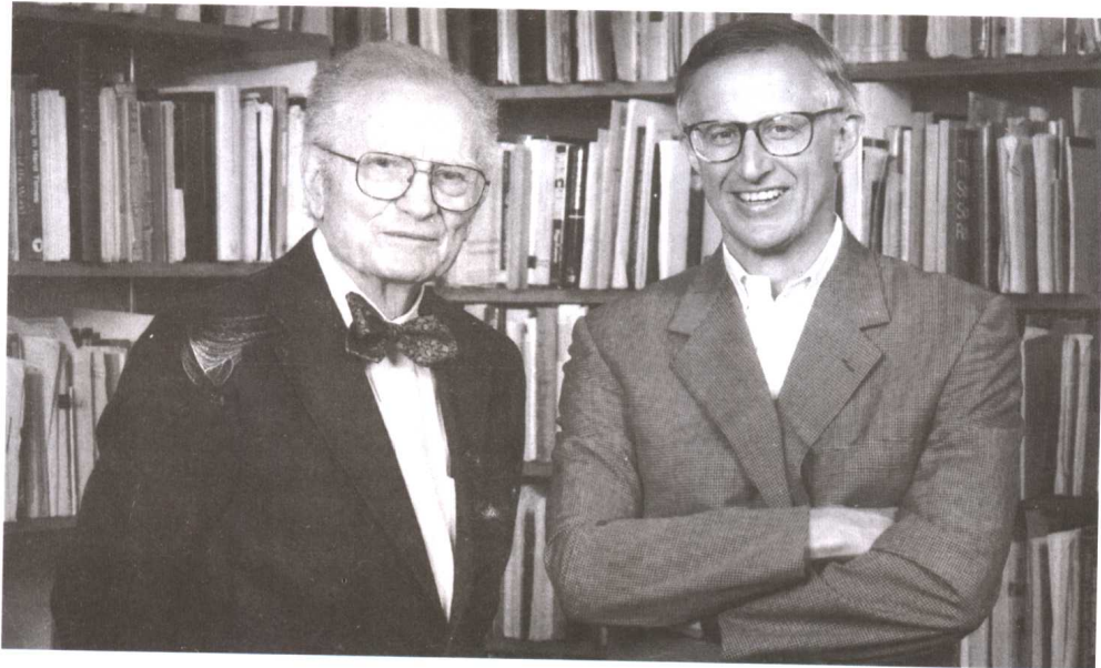
PAUL A. SAMUELSON and WILLIAM D. NORDHAUS