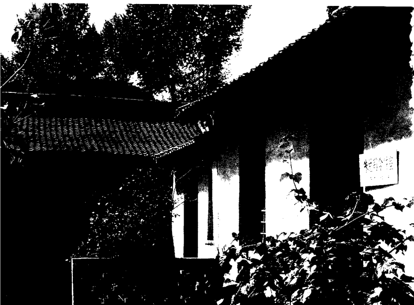
朱德总司令 1939 ~ 1940 年在王家峪总部住室