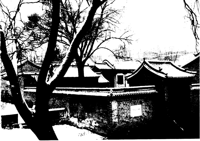
八路军总部武乡县砖壁村旧址