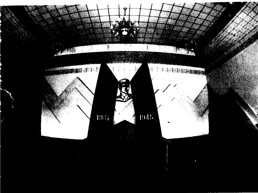
八路军太行纪念馆序厅