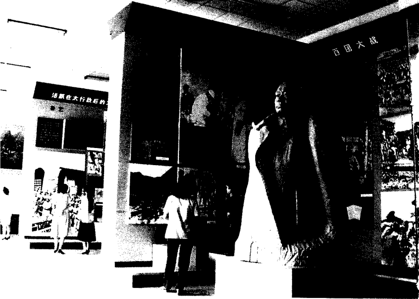
八路军太行纪念馆的第2展厅