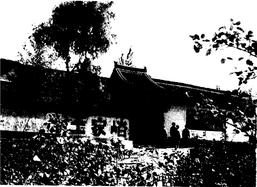
八路军总部武乡县王家峪村旧址