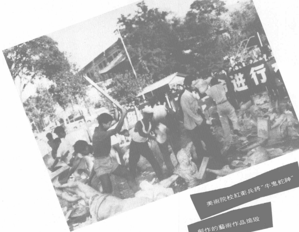
美術院校紅衛兵將“牛鬼蛇神”