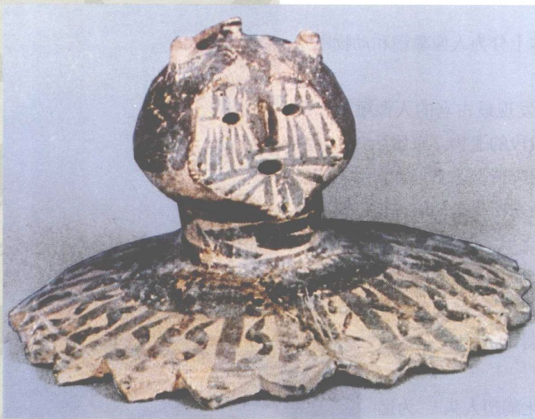
人头形陶容器盖（马家窑文化）甘肃东乡出土

仰韶文化圆雕头像，以西安半坡出土者年代最早，属距今约6800年前的半坡类型遗物。头像高4.6厘米，用细泥捏塑而成，陶色灰黑，塑工较粗。面部略