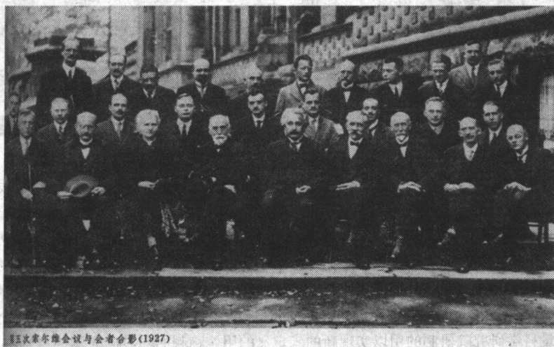
第五次索尔维会议与会者合影(1927)

本书力学部分包括质点运动学和动力学、刚体的平动和绕定轴转动的运动学和动力学及机械振动基础等.