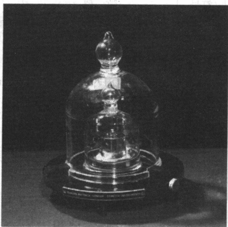
(a) 巴黎国际计量局中的 1 千克原器

在国际单位制中,质量的单位为千克(kg).1889年第一届国际计量大会决定,1千克质量的实物基准是保存在巴黎国际计量局中的一个特制的、直径为39毫米的铂铱合金圆柱体,称为千克原器.这个质量的千分之一定义为克(g).长度和时间的计量都已采用自然基准代替了实物基准,人们希望质量有一天也会采用自然基准.