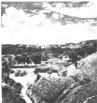
(4201) 党的七届二中全会会址 ——河北省平山县西柏坡村。