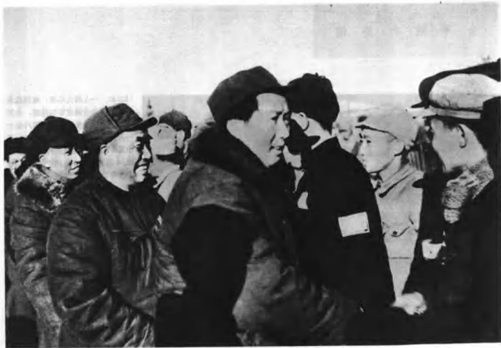
(4212) 毛泽东、朱德、刘少奇等同志与前往机场迎接的各界代表握手。