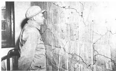
(4216) 第一野战军辖六个军，彭德怀任司令员兼政治委员。这是解放战争时期，彭德怀司令员在西北战场指挥作战。