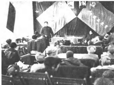
(4202) 周恩来同志在七届二中全会上讲话。