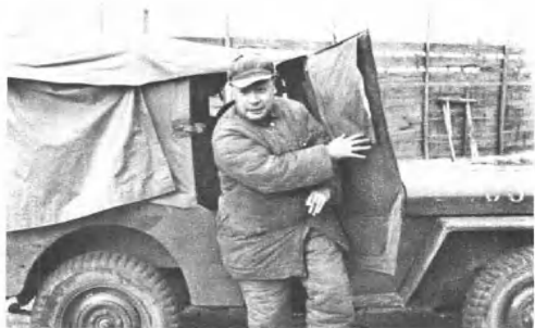
(4218) 第三野战军辖十五个军，陈毅任司令员兼政治委员。这是淮海战役前夕，陈毅司令员驱车前往参加研究、部署作战问题的第一次贾汪会议。