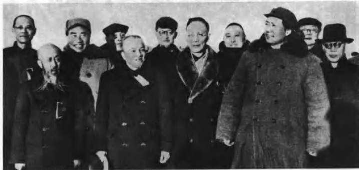
(4213) 毛泽东(左九)、朱德(左三)等同志与前来欢迎的各党派、民主人士代表沈钧儒(左二)、李济深(左五)、郭沫若(左七)、黄炎培(左八)、马叙伦(左十一)等合影。