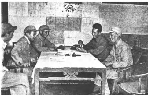
(4221) 华北军区副司令员徐向前(右二)和十八兵团司令员兼政委周士第(右一)在作战室里研究战斗部署。