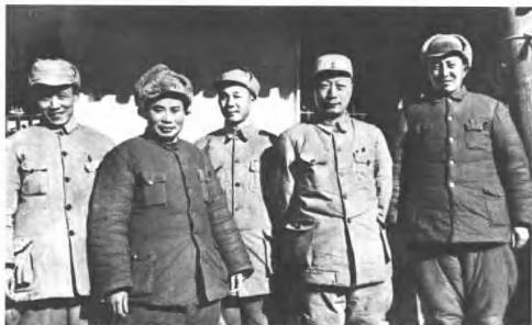
(4220) 华北军区原辖九个军(归军委直接指挥后辖两个军)，司令员聂荣臻，政治委员薄一波，副司令员徐向前。这是聂荣臻司令员(右二)和十九、二十兵团首长在一起。右起罗瑞卿、聂荣臻、杨成武、杨得志、李天焕。