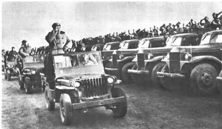
(4208) 朱德总司令等在西苑机场检阅部队。