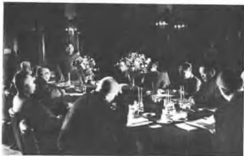
(4199) 中国共产党代表团和国民党政府代表团进行和平谈判的情形。

(4198) 以周恩来、林伯渠为首的中国共产党代表团，于四月一日在北平与国民党政府代表团进行和平谈判。双方代表经过半个月谈判，拟定了《国内和平协定》最后修正案。国民党拒绝在和平协定上签字，美蒋求和的阴谋彻底破产。这是我党首席代表周恩来在和谈会上发言。