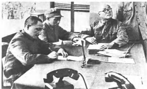
(4217) 第二野战军辖九个军，司令员刘伯承，政治委员邓小平。这是一九四九年进军大西南时的第二野战军指挥部。左起：邓小平政委、张际春副政委、刘伯承司令员。