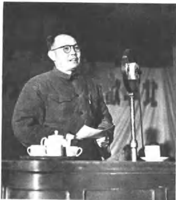
(4195) 我党代表叶剑英在欢迎民主人士大会上致词。