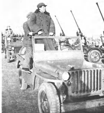
(4206) 毛泽东主席检阅高炮部队。