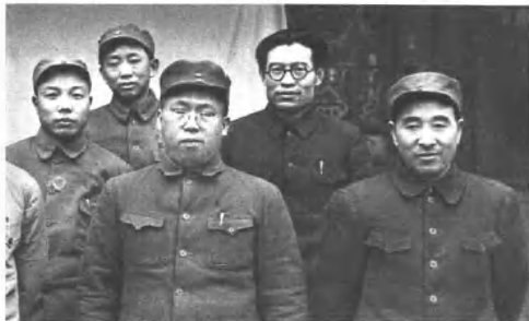
(4219) 第四野战军辖十二个军，司令员林彪，第一政治委员罗荣桓，第二政治委员邓子恢。这是司令员林彪(右一)、第一政委罗荣桓(右三)和四野其他首长在平津前线合影。