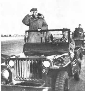
(4207) 刘少奇同志在西苑机场检阅部队。