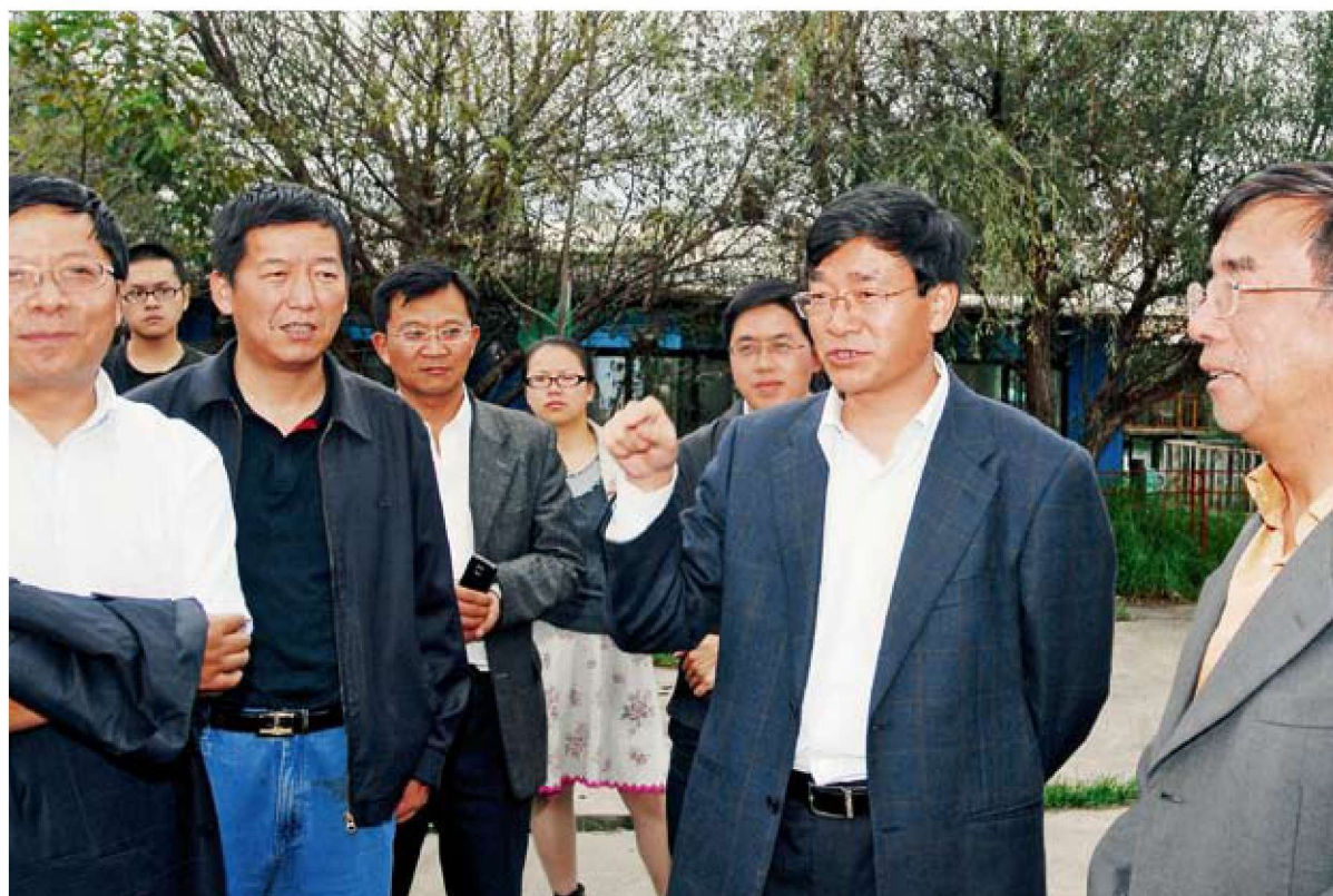
市委常委、市政府常务副市长黄云波到基层调研