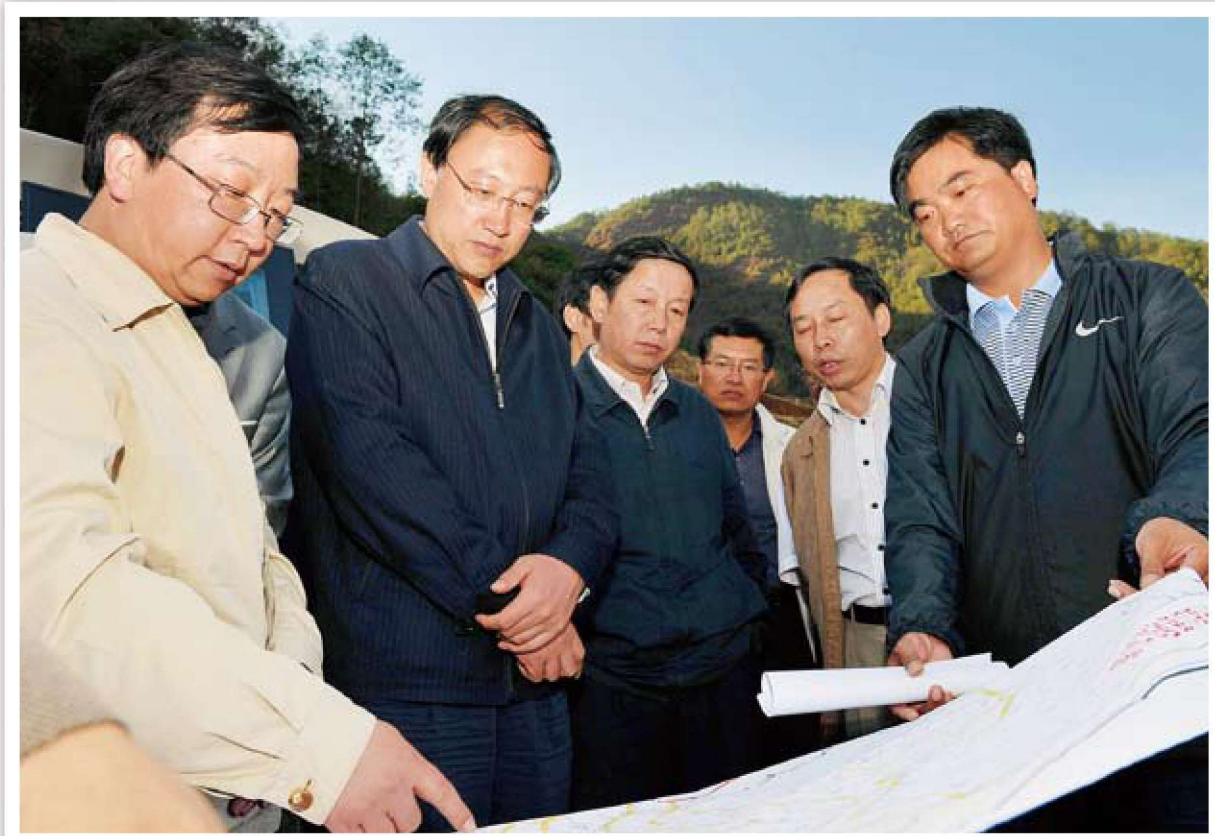
市委副书记李邑飞到基层调研