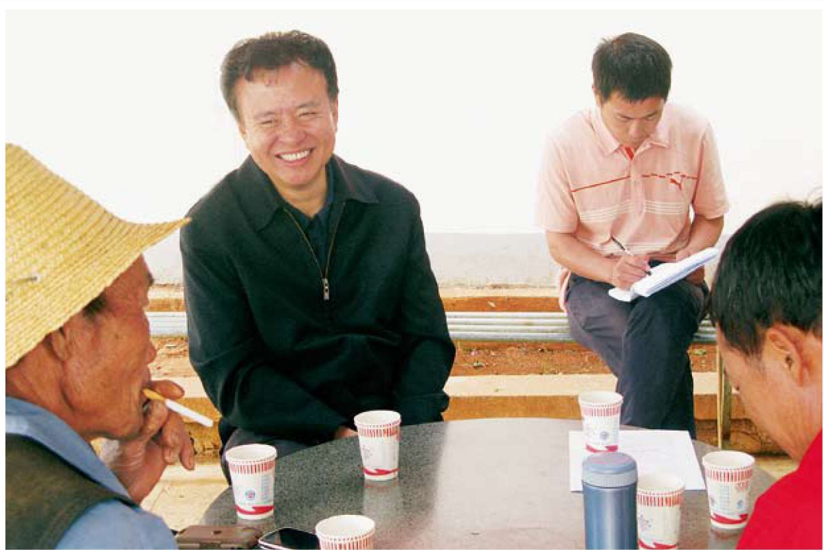
市委常委、市委组织部部长郭红波到基层调研