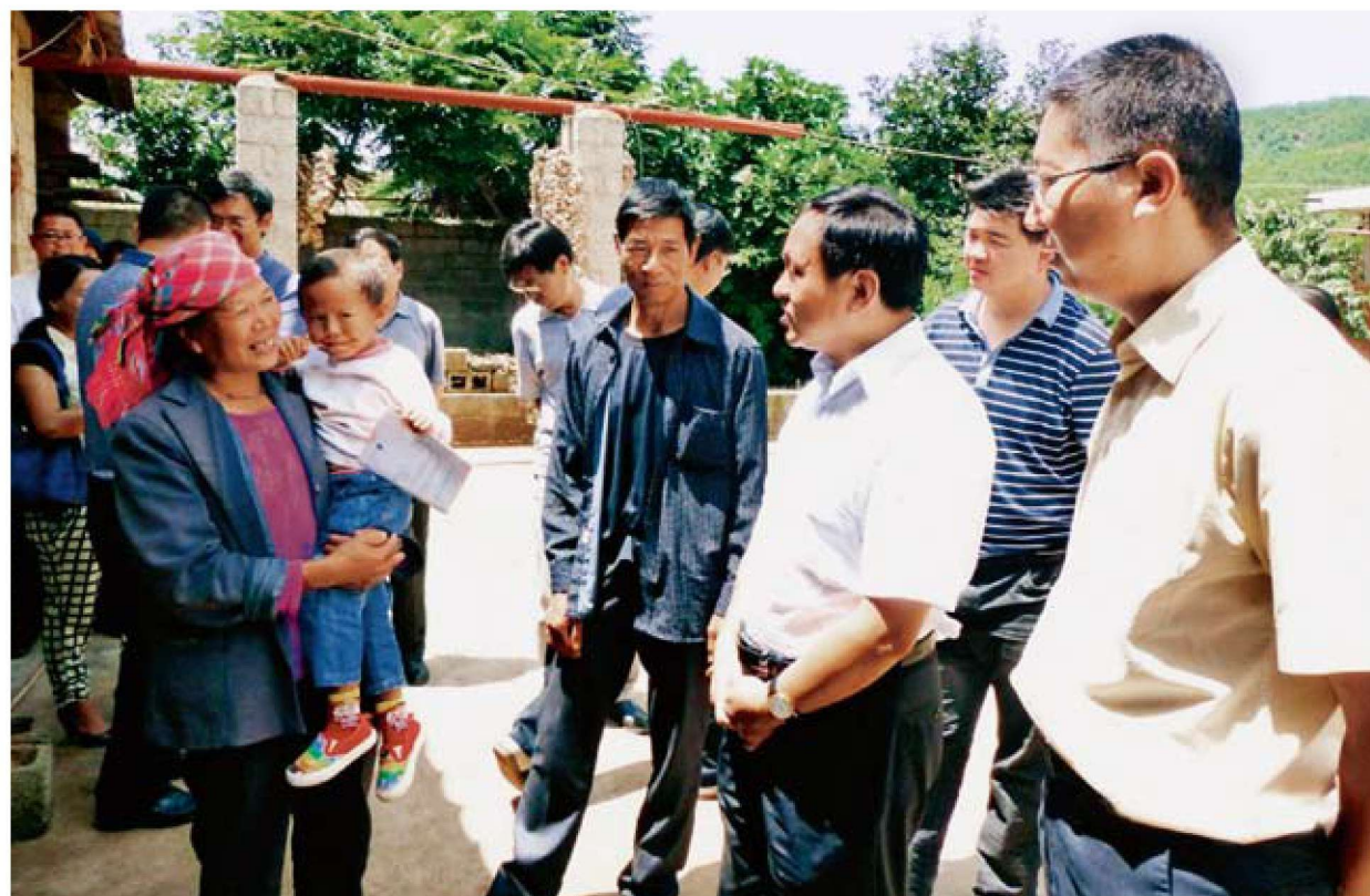
市委常委、市委秘书长柳文炜到基层调研