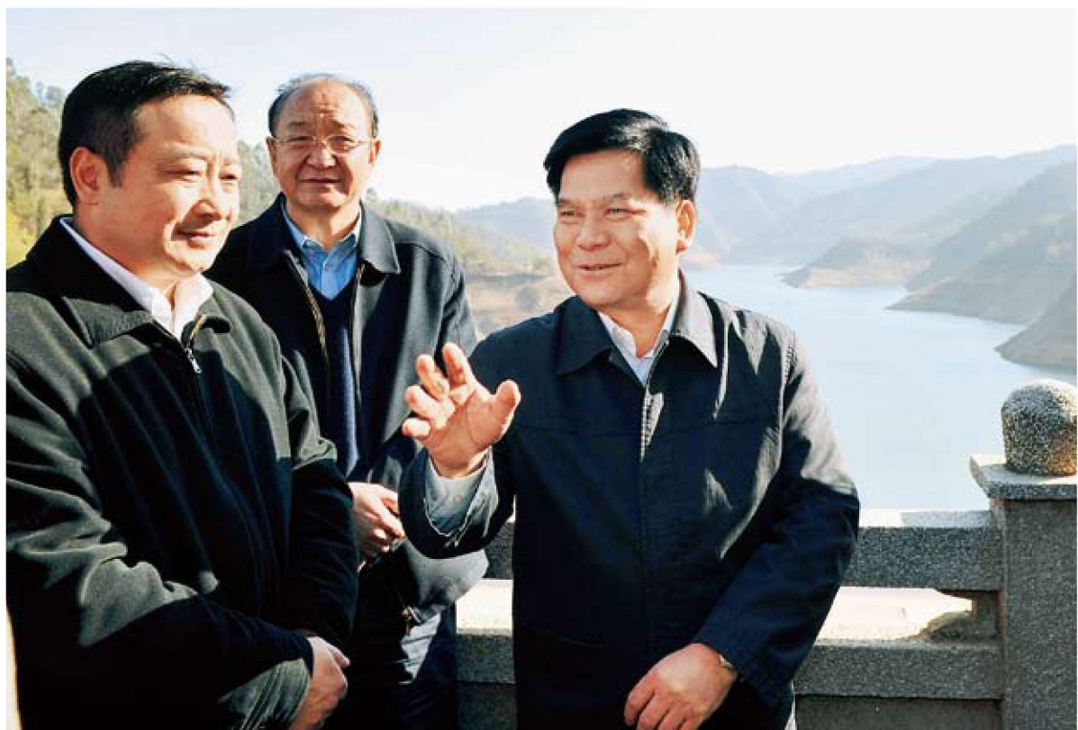
中共云南省委副书记、省长李纪恒到昆明调研