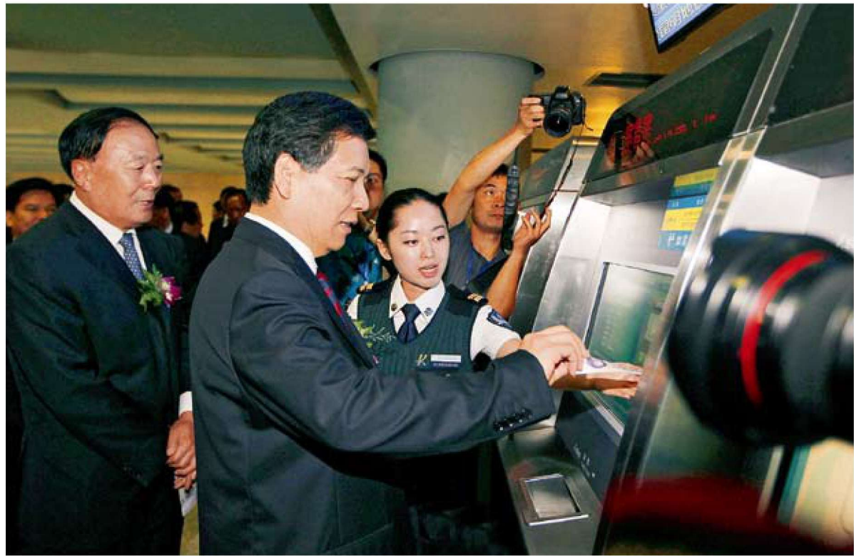
中共云南省委书记、省人大主任秦光荣出席昆明地铁开通仪式