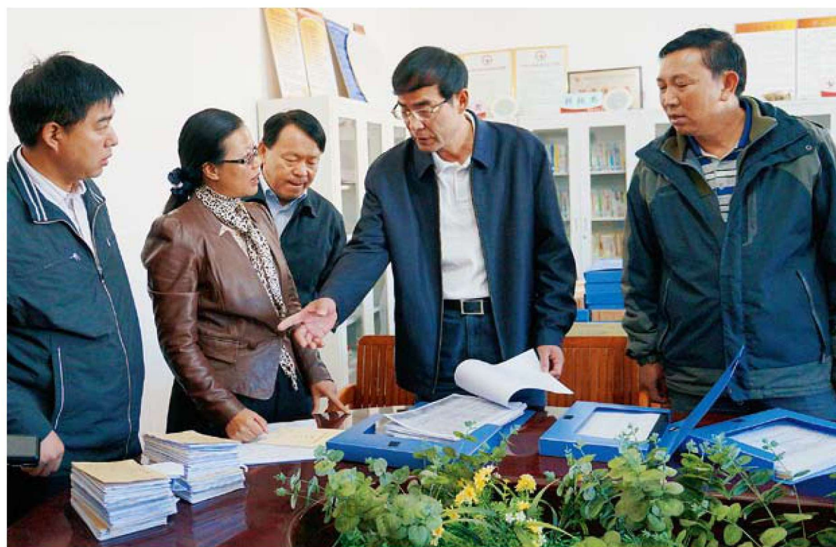
市委常委、市纪委书记应永生调研农村党风廉政建设工作