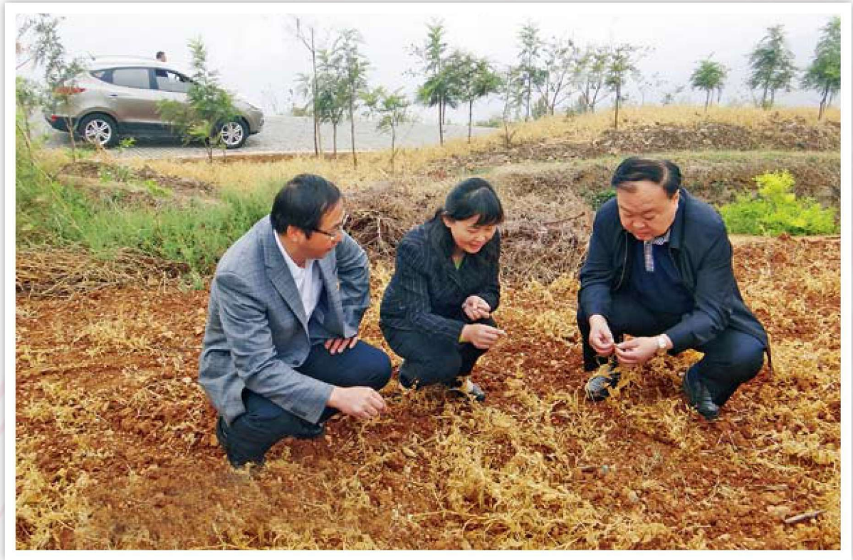
市委常委、市委统战部部长熊瑞丽到基层调研