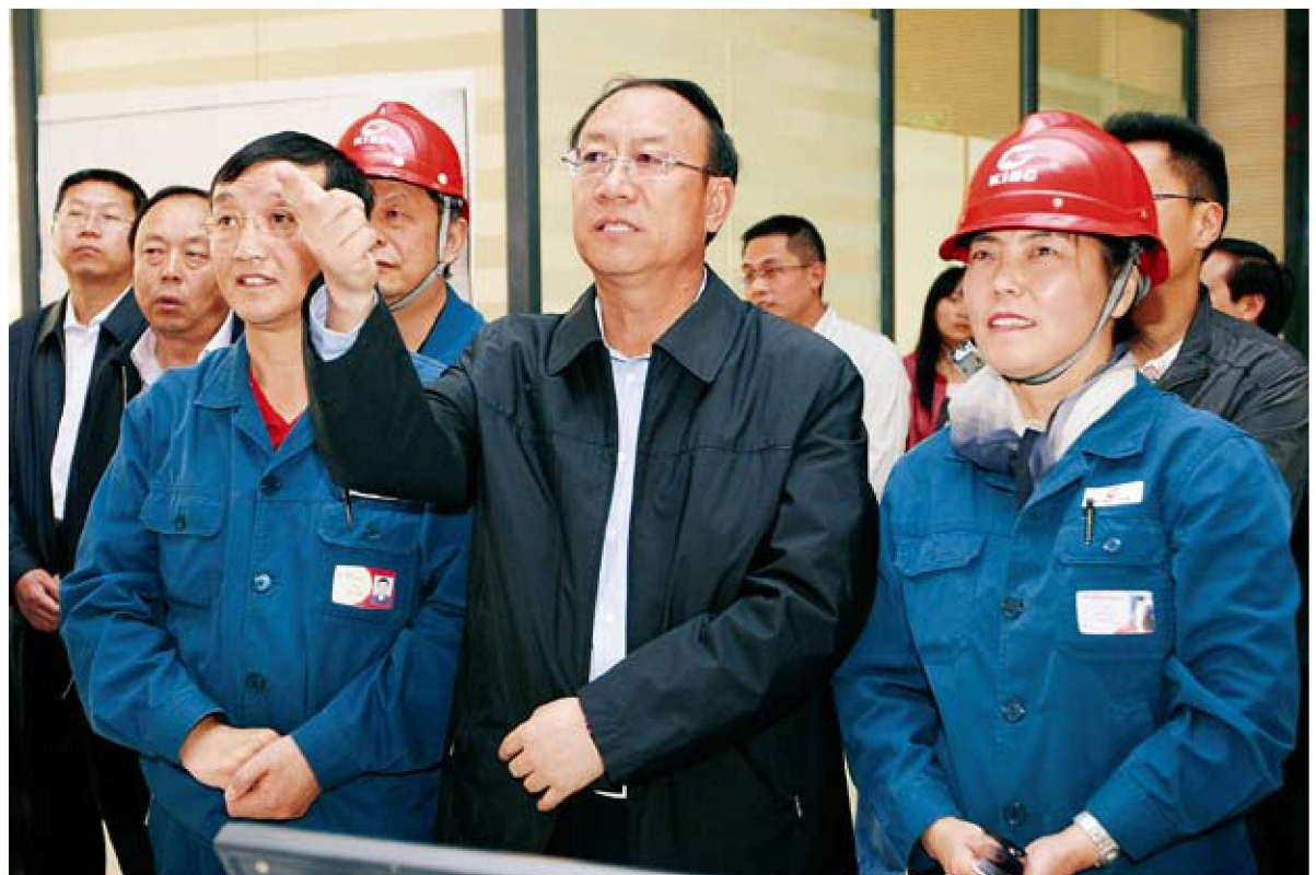
省委常委、市委书记张田欣到企业调研