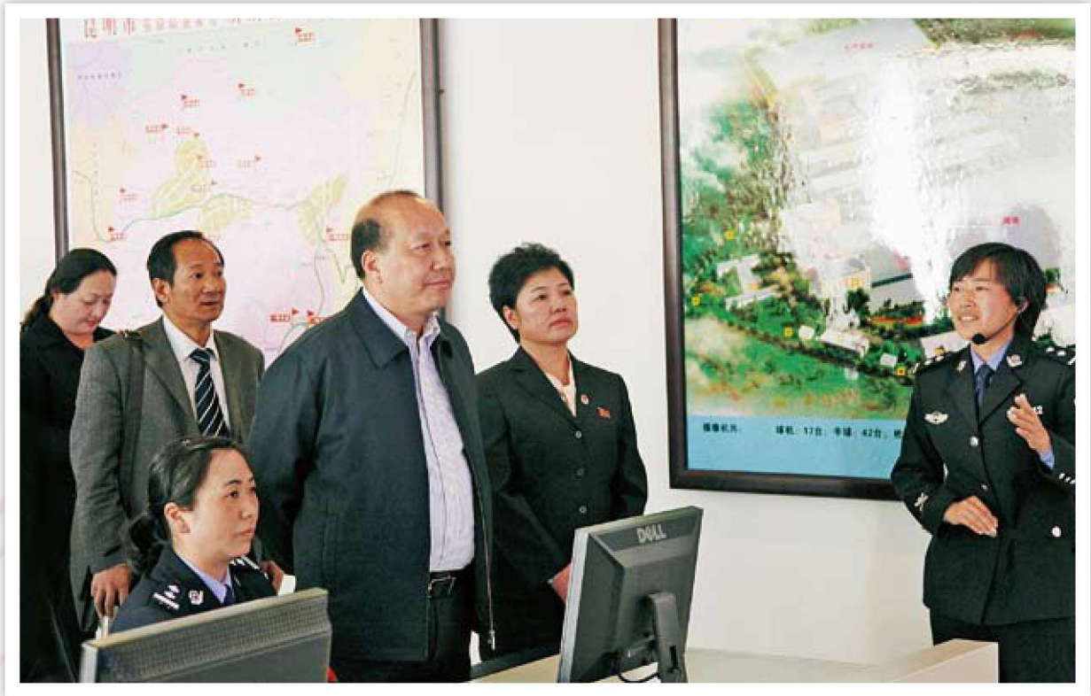
市委常委、政法委书记金志伟到市劳教所调研