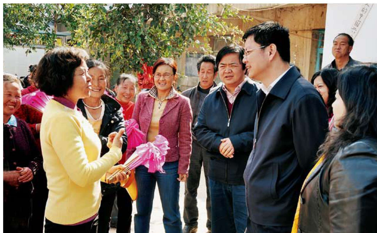
市委常委、副市长余功斌到基层调研