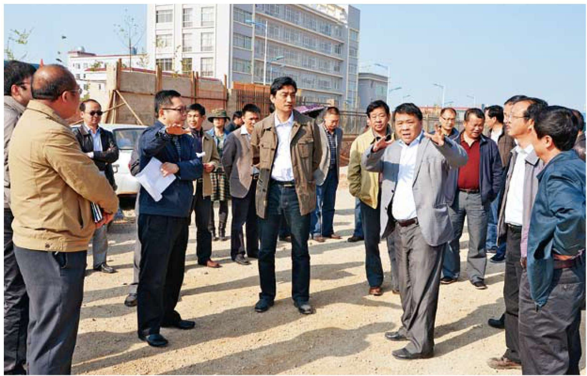
市委常委、高新区党工委书记董保同到基层调研