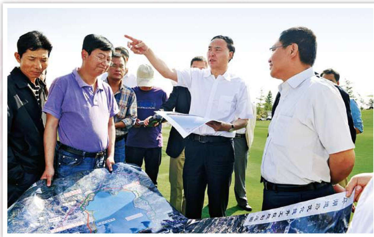
市委副书记、市长李文荣到基层调研（2012年12月任职）