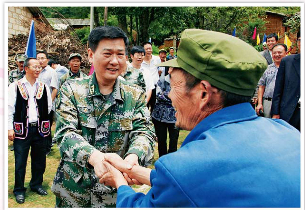
市委常委、昆明警备区政委方兴国到基层调研