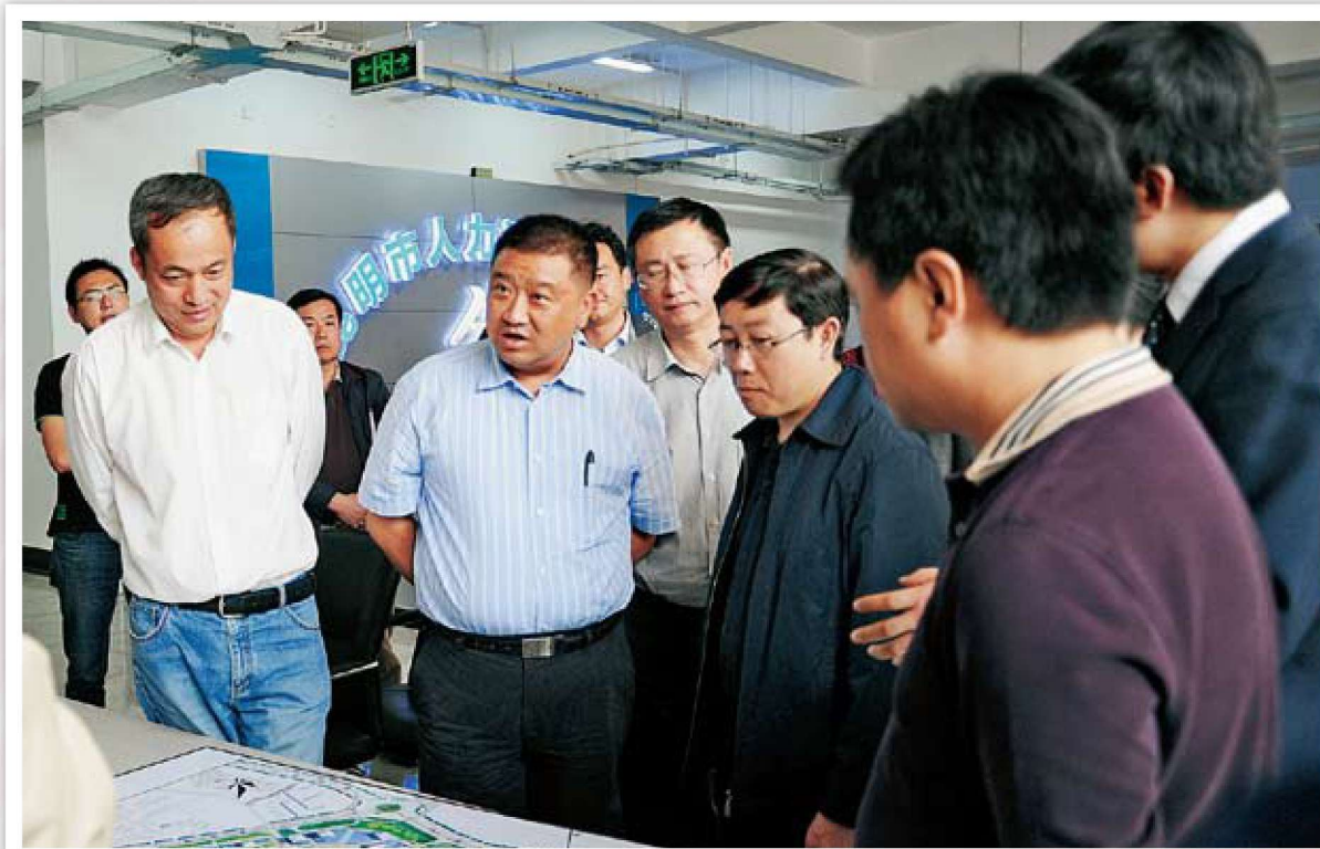
市委常委、市政府副市长保建彬到基层调研