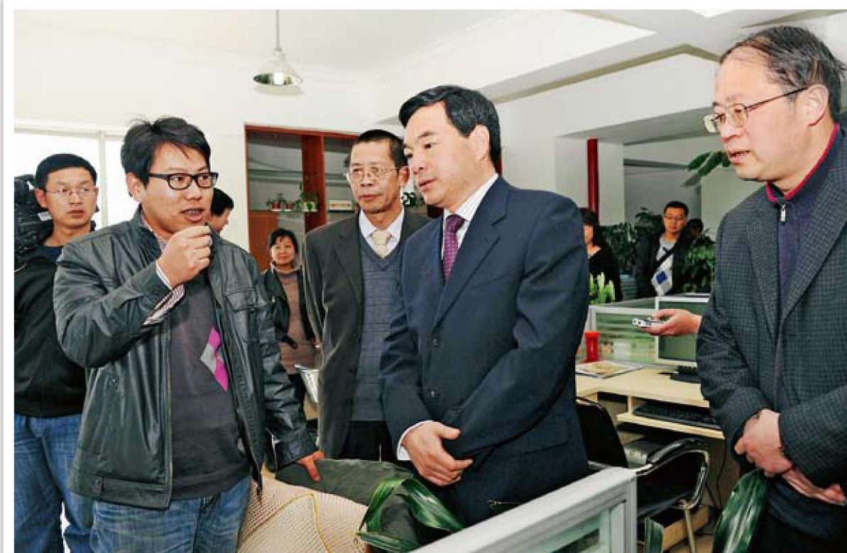
市委常委、市委宣传部长谢新松到基层调研