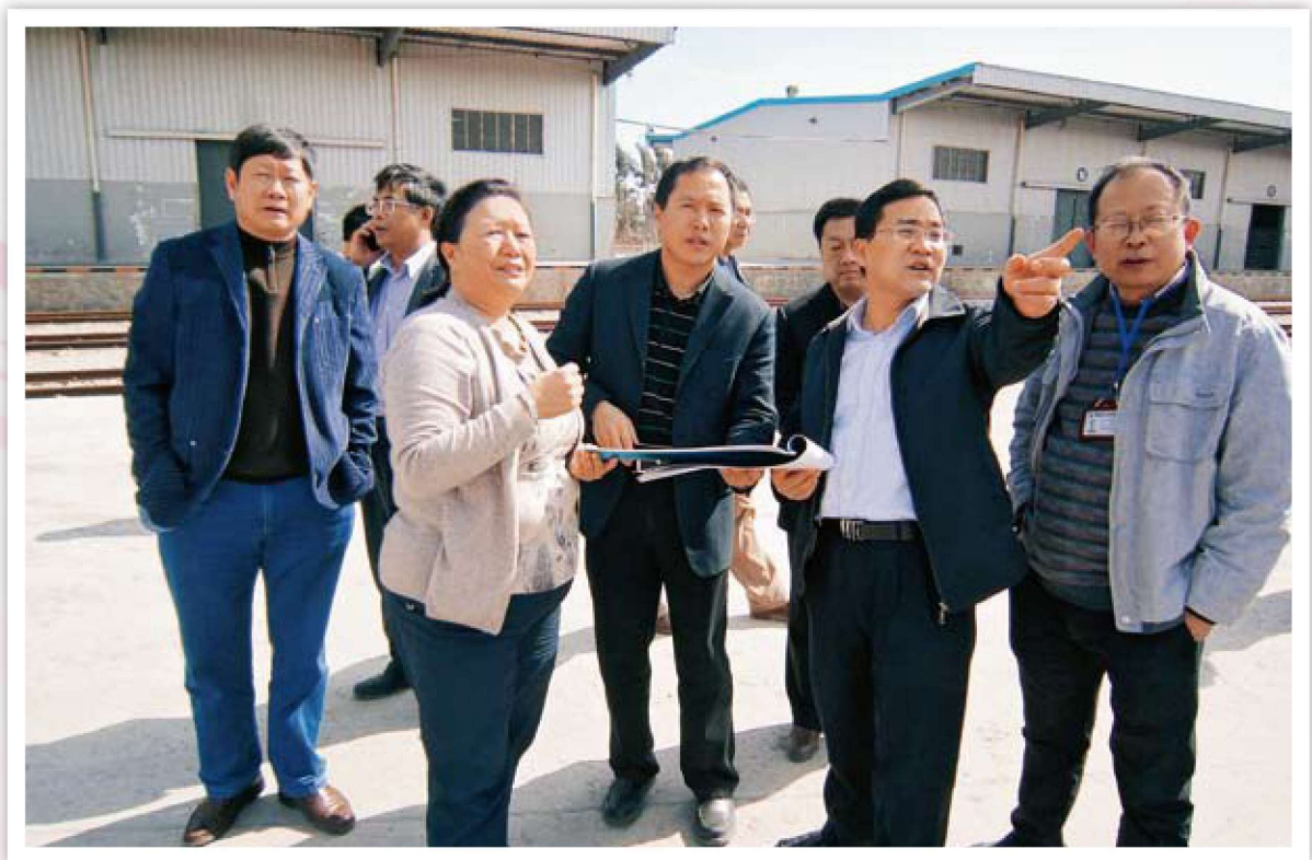
市委常委、副市长朱永扬到基层调研