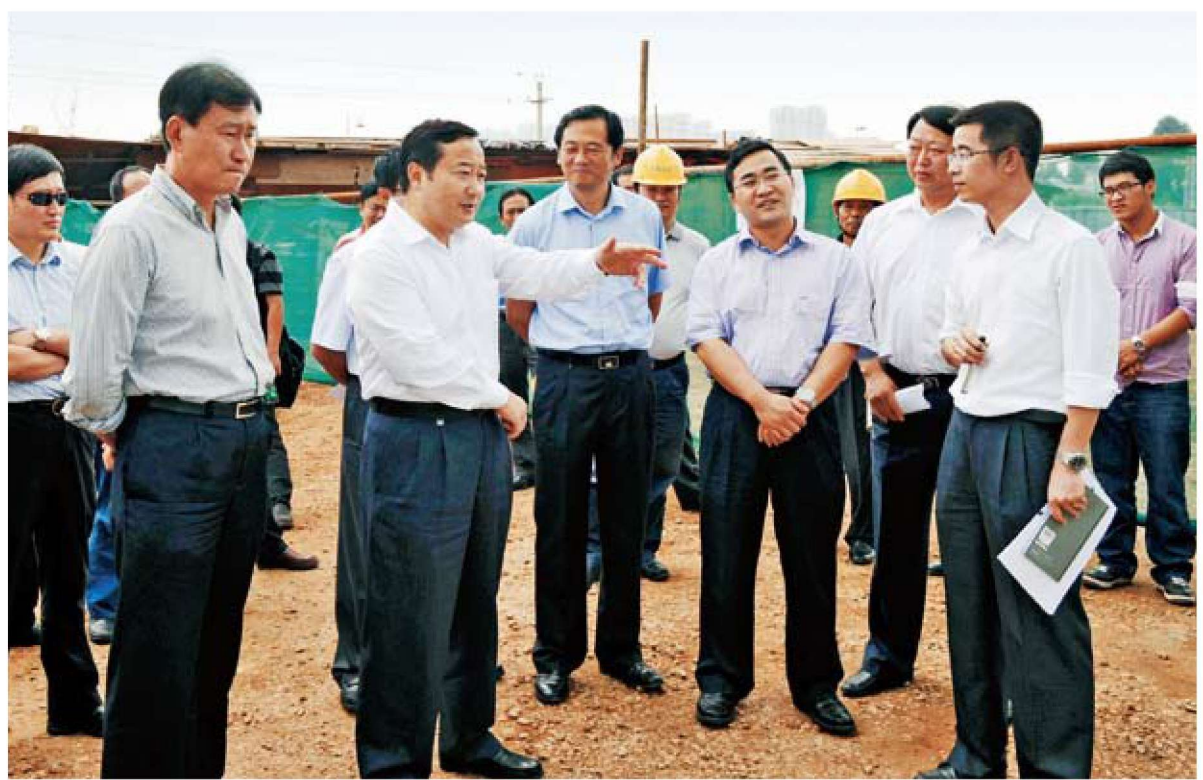
市委副书记、市长张祖林到基层调研（2012年12月止任）