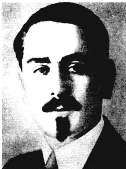
Я. X. 达夫强——国家政治保安局对外局第一批领导人之一，1924年为国家政治保安总局驻中国总谍报负责人