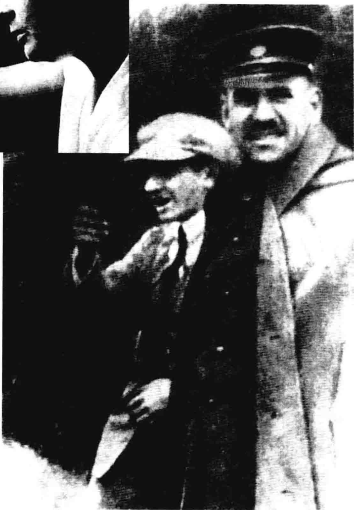
国民革命军总军事顾问B.K.布柳赫尔（加伦）和顾问И.沃罗比约夫（沙尔费耶夫）——1925年第一次东征时留影