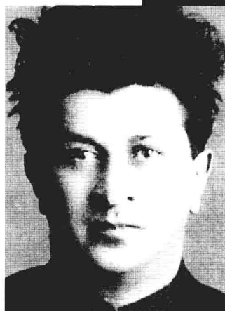
共产国际驻中国代表——П.米夫