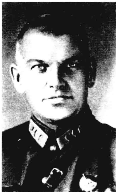
Я. К. 别尔津——1924年为军事情报机关领导人