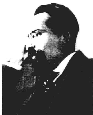
驻中国全代表 Л.М.加拉罕