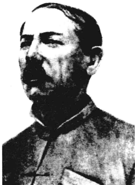
M. M. 鲍罗廷——共产国际执行委员会驻中 国代表，国民党中央执行委员会总政治顾问