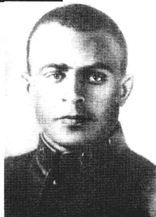
总军事顾问——В.М.普里马科夫