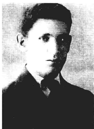
共产国际驻中国代表——Г.Н.维斯基