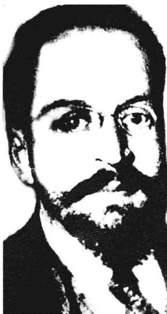
A. A. 越飞——1922-1923年 驻中国全权代表