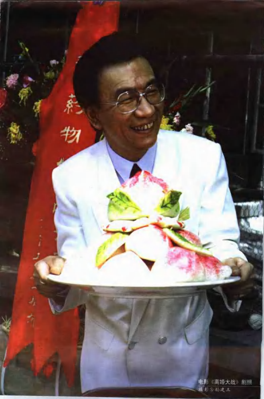
电影《离婚大战》剧照 摄影◎孙建三