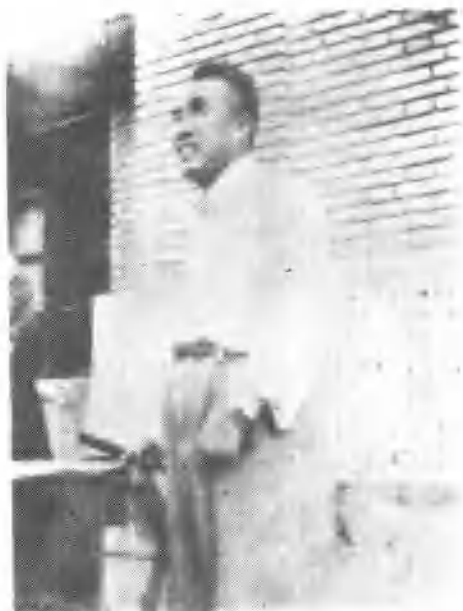
↑ 1949年7月15日，朱德总司令在北大民主广场给南下工作团作报告