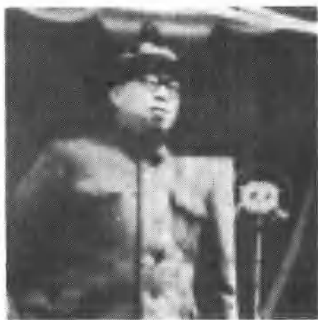
1949年4月8日，第四野战军政治委员罗荣桓于中山公园音乐堂，在南下工作团第一分团开学典礼上讲话