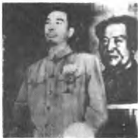
↑ 南下工作团副总团长陶铸在南工团南下动员大会上讲话