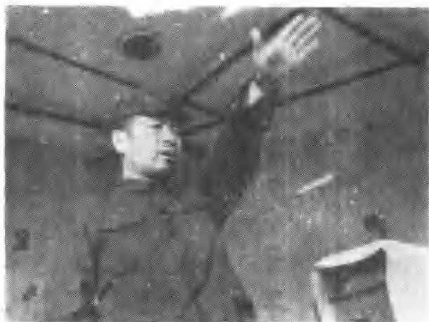
↑ 1949年6月16日，中共中央周恩来副主席在中山公园音乐堂给南下工作团作报告