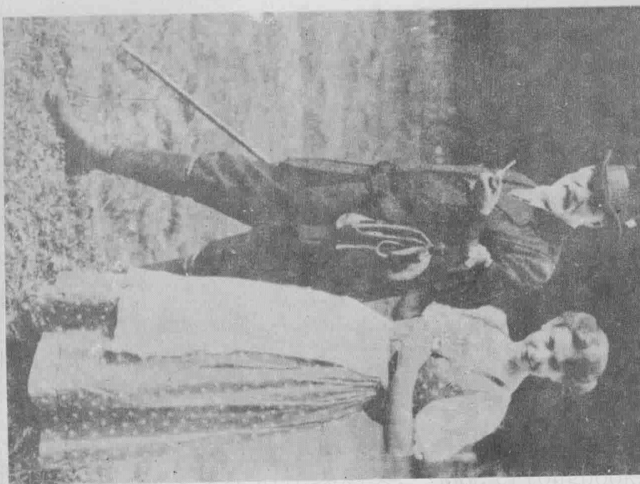
佛洛伊德與其令媛安娜到山野散步。