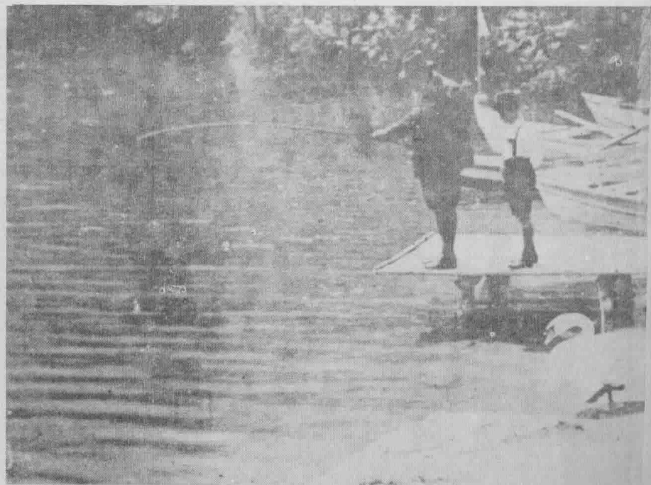
佛洛伊德利用暑假跟他最小的兒子愛倫斯特到河邊釣魚。