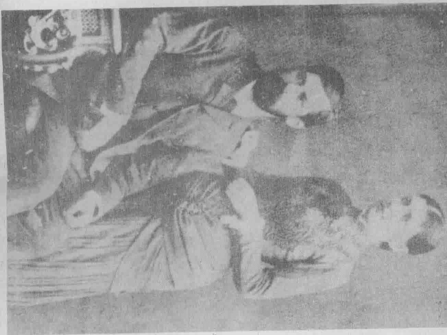
佛洛伊德與其妻子瑪莎合影。