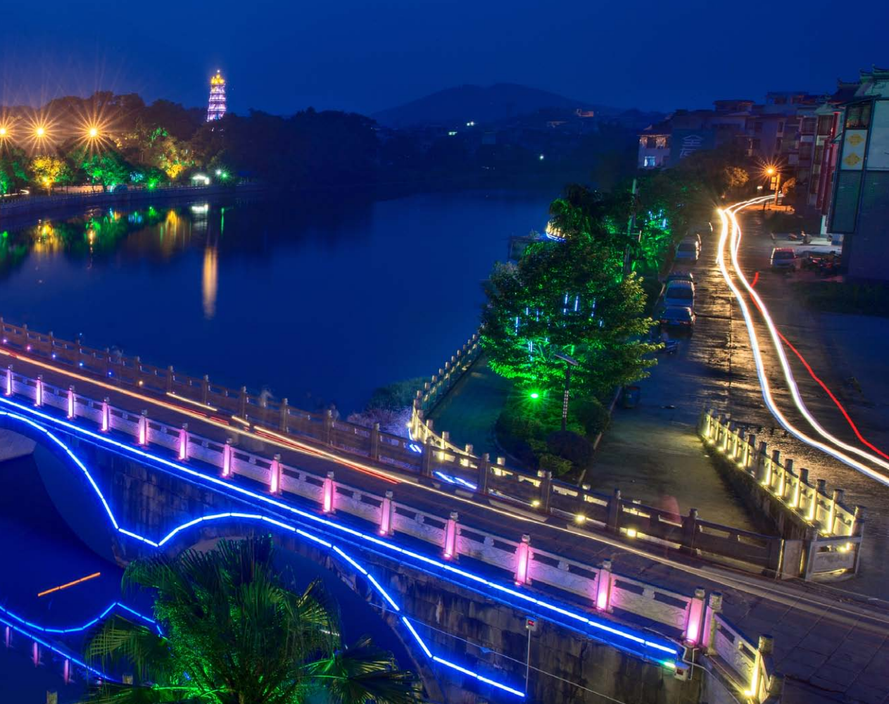
◇ 虹桥溢彩 ◇

软实力。风雨桥群的历史价值不可估量，风雨桥的文化遗存不可替代，其人文价值不可复制。