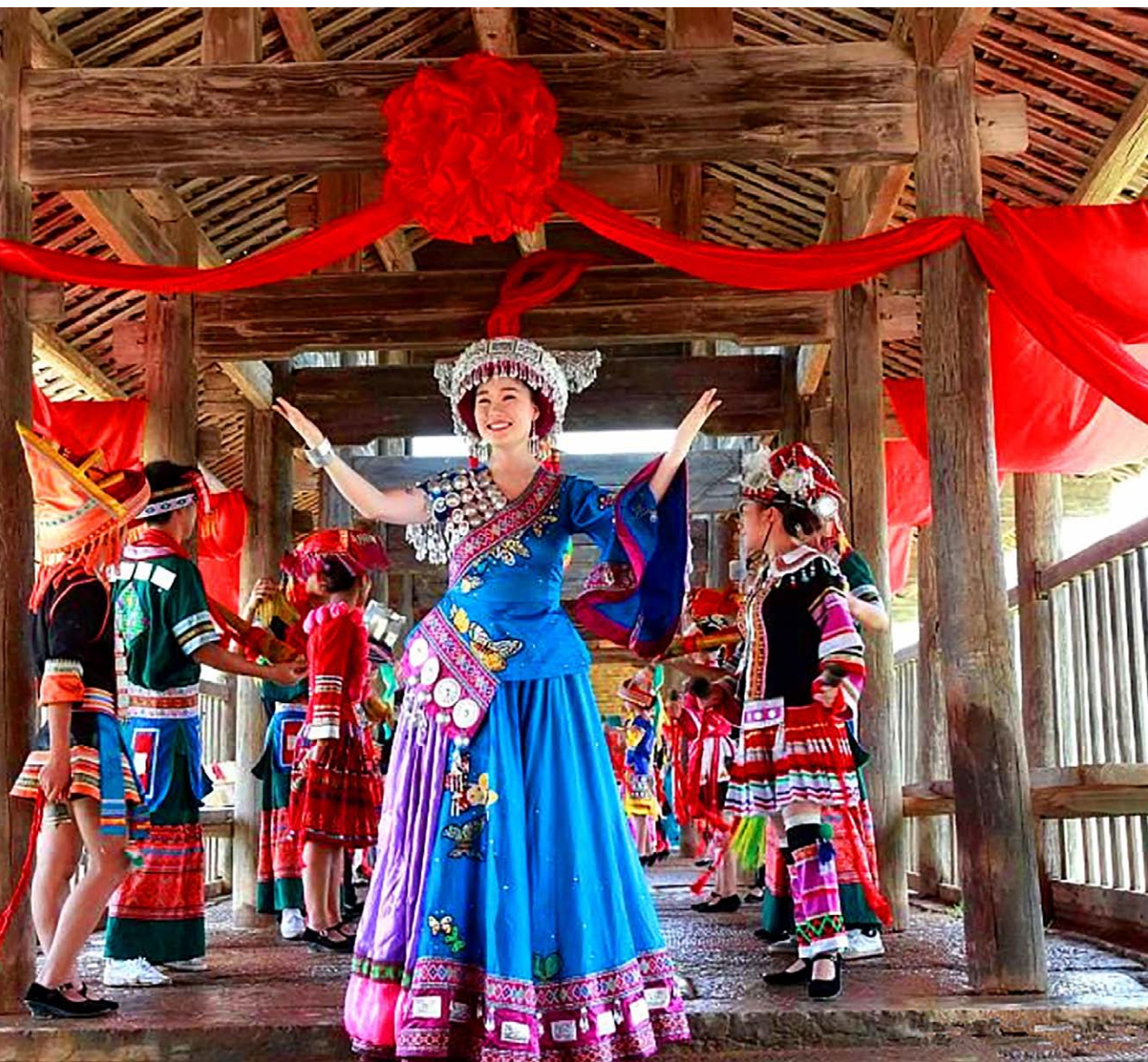
◇ 潇贺长歌 ◇