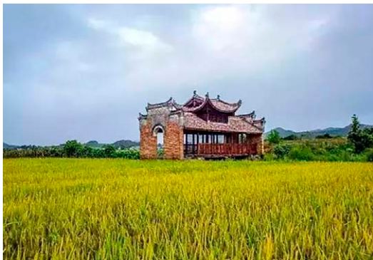
◇ 龙归桥 ◇

富川瑶族风雨桥集山、水、桥、屋于一体，跨越山水，便利交通，将建筑、艺术与科技和谐相融，成为传统文化的重要载体。