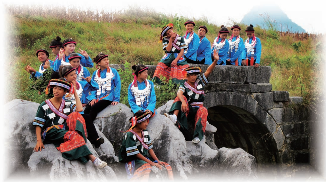
◇ 仙桥春梦 ◇

《箫韶》歌云：卿云烂兮，纠缦缦兮。明明天上，灿然星陈。日月光华，旦复旦兮。虞舜箫韶乐曲美妙动听，当旋律反复变换演奏了九遍的时候，象征祥瑞的神鸟飞来了，雌者为凤，雄者为凰，成双结对，朝仪于山峦。那至善至美的音乐，如一股和煦的春风，甜美的甘霖，让聚居在古富川的百越人情不自禁地丢下弓箭石器，伴着节奏，跳起了原始舞蹈，舜帝也加入到乐舞中。