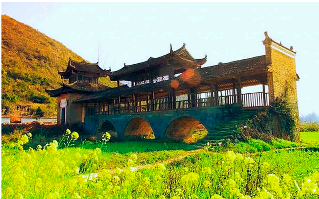
◇ 廊桥印象 ◇

正因为其形制奇特、造型优美、工艺精致、独具民族特色，“富川瑶族风雨桥群”于2013年被国务院公布为第七批全国重点文物保护单位。