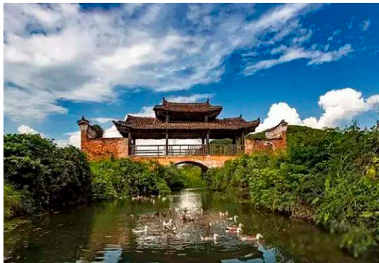
◇ 廊桥生态 ◇