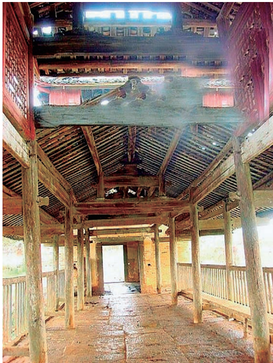
◇ 富川廊桥内部结构 ◇

富川瑶族风雨桥的典型代表是石券廊桥，它集北方石券、南方亭阁、瑶族栏杆和徽派马头墙五位一体，融合交通、避雨、歇息、集会等功能于一身，荟萃风水、风光、风情、风貌于一景。石券廊桥为砖木混构，顶盖青瓦、马头骑墙、飞檐重山、吊脚杆栏，桥亭阁廊浑然天成，风格典雅别致，为中华古建筑史上的一大奇观。