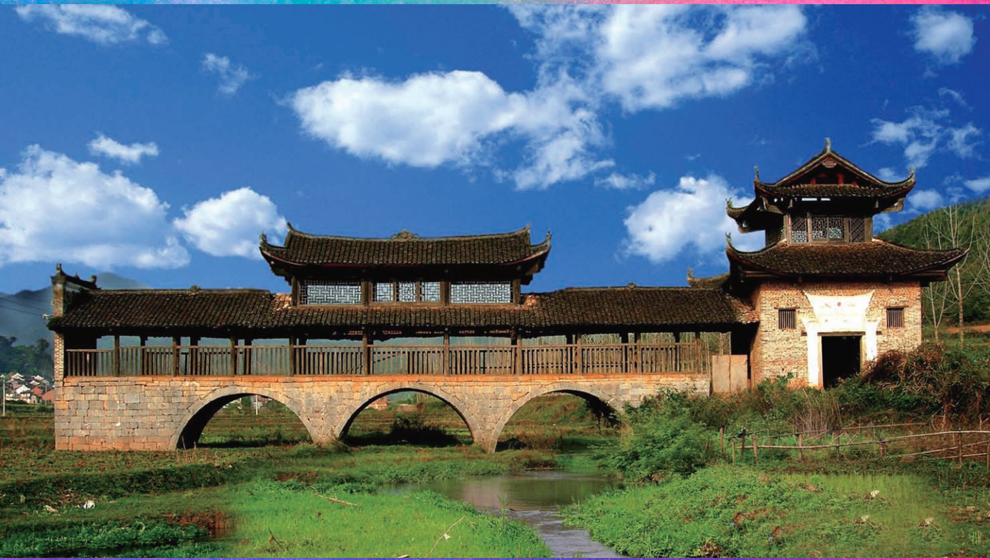
◇ 回澜风雨桥 ◇

有一种美丽，让美丽的山水田园成为背景，赤橙黄绿的彩虹，悬挂着乡愁的记忆。 有一种璀璨，让璀璨的楼台亭阁成为配角，百年流筋的桥廊，剪贴成故乡的情影。 有一种沧桑，让沧桑的秦砖汉瓦成为昨天，飞檐翘角的杆栏，昂扬起明月清风的时尚。 有一种诗意，让诗意的唐诗宋词成为意象，廊桥坐夜的歌堂，伴和着鸟语花香的和弦。 啊，风雨桥， 瑶家的五彩风衣， 历史的多元雨披。