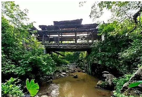
◇ 高桥 ◇