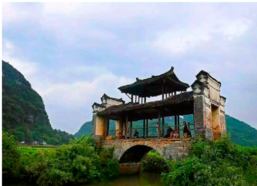
◇ 山水桥人 ◇