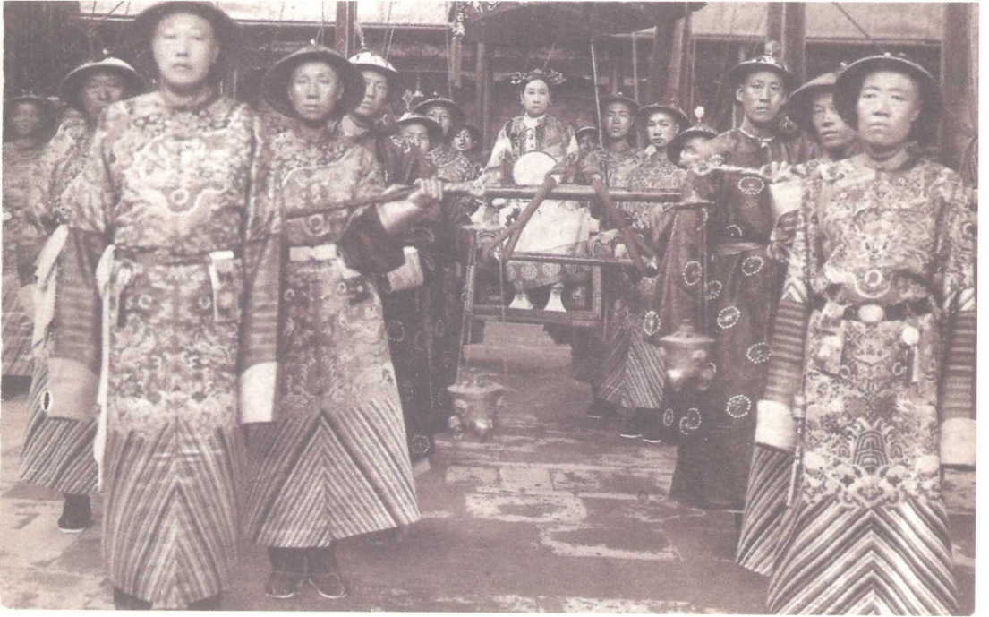
慈禧太后出行。右前方第一人为大太监李莲英。（明信片）