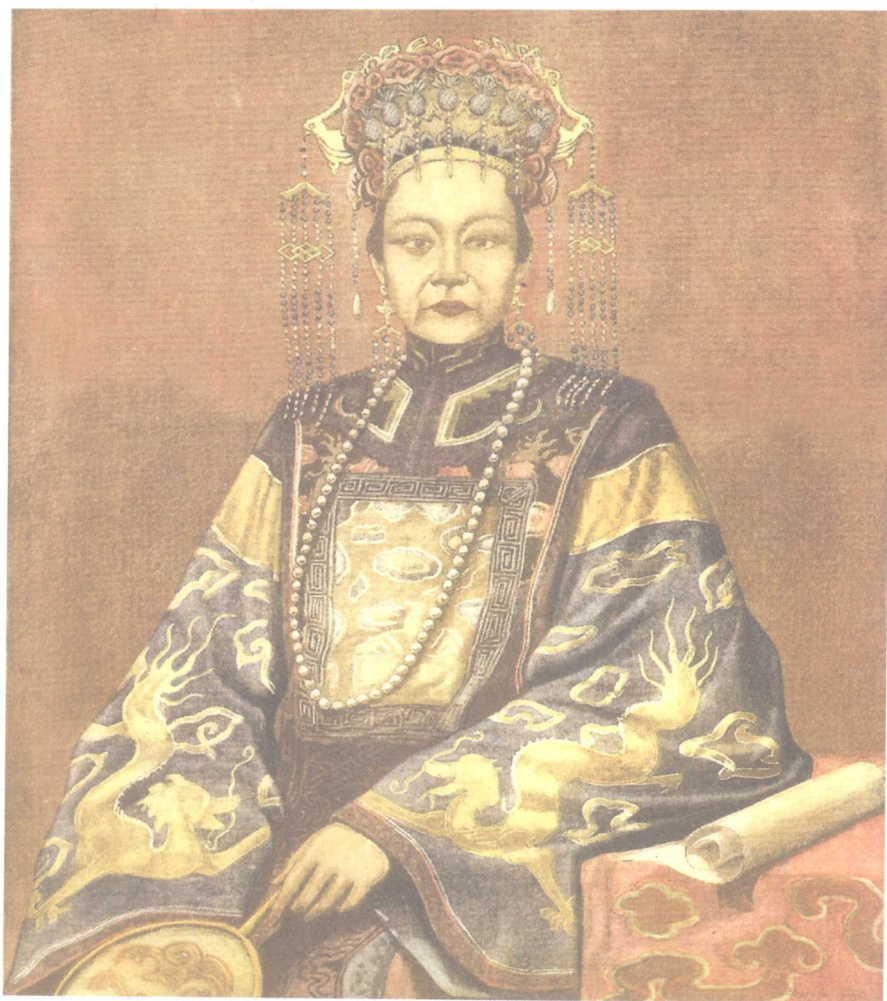
西方画家笔下的慈禧太后是一个统治中国近50年的令人生畏的女王形象。