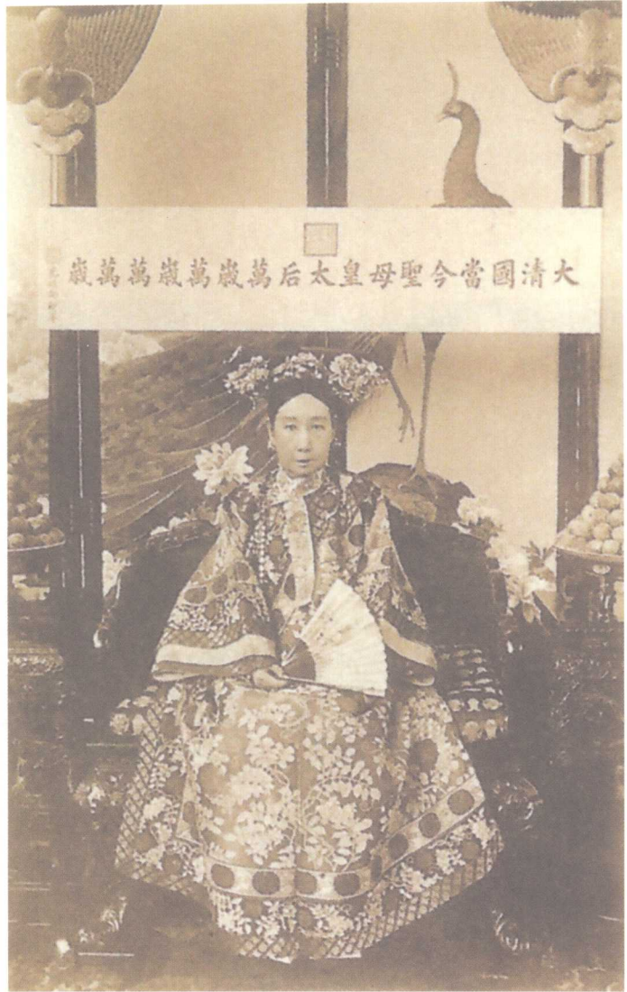
慈禧太后，滿族人，道光十五年十月十日（1835年11月29日）出生，光緒三十四年十月二十二日（1908年11月15日）病亡。又稱“西太后”“老佛爺”。她是晚清政府腐敗殘暴、軟弱無能的總代表。（明信片）