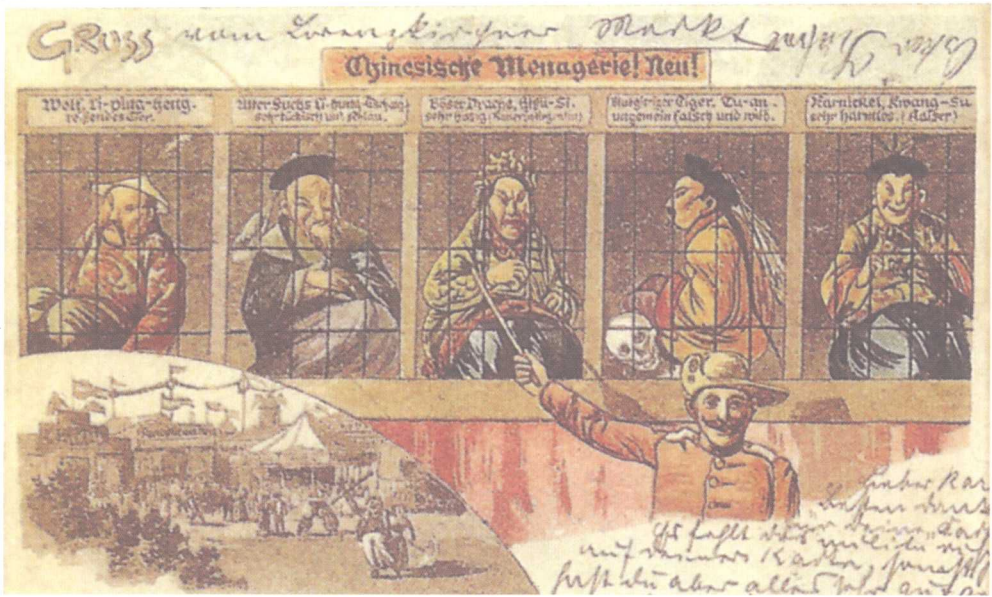
被关押在监狱中的慈禧太后和大臣。（漫画明信片）