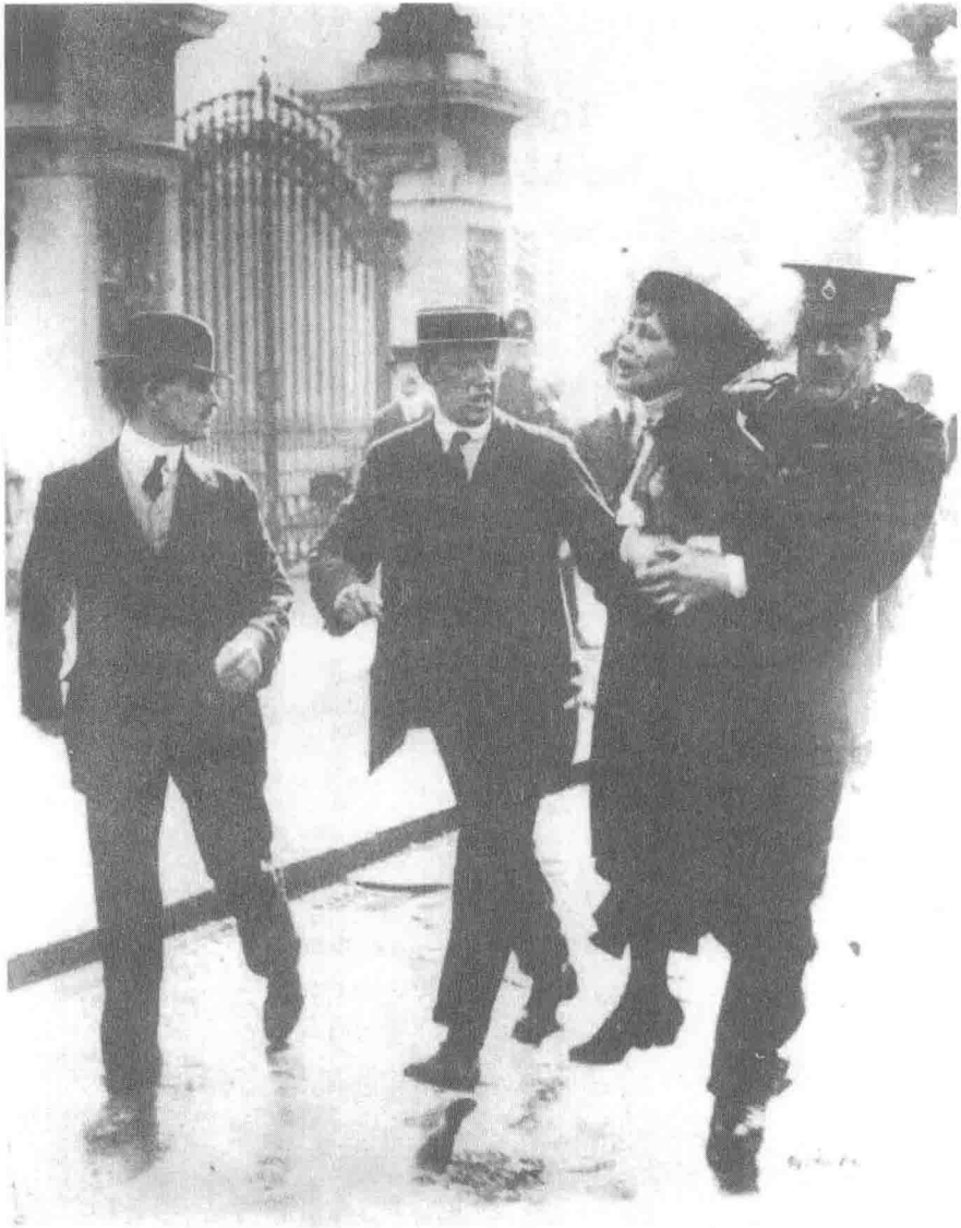
卷首插图 “潘克赫斯特夫人被捕”