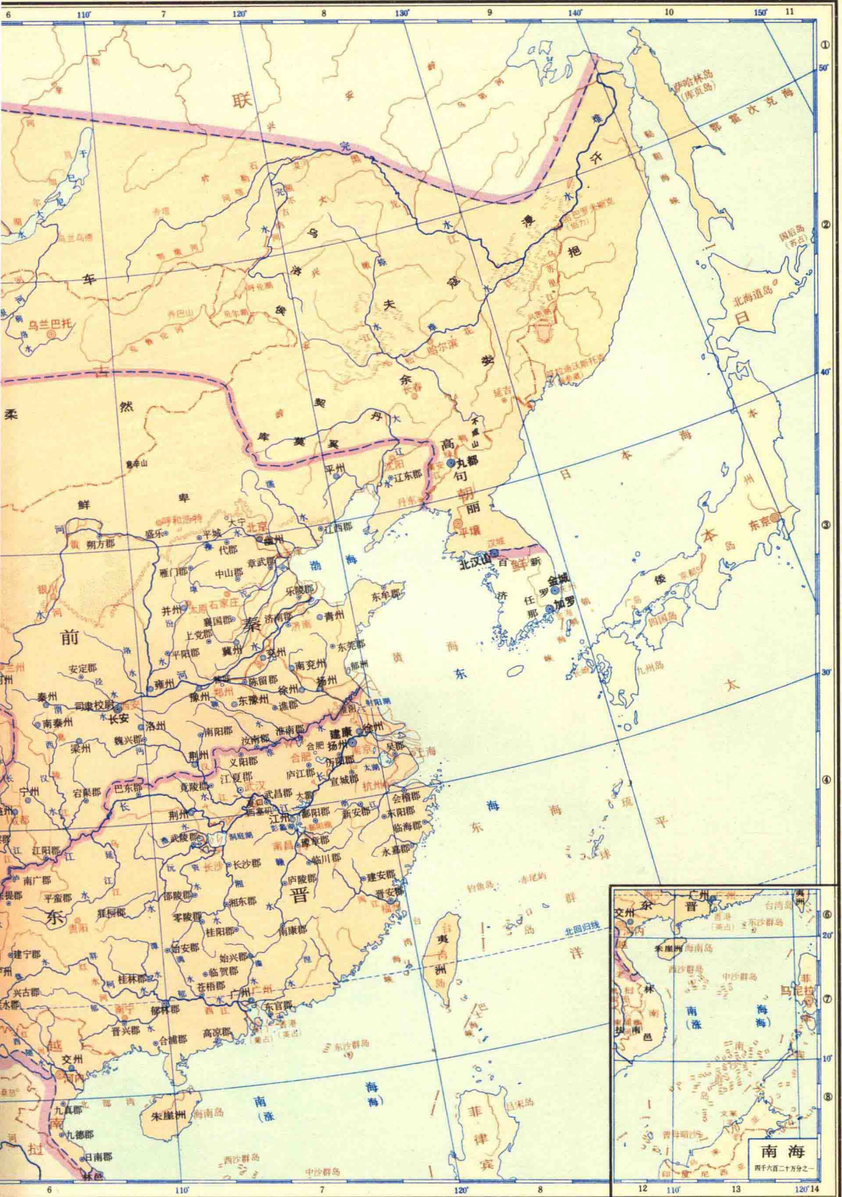
比例尺 二千一百万分之一 200 0 200 400 600 800公里