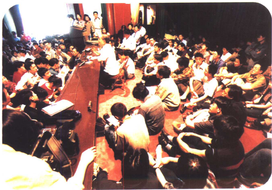
电教楼报告厅讲台上席地而坐的听众