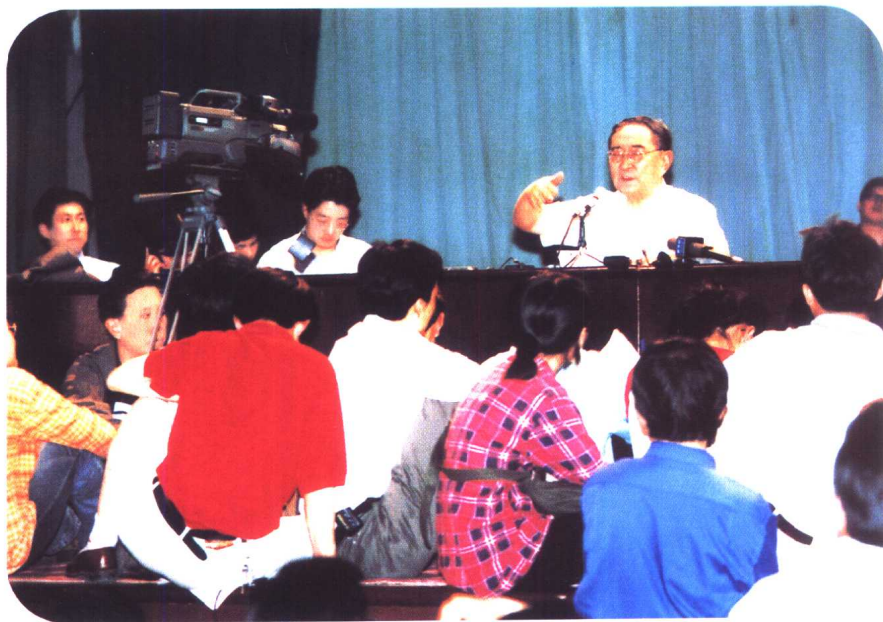
连讲桌前面的空隙也坐满了人