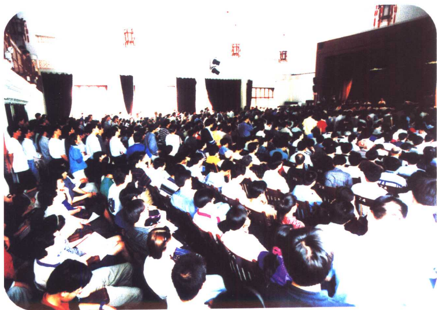
办公楼座位有限，所有的过道都挤得水泄不通