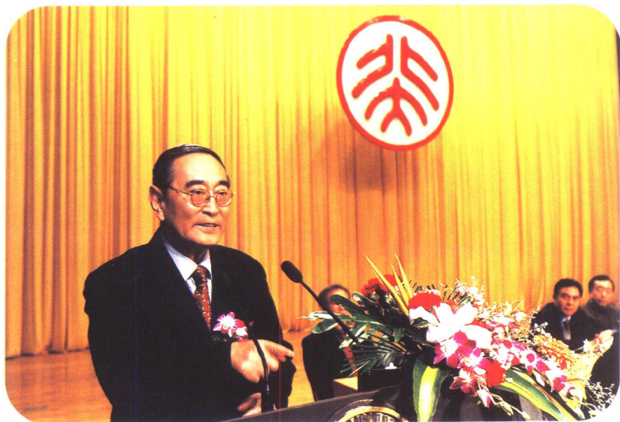
厉以宁在作学术报告