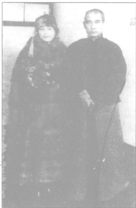
1924年，孙中山与宋庆龄乘“上海丸”轮船取道日本转赴天津。