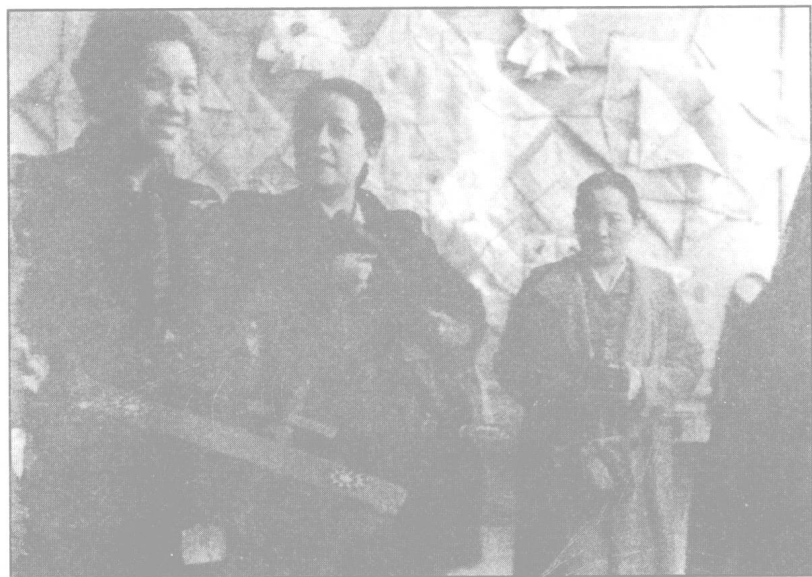
宋蔼龄（中）、宋庆龄（右）和宋美龄（左）在重庆参加抗日献机报国活动。