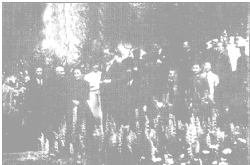
蒋介石，宋美龄访问印度。