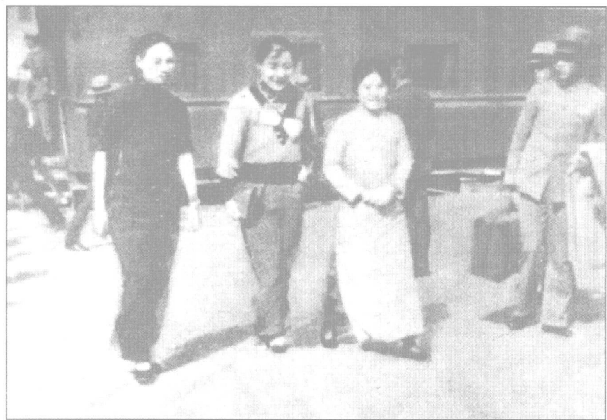
1934年10月12日，谢葆真（左一，杨虎城夫人）傅学文（右一 邵力子夫人）在陕西渭南车站迎接宋美龄（中）。