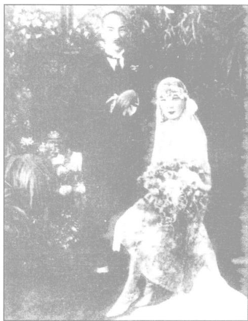
1927年12月1日，蒋介石与宋美龄在上海按基督教礼仪结婚。