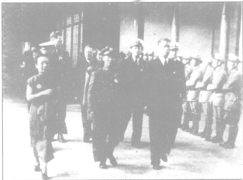
国民党行政院长宋子文与军政部长陈诚步入国民政府。