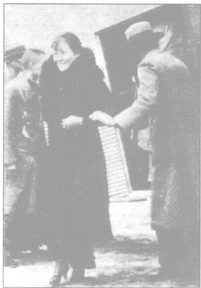
1936年，宋美龄飞抵西安