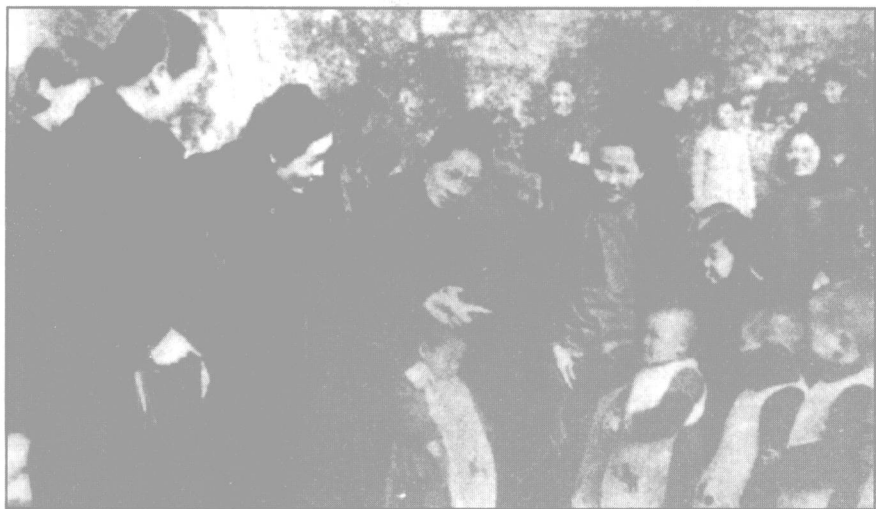
1938年末，宋氏姐妹在重庆抗战儿童福利院与孩子们交谈。