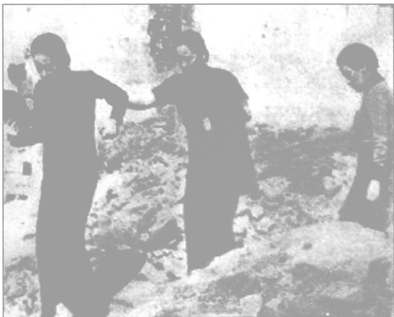
宋蔼龄、宋庆龄、宋美龄三姐妹视察被炸的重庆市區。