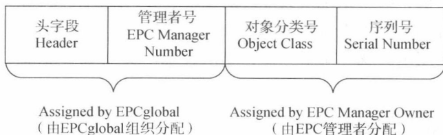
图 1-3 EPC 编码结构

EPC 编码体系是 EPC 系统中很重要的一部分,它是由 EAN/UCC 基于原有的全球统一编码体系提出的,对现行编码体系进行了拓展和延伸,它是新一代的全球统一编码体系。EPC 编码将物品及物品的相关信息进行代码化,通过规范、一致的编码建立一种全球通用的信息交换语言。EPC 的目标是为每一物理实体提供唯一标识,它是由一个头字段和 EPC 管理者号、对象分类号、序列号组成的一组数字。其中头字段标识 EPC 的版本号,它使得后面的 EPC 可有不同的长度或类型;EPC 管理者号是描述与此 EPC 相关的生产厂商的信息。EPC 的编码结构如图 1-3 所示。