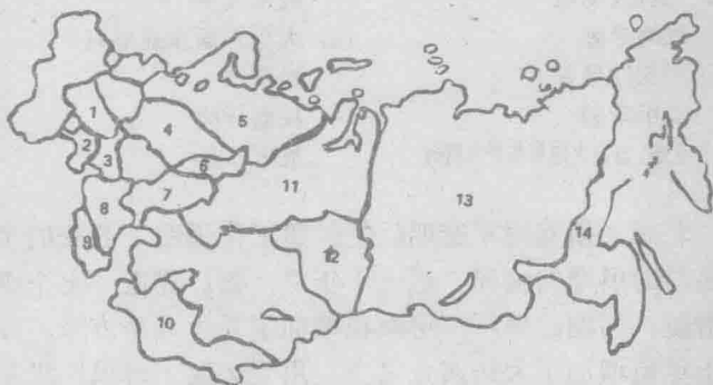
苏联各大区从事军工生产的项目

中间不留停工期。由于循环生产、不断扩充设备和保持很高的产量，军火工业就处于很高的准备状态，可以应付任何紧急情况和对新武器的任何需求。军事工业拥有一百三十五座生产武器成品的大装配厂。三千五百多座工厂和有关的设施对这些进行最后装配的工厂提供支援。