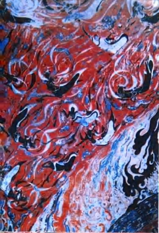
飞天 412窟 隋