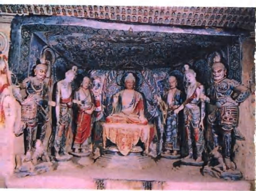
彩塑一铺 45窟 盛唐