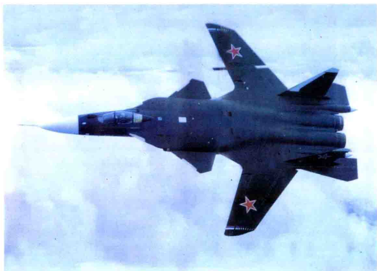
▽ 俄罗斯 S-37 隐身战斗机