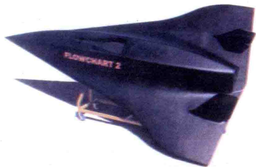
▽ 南非隐身无人机模型