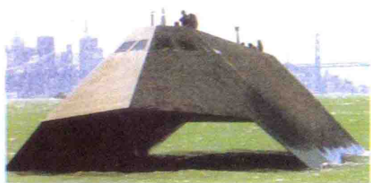
△ 美国“海影”号隐身舰