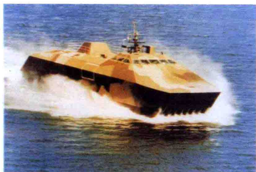
△ 瑞典“斯迈杰”号隐身船