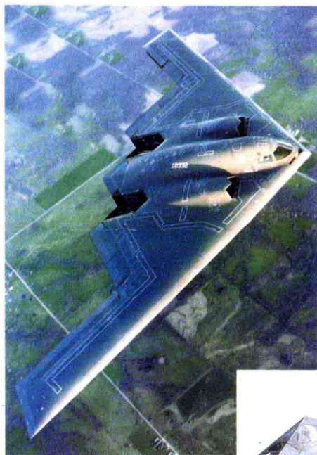
◁ 美国 B-2 型隐身轰炸机