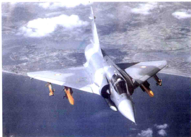
△ 法国幻影 2000 战斗机涂有海、陆、天一体伪装色