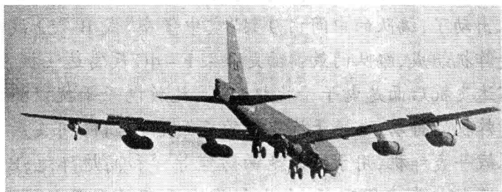
美国B-52型战略轰炸机

B-52飞机有49.05米长，翼展56.4米。飞机总重量达220多吨，它一次可载炸弹27吨。如果选用227千克重的炸弹最多可挂66枚，打开弹舱后可一次投出，地面散布面积达1平方千米，平均25~100米落下一枚炸弹。难怪给它起的绰号叫“空中堡垒”。就是这样一个庞然大物，在这次才十几天的战役中，一连就有10余架被打了下来，实在令美国人痛心。虽然这与其在整个越南战争期间损失4000多架飞机相比是个小数目，但B-52战略轰炸机一次战役内竟然损失这么大，还真没有过。这也说明越南北方的地对空导弹对美国飞机威胁太大了。