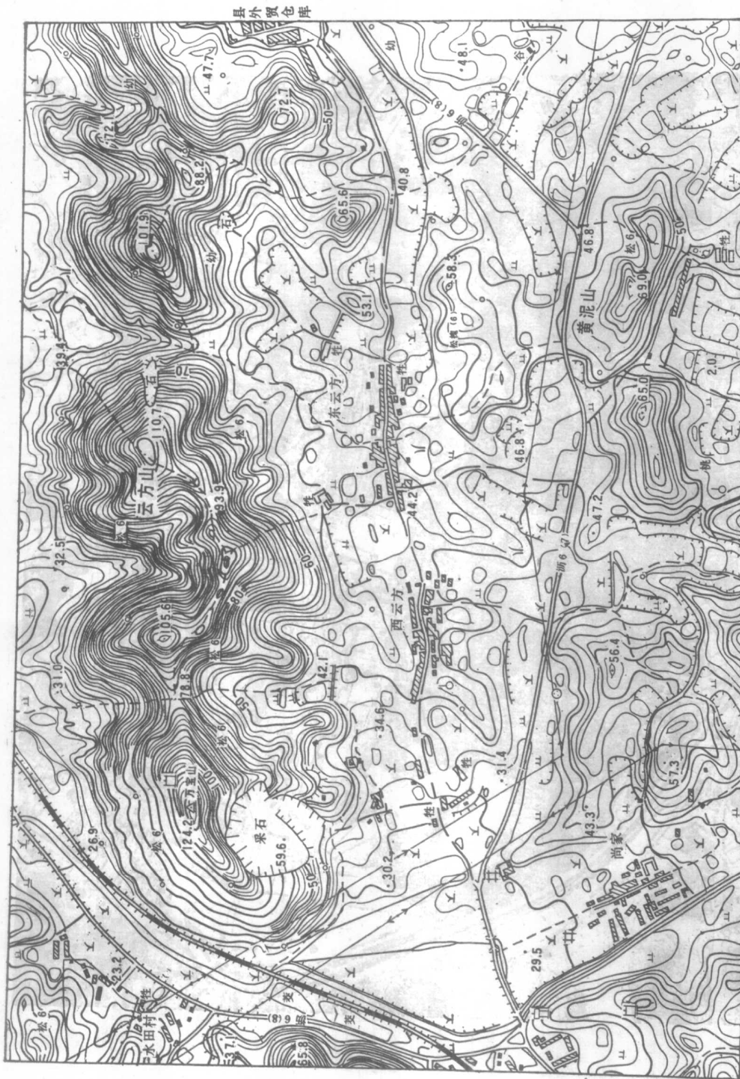
图 1-1(c) 地形图