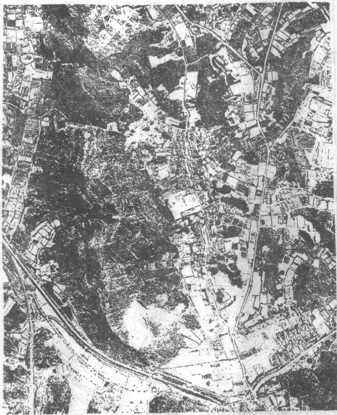
图 1-1 (9) 航空象片