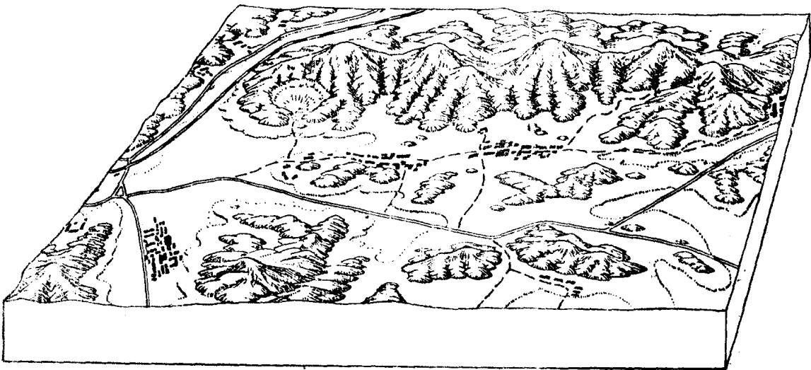
图 1-1 (a) 地貌素描

地理事物的形状、大小、性质等的特征千差万别,十分复杂。如果全部按他们的原貌缩绘在地图上,则将杂乱无章,也不可能。制图者必须运用制图综合的原则与方法,对地理事物按某些共同特征进行分类和分级,加以典型化,并采用直接对视感发生作用的各种颜色、形状、大