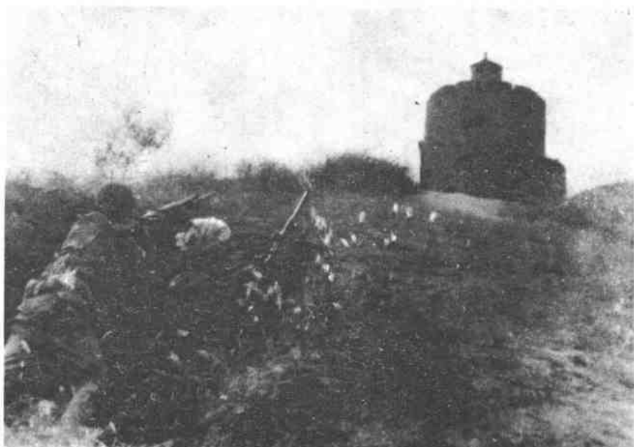
军民并肩战斗，对敌据点进行围困战