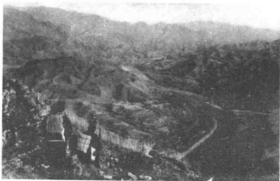
三五成群，忽隐忽现，对敌进行“麻雀战”