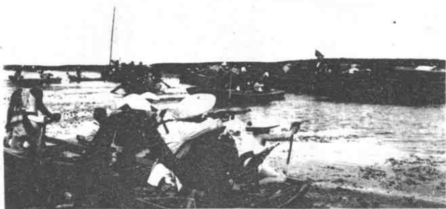
我水上游击队勇猛袭击敌人