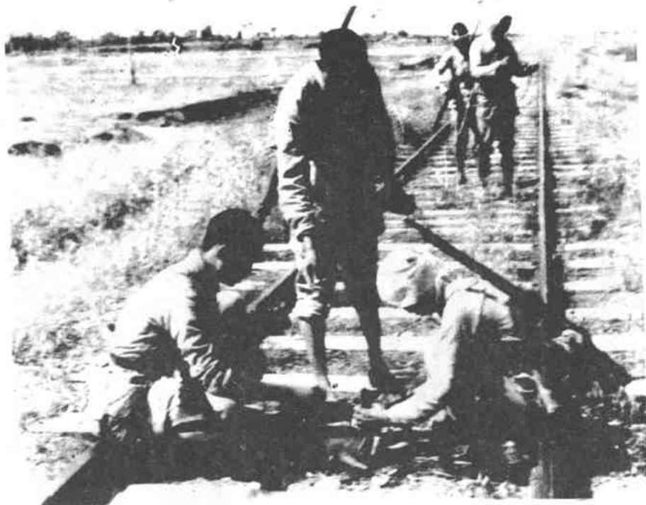
我民兵游击队在铁路上埋雷，炸敌军用列车