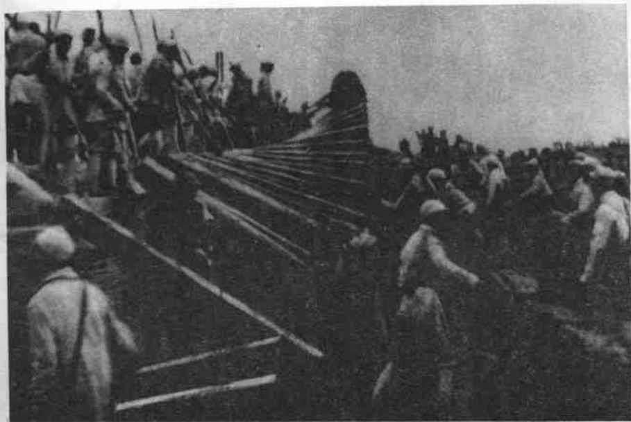
陇海线上我军进行破击战