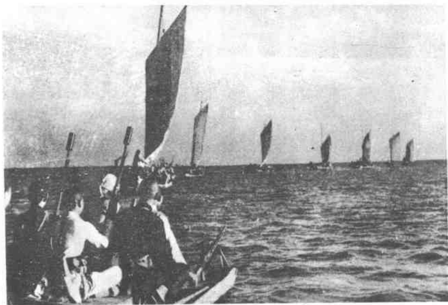
在活动中的我水上游击队