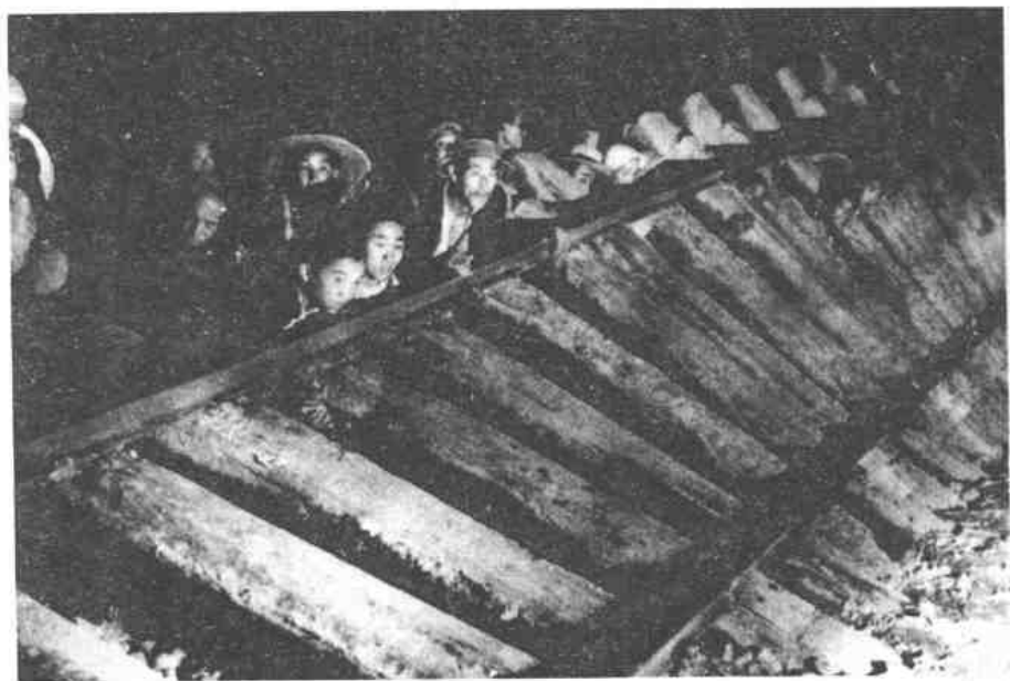
民兵游击队和群众破坏敌交通线