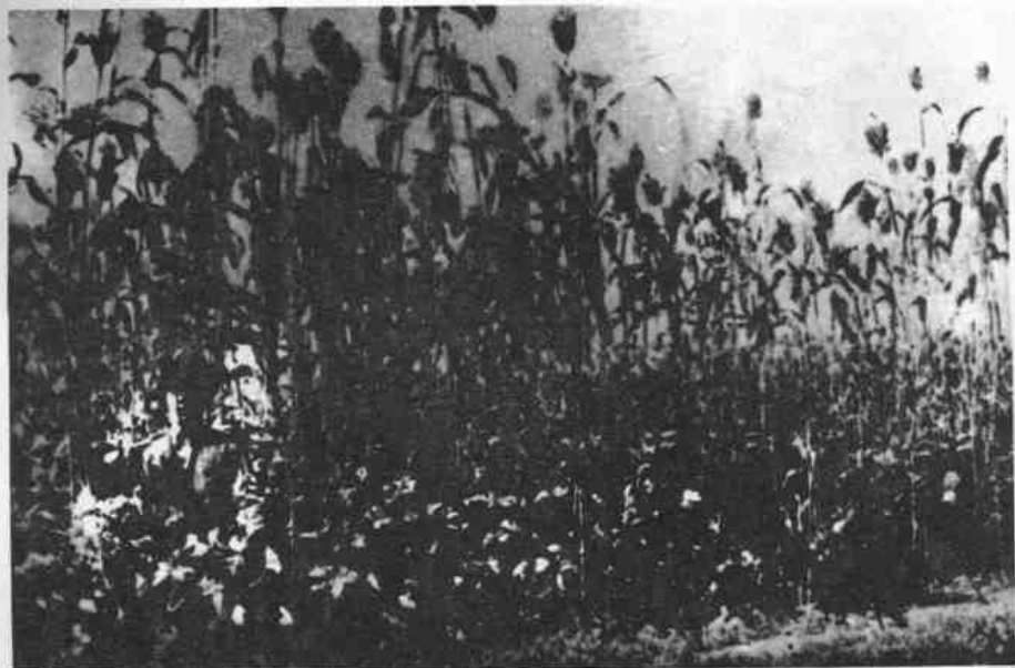
我军游击队利用青纱帐伏击敌人