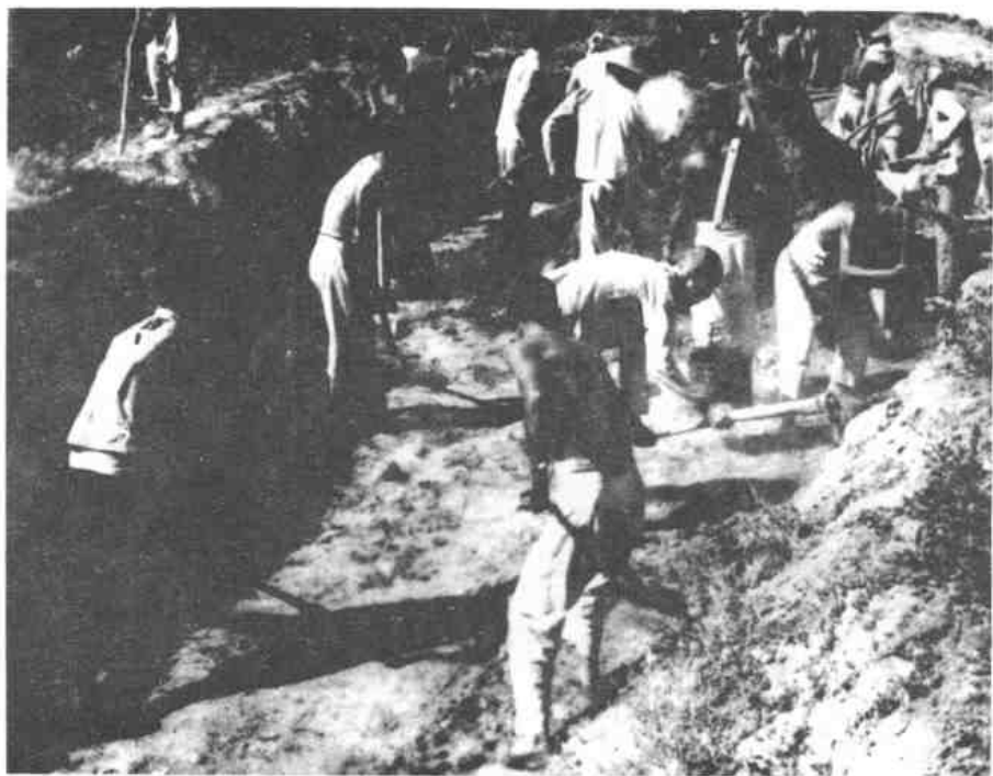
民兵和群众挖沟破路，阻止敌车辆机动