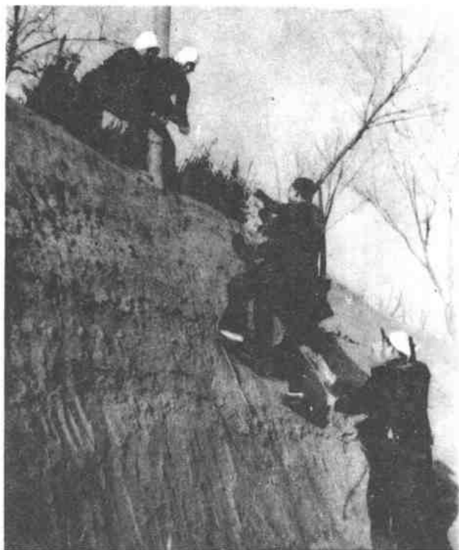
我武工队通 过敌封锁沟， 深入敌后开展 游击战