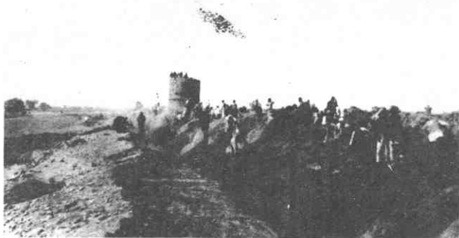
游击队和群众破坏敌封锁沟，为我大兵团 作战扫除障碍