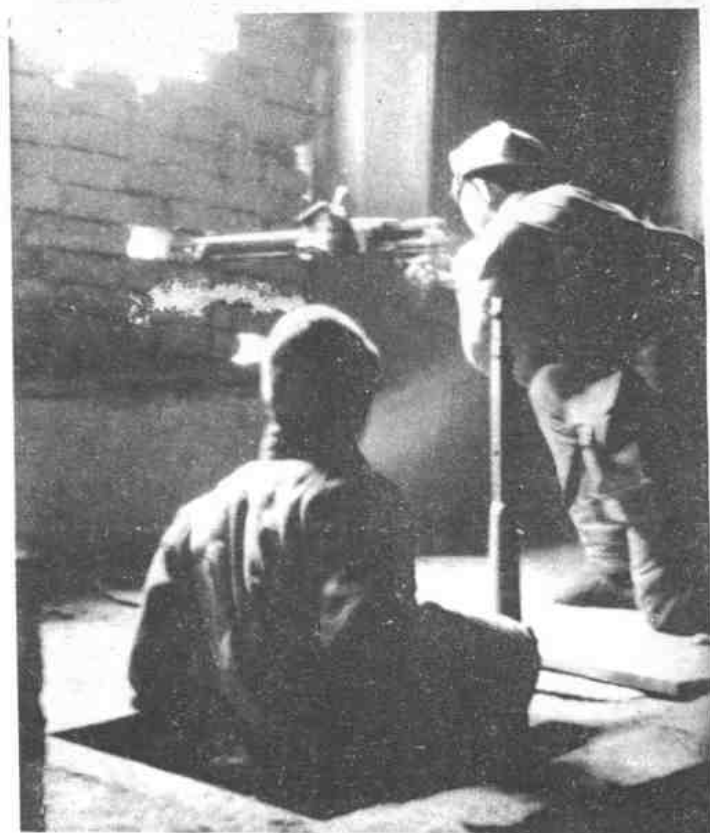
军民协力， 利用地道机动，灵活打击 敌人