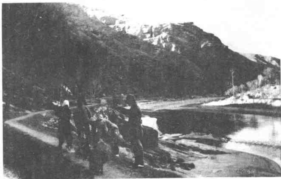
军民配合，在敌可能经过的道路上埋雷