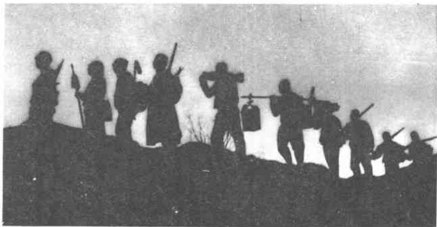
我游击队夜间出发，前往袭击敌人