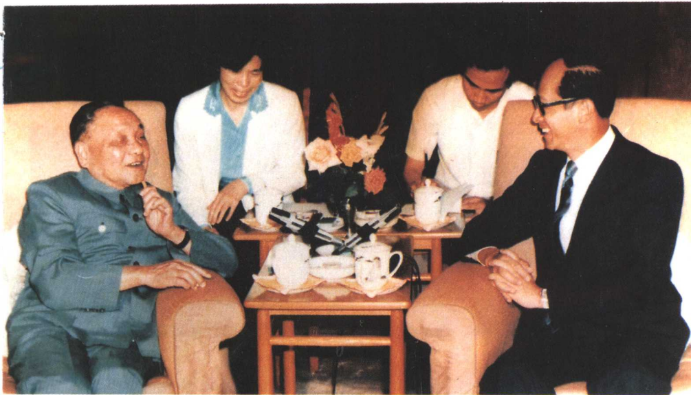
一九八六年六月二十日，邓小平会见李嘉诚