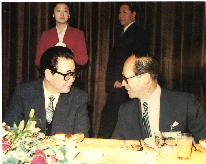
李鹏总理和李嘉诚在宴会上亲切交谈