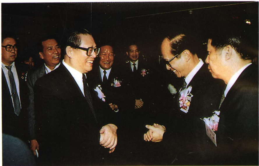
一九九一年江泽民总书记在汕头特区会见李嘉诚