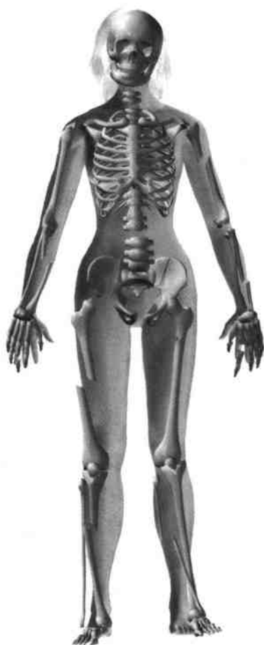
他杀坠落受伤状况