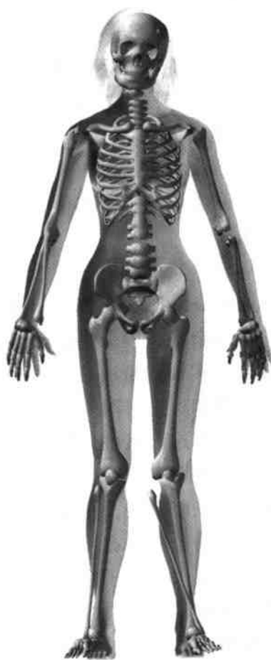
自杀坠落受伤状况