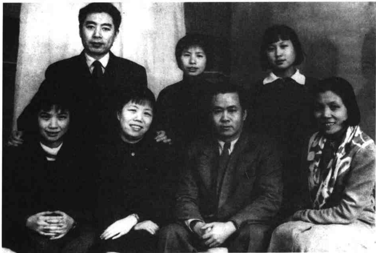
1940年初，和邓颖超在莫斯科同中共驻共产国际代表团负责人任弼时等合影。右起：蔡畅、张梅、任弼时、陈琼英、邓颖超、周恩来、孙维世。