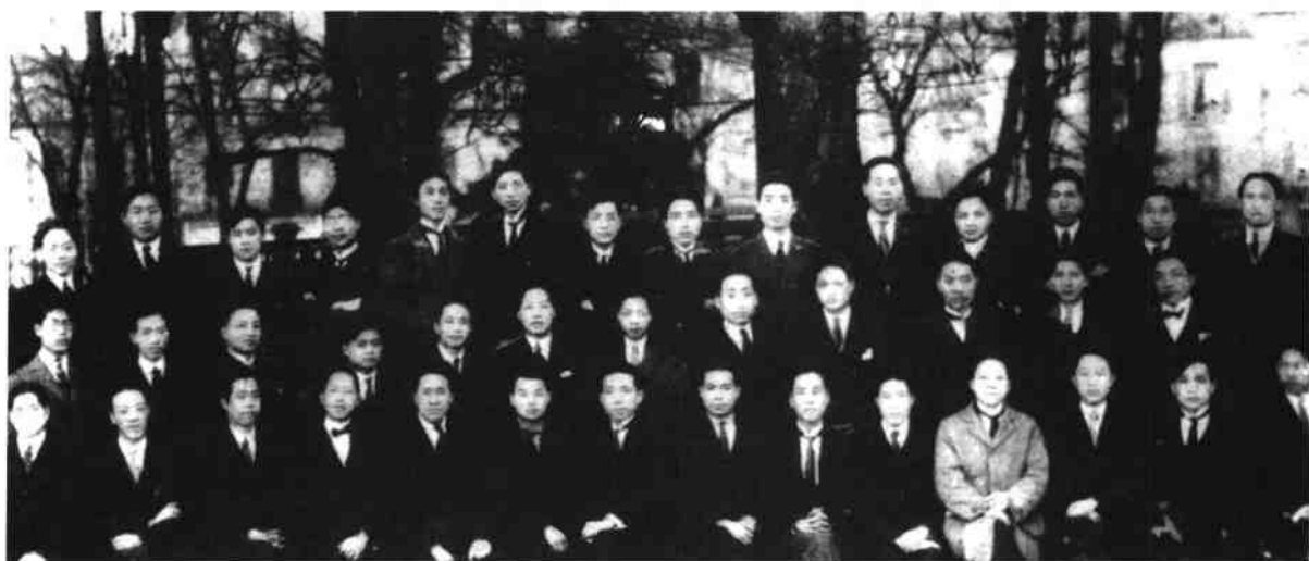
1922年6月，赵世炎、周恩来等在巴黎成立旅欧中国少年共产党。这是参加成立大会的成员在巴黎郊外布伦森林合影。后排右六为周恩来；前排左二为赵世炎，左八为陈延年，左十一为王若飞。1923年2月，中国少年共产党召开临时代表大会，决定改名为中国社会主义青年团旅欧支部，周恩来任书记。