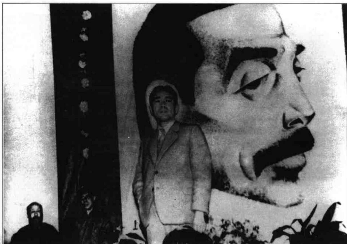
1946年10月19日，出席上海各界纪念鲁迅逝世十周年大会，强调“只要和平有望，仍不放弃和平的谈判，即使被逼得进行全面自卫抵抗，也仍是为争取独立、和平、民主、统一”。