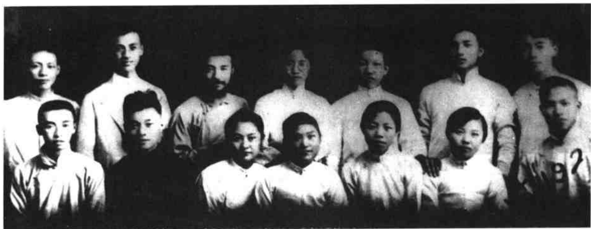
觉悟社部分成员合影。后排右一为周恩来，右五为马骏， 右三为郭隆真；前排右二为刘清扬，右三为邓颖超。