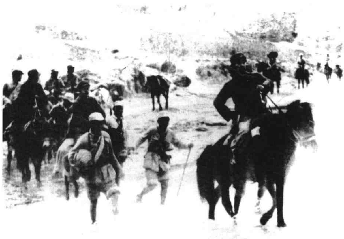
周恩来（前右一骑马者）和毛泽东（前右三骑马者）、任弼时（前右二骑马者）在转战途中。