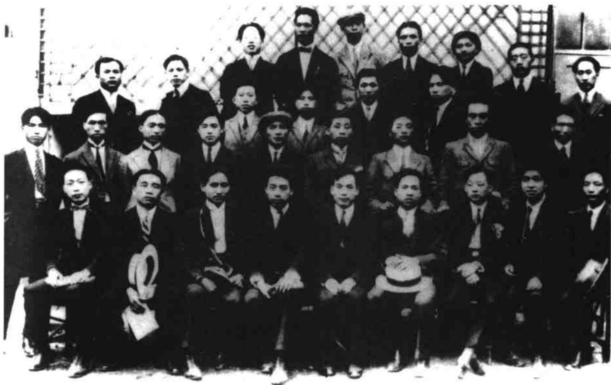
1924年，中国社会主义青年团旅欧支部部分成员在巴黎合影。前排左四为周恩来，左六为李富春，左一为聂荣臻；后排右三为邓小平。