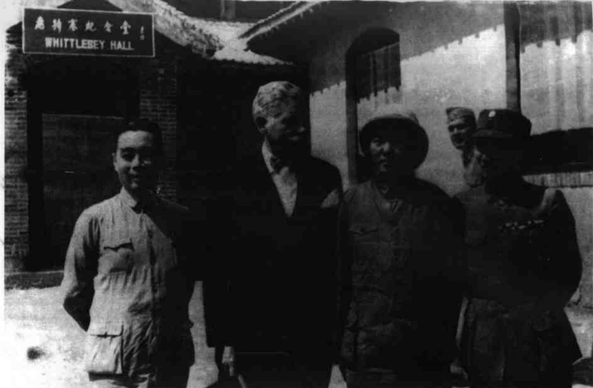
毛泽东、周恩来离开延安时，同张治中、赫尔利在驻延安美军观察组住处前合影。