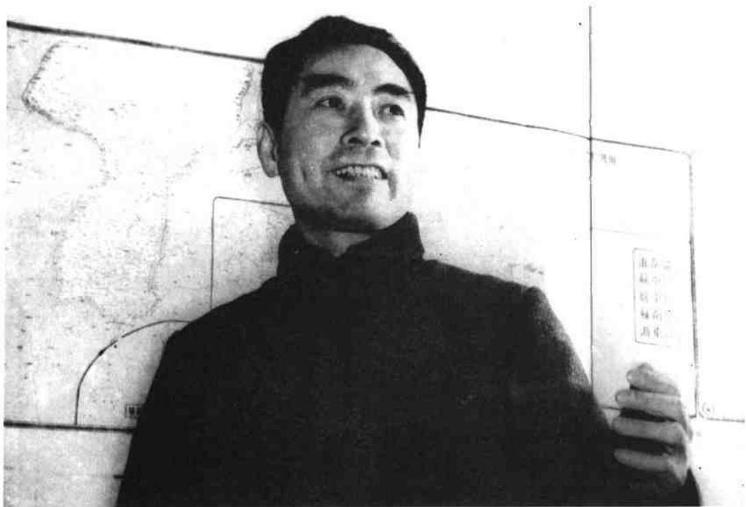
重庆时期的周恩来