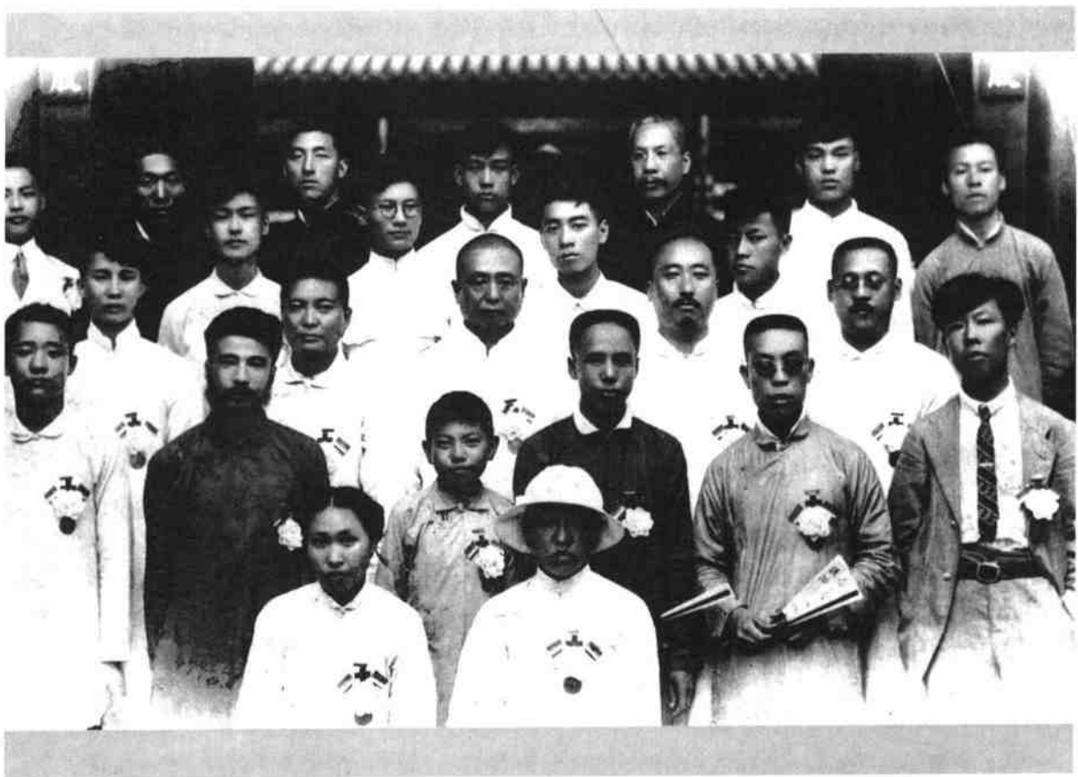
1920年1月，周恩来等在反帝爱国运动中被北洋军阀政府天津警察厅拘捕。在他们坚决斗争和各界爱国群众的声援下，反动当局被迫于7月将他们释放。这是周恩来等出狱后的合影。