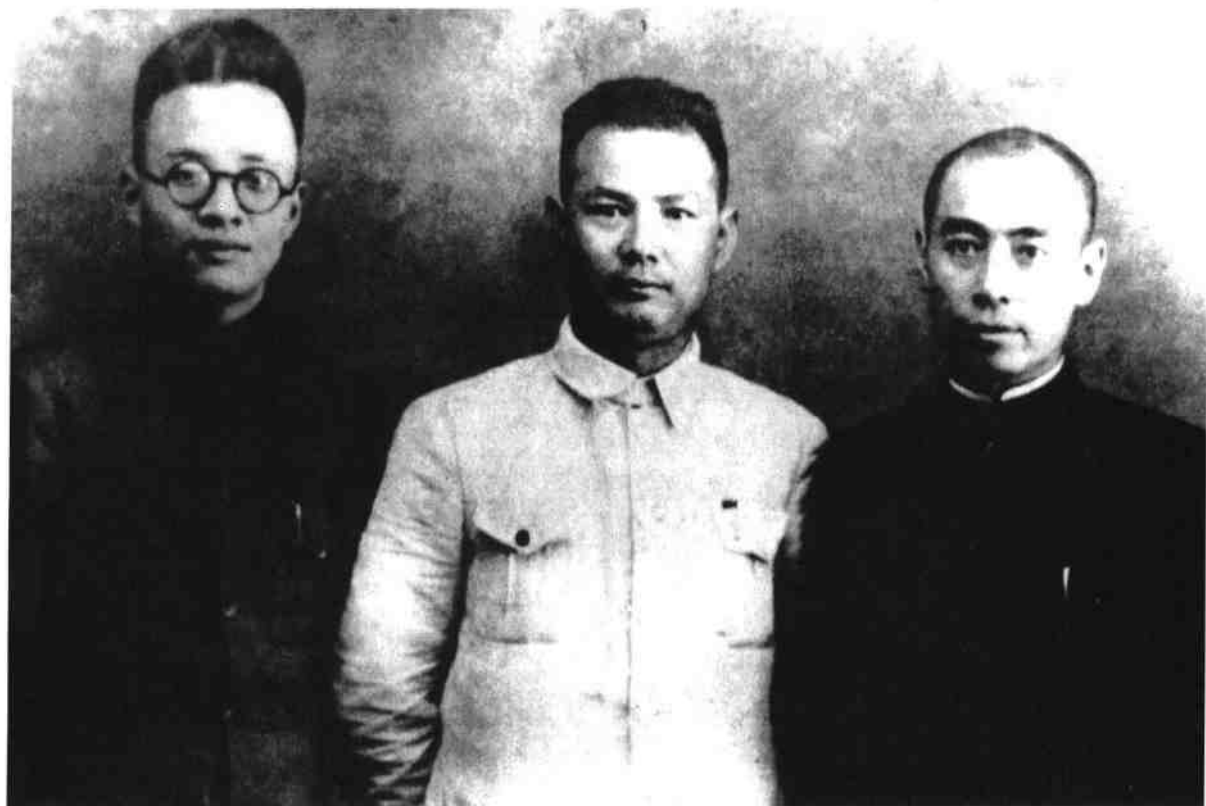
和秦邦宪（左一）、叶剑英（左二）在西安合影。