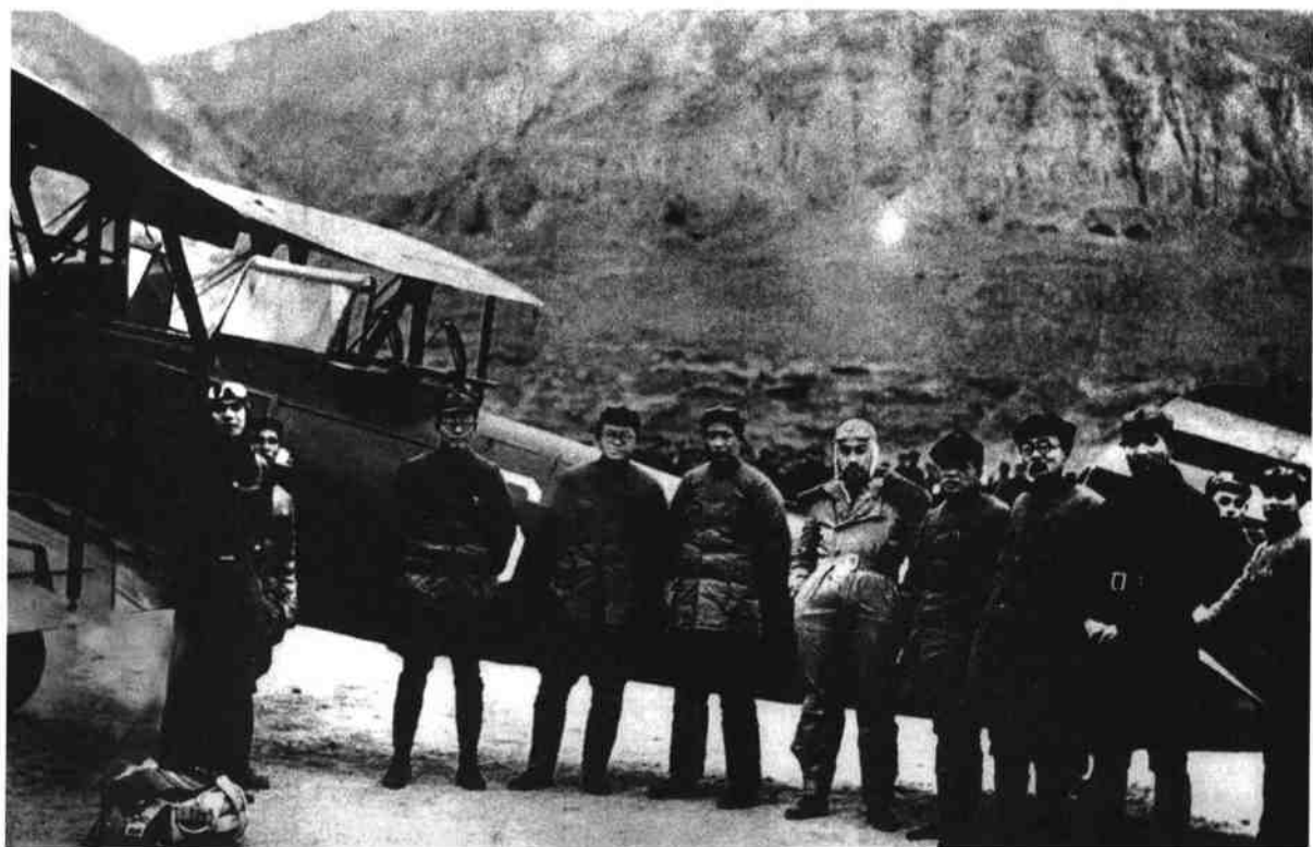
西安事变和平解决后，周恩来返抵延安时，在机场受到中央领导人欢迎。左三起：秦邦宪、张闻天、毛泽东、周恩来、彭德怀、林伯渠、肖劲光。