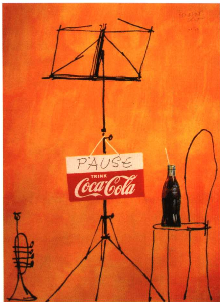
图 1.6 可口可乐海报