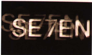
图 1.4 电影片头设计

而是投合目标买主所追求与向往的形象,进而使品牌形象在消费者的心中留下深刻的记忆。广告设计的视听表现还作用于人们对新事物的认知态度上,即说明和诱导人们接受一种有利于产品营销的新观念以及与之相关的价值观、生活观,由此接受新的生活方式。由于广告的提示,唤起人们对新产品的兴趣,激发人们利用新产品来改善和美化生活的奇思构想。连续不断的社会化的广告宣传,犹如催化剂一般,可以将广告设计作品中的概念演变成一种新的社会需求。(见图 1.5)