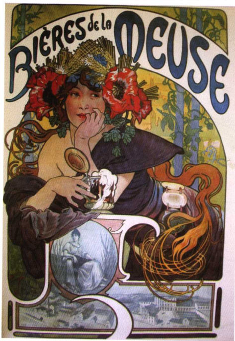
图 1.2 穆卡的海报设计

随着大量生产与大量消费的资本主义经济体制逐步建立,城市化进程中现代生活方式的形成,商品零售和广告业这两项既能满足又能刺激市场需求的商业方式得