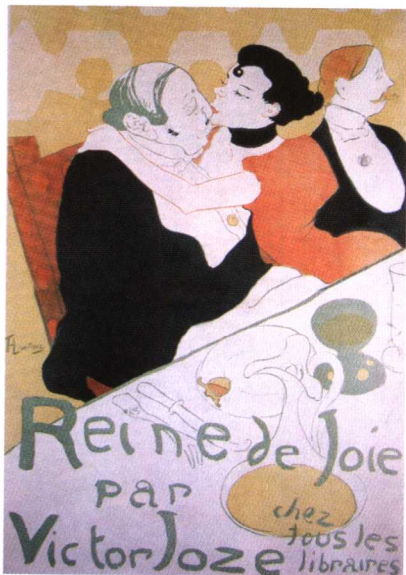
图 1.1 劳特累克海报设计

广告设计在内容和形态上的转变,反映出广告设计与不同时代的社会背景密切相关,影响设计风格的作用力其实是社会、政治、经济、技术、文化等各项因素综合作用的结果,而且在一定程度上也与意识形态的起落或宽松与否有密切的关系。因此,广告设计从一个侧面揭示了特定时代、特定社会的种种变迁,如媒介的传播速度、广度和技术的更新发展,经济和社会变革的力量对商业、市场活动的影响,人们对美与审美的文化视角的不断调整和提升,以及设计专业化、职业化的进程。