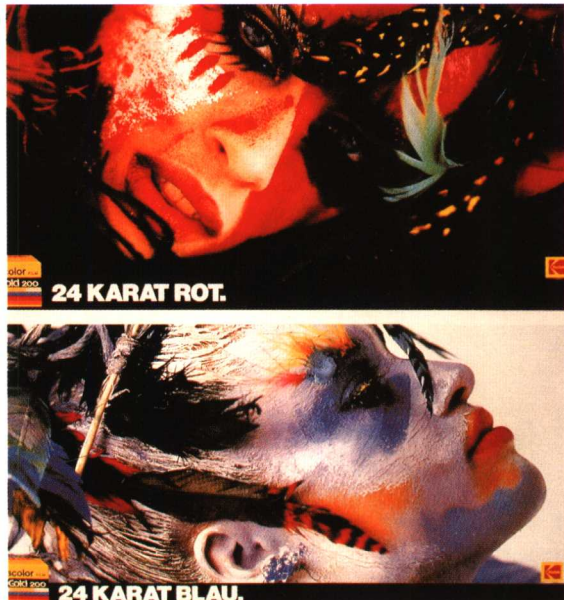
图 1.5 柯达广告

就广告表现的自由性而言，在广告作品中，视觉效果是至关重要的。围绕这个中心，艺术表现形式有较大的自由，可以运用各种绘画、摄影、喷绘、暗房技巧、制版与印刷技术、电脑特技等手段来强化广告设计作品的视觉效果和艺术魅力。