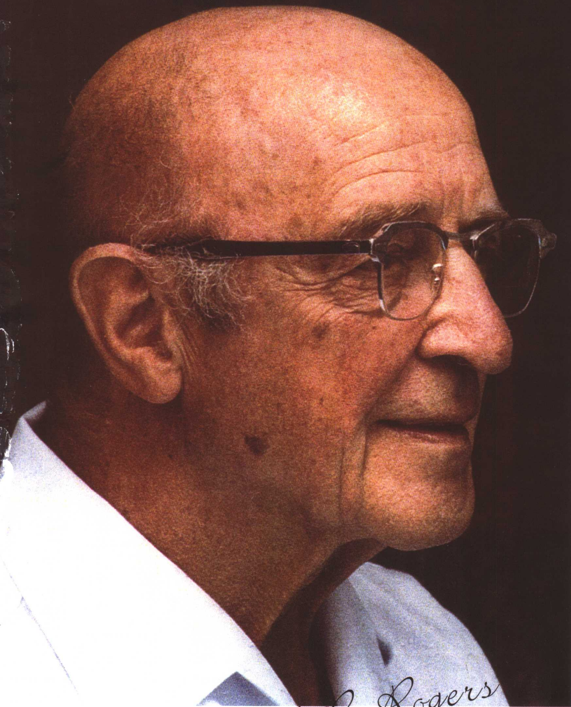
Carl R. Rogers