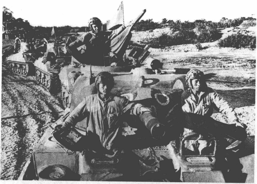
1945年，中国远征军所属第一临时坦克集群装备的美制M4A4型坦克。