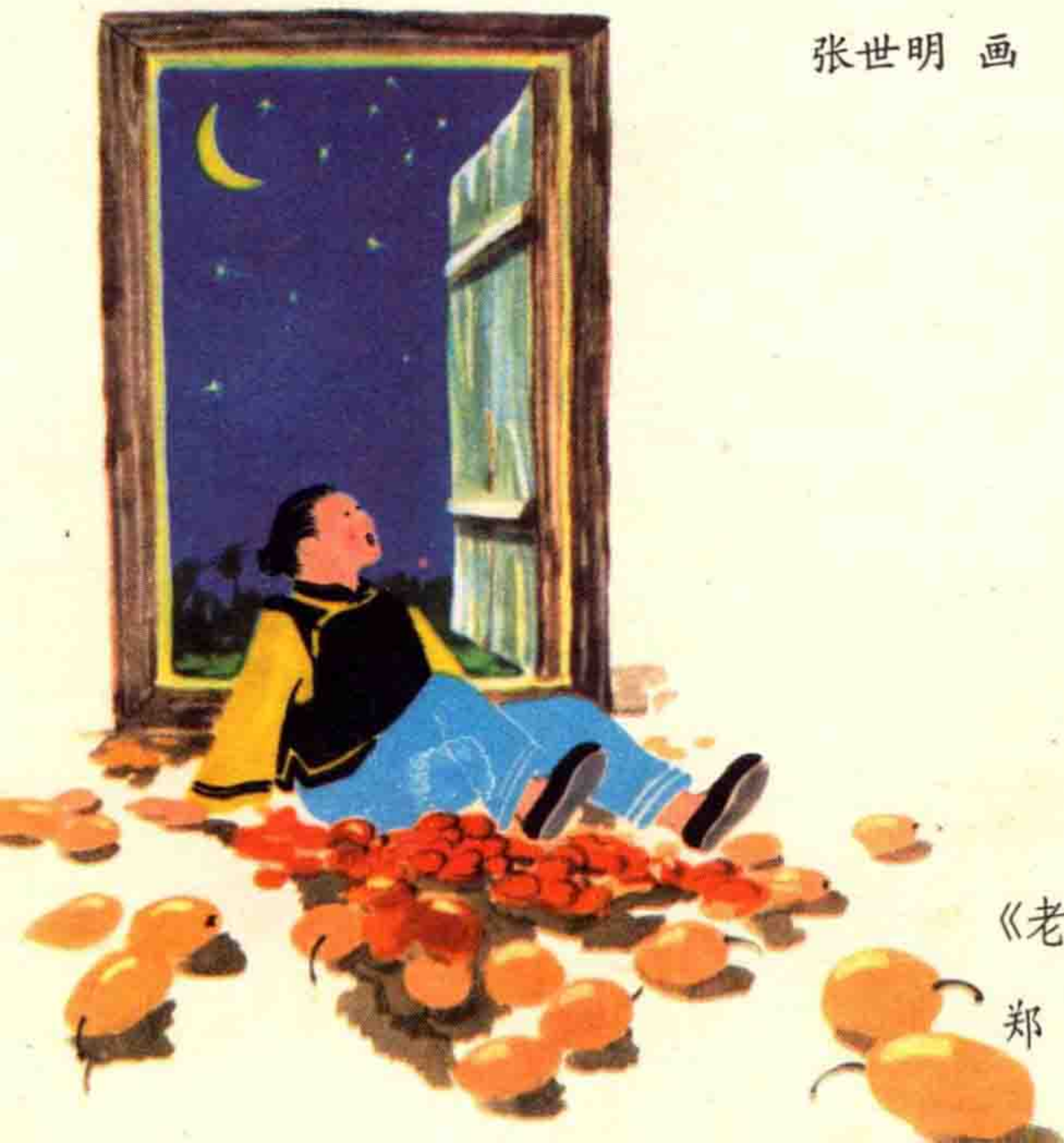
《老婆婆的枣树》 插图