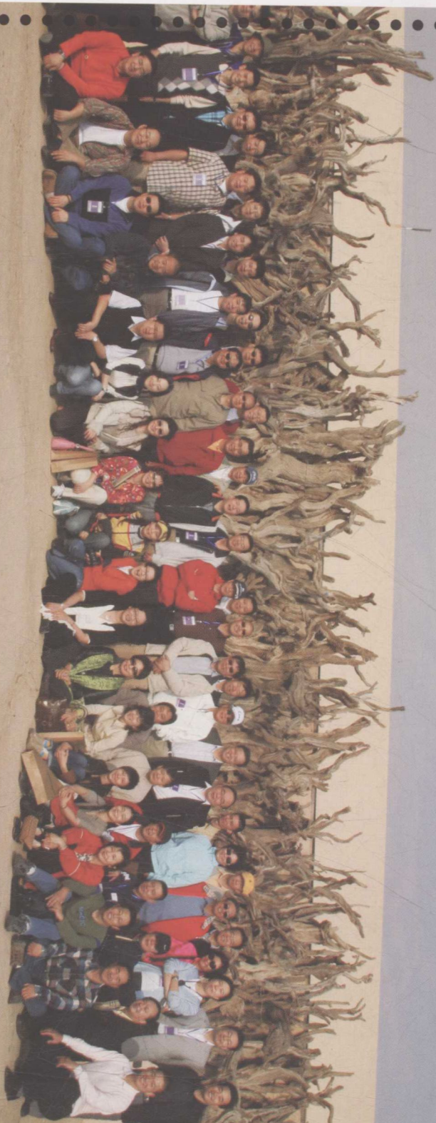
2006年9月，内蒙古阿拉善SEW生态协会年度理事会员大会