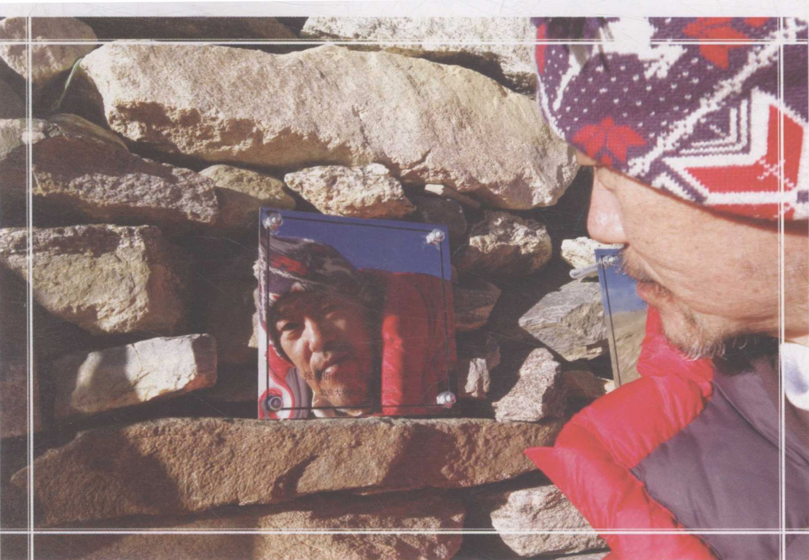
▲ 2008年9月，希夏邦马北大山鹰社纪念碑