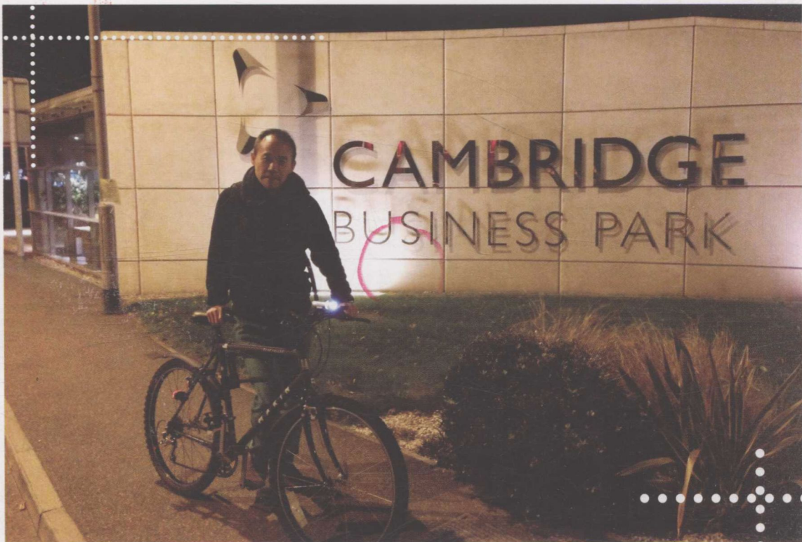
▲ 2013年10月，入学剑桥，摄于剑桥高科技园