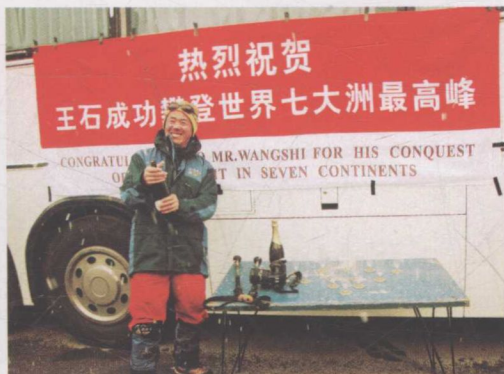
▲ 2004年7月，成功登顶世界七大洲最高峰