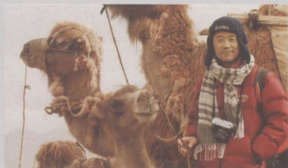
▲ 2009年6月，12天穿越库木库里沙漠