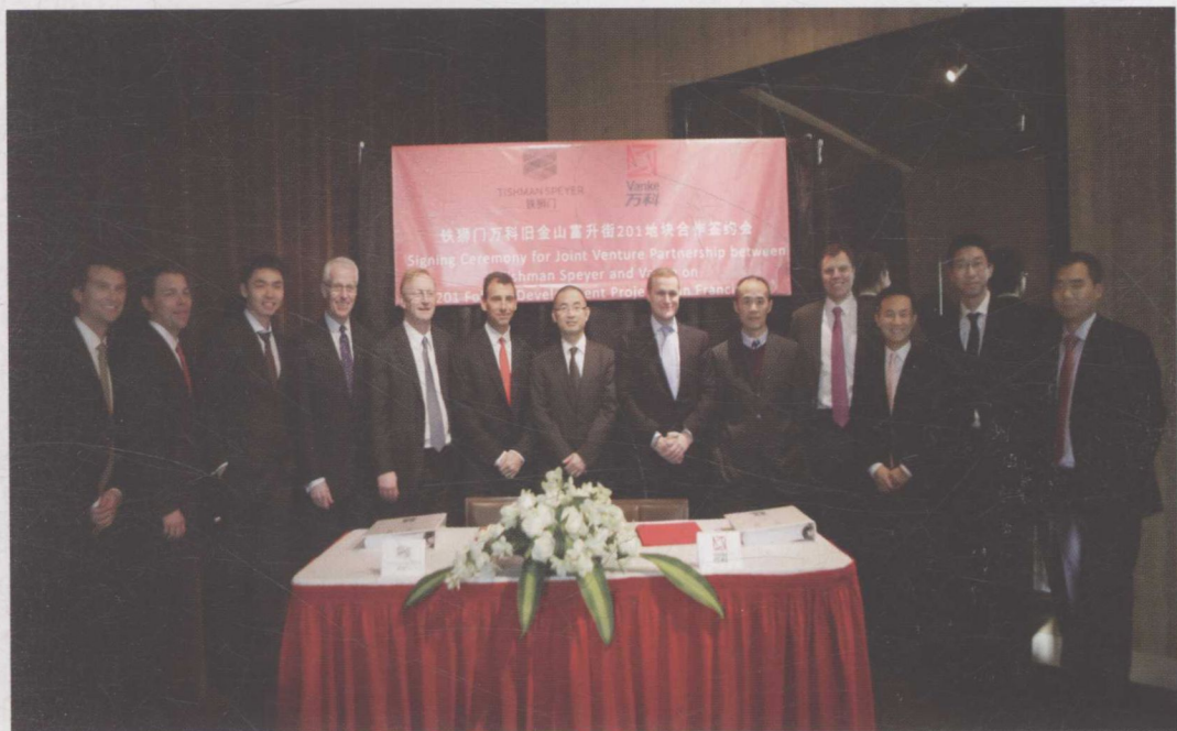
▲ 2013年2月，万科携手美国铁狮门正式登陆美国市场