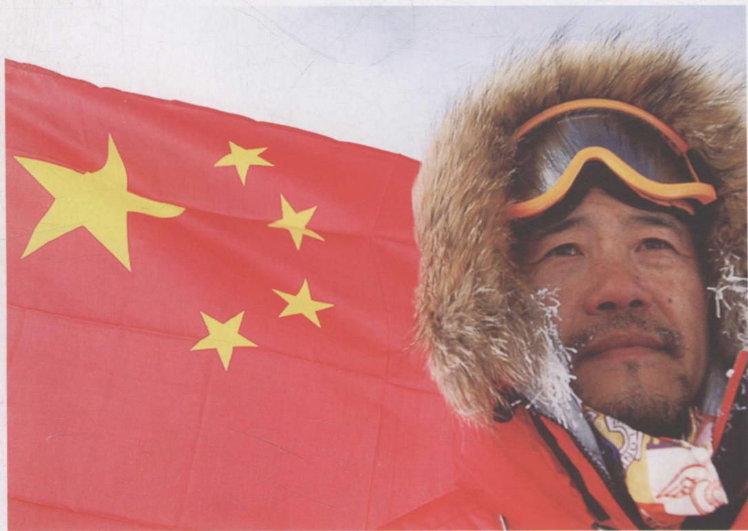
▲ 2005年12月，徒步9天行走100公里抵达南极点