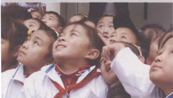
2008年12月，遵道学校的孩子们——万科将汶川地震后首批永久性公共建筑交付给四川绵竹遵道学校