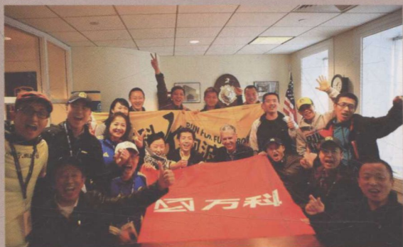
▲ 2013年4月15日，波士顿马拉松万科跑者合影（爆炸案发生前）