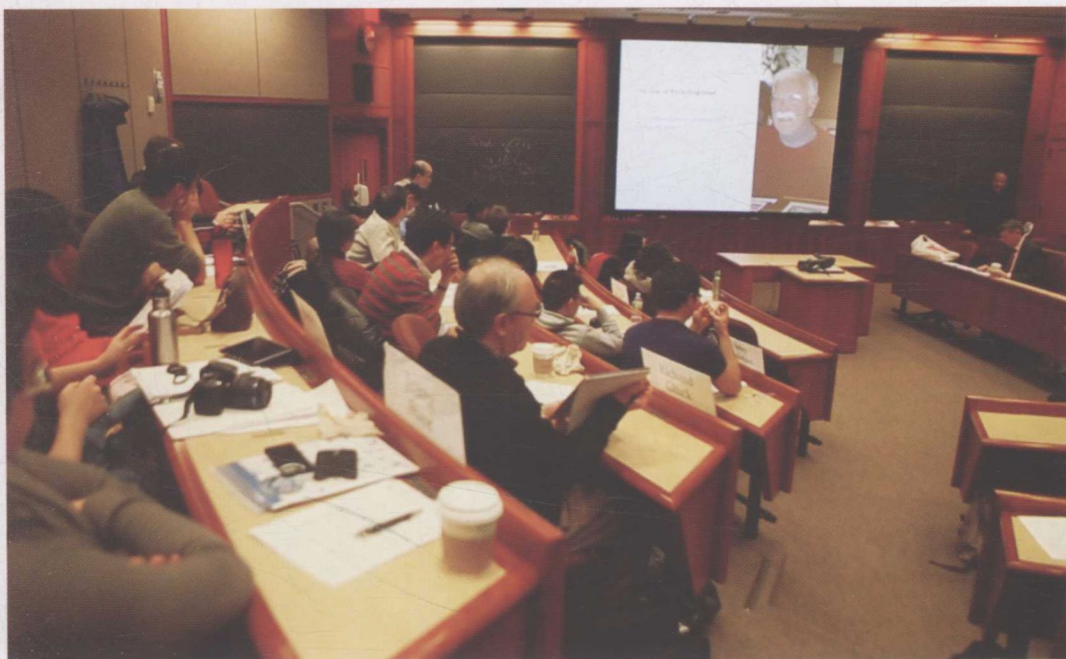
▼ 2013年3月，于哈佛商学院授课