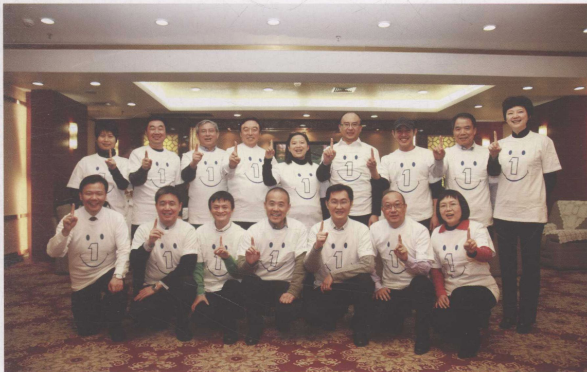
▼ 2011年1月11日，壹基金一届一次理事会