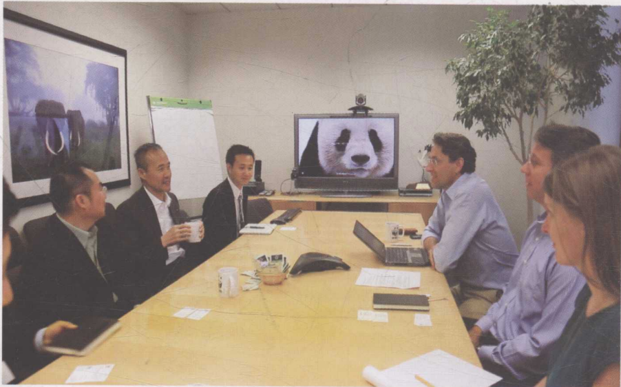
▼ 2012年10月，成为WWF美国理事，图为与WWF官员探讨中国物种保护项目