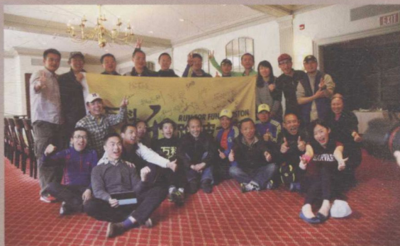
▲ 2013年4月15日，波士顿马拉松万科跑者合影（爆炸案发生后）