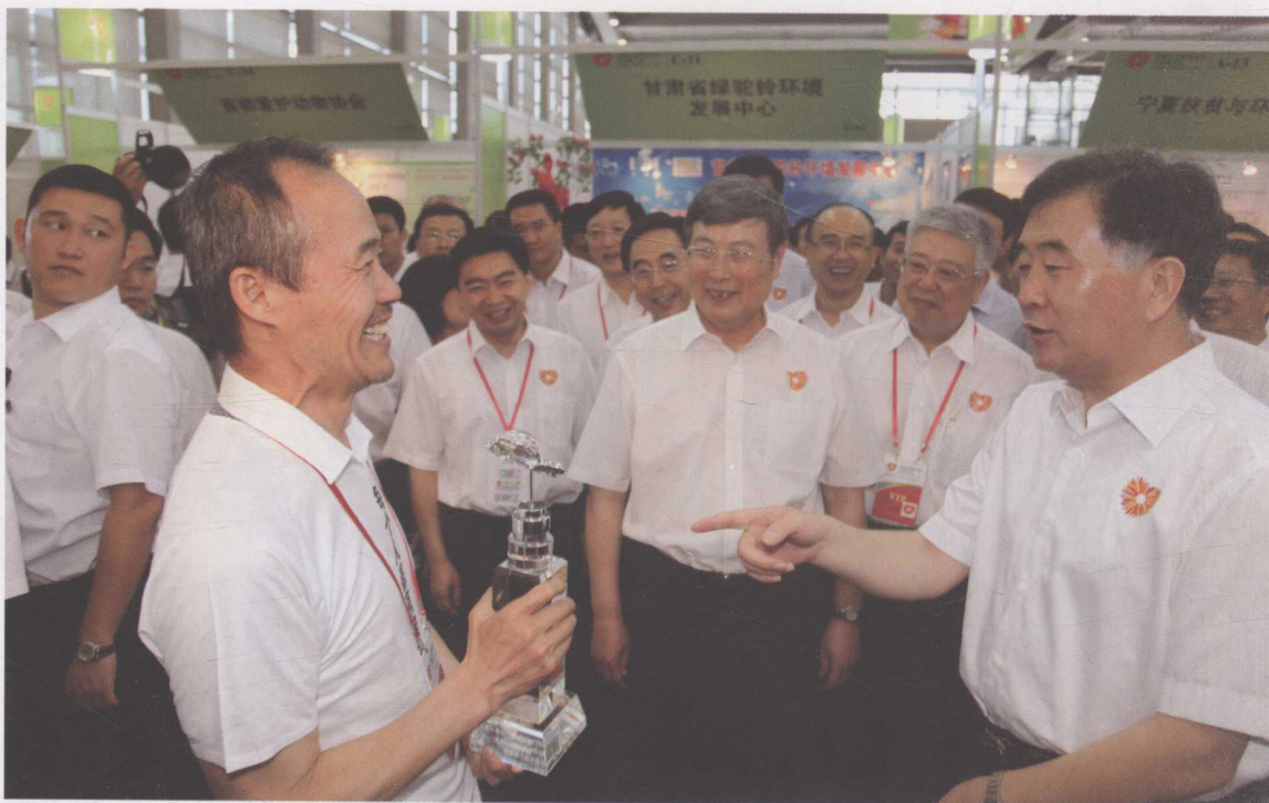
▲ 2012年7月，代表壹基金全体理事向慈展会组委会赠送壹基金“水晶蝴蝶”，寓意人人公益的蝴蝶效应掀起公益浪潮，以及人们对公益慈善像水晶般透明的期许