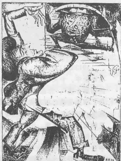
漫画家H.诺曼为《变形记》所作的插图