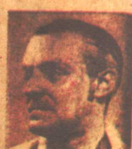
O. A. GANGL "El Salto—The Sign of a National Treasure"