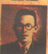
MASAFUMI NAKAI "The Answer"