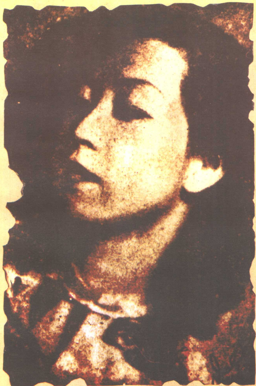
摄于四十年代中期