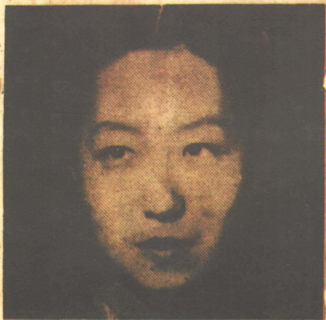
张爱玲摄于四十年代