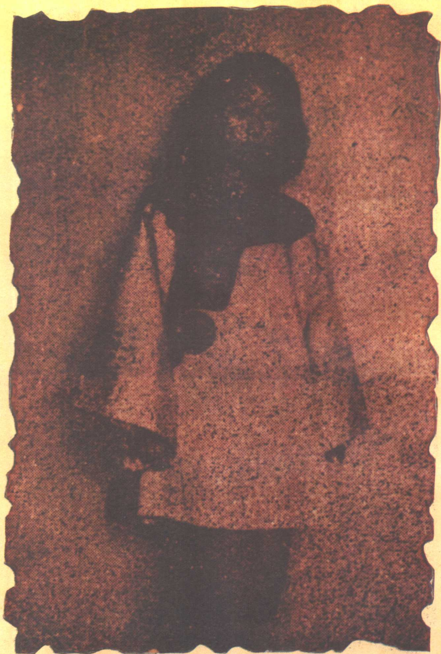
摄于四十年代中期