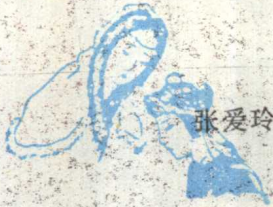
The Chow Kwen hood and the nineteenth-century version

讀者先生 我今年九歲因為英文不夠所以 以這沒有在學堂現在先在家 裏補習英文明年大約可以考四 年級了前天我看見附刊編輯 室的記事我想起我在杭州的 日記本所以寄給你看：不知 你可嫌它太長了不我常常喜 歡畫：子可是不像你們報上 那天登的孫中山的兒子那一 派的畫子是娃娃書畫的人喜 填顏色你如果要我就寄給 你