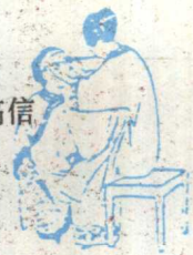
Shaving the forehead