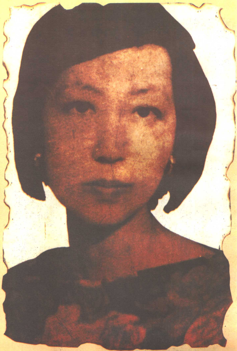
六十年代初摄于台湾。