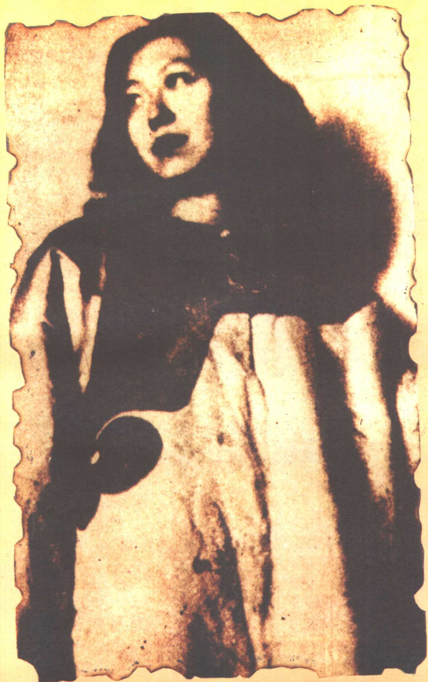
摄于四十年代中期