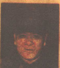
Lieut. Gen. MASAHARU HOMMA "The Heroes of Japanese Landings"