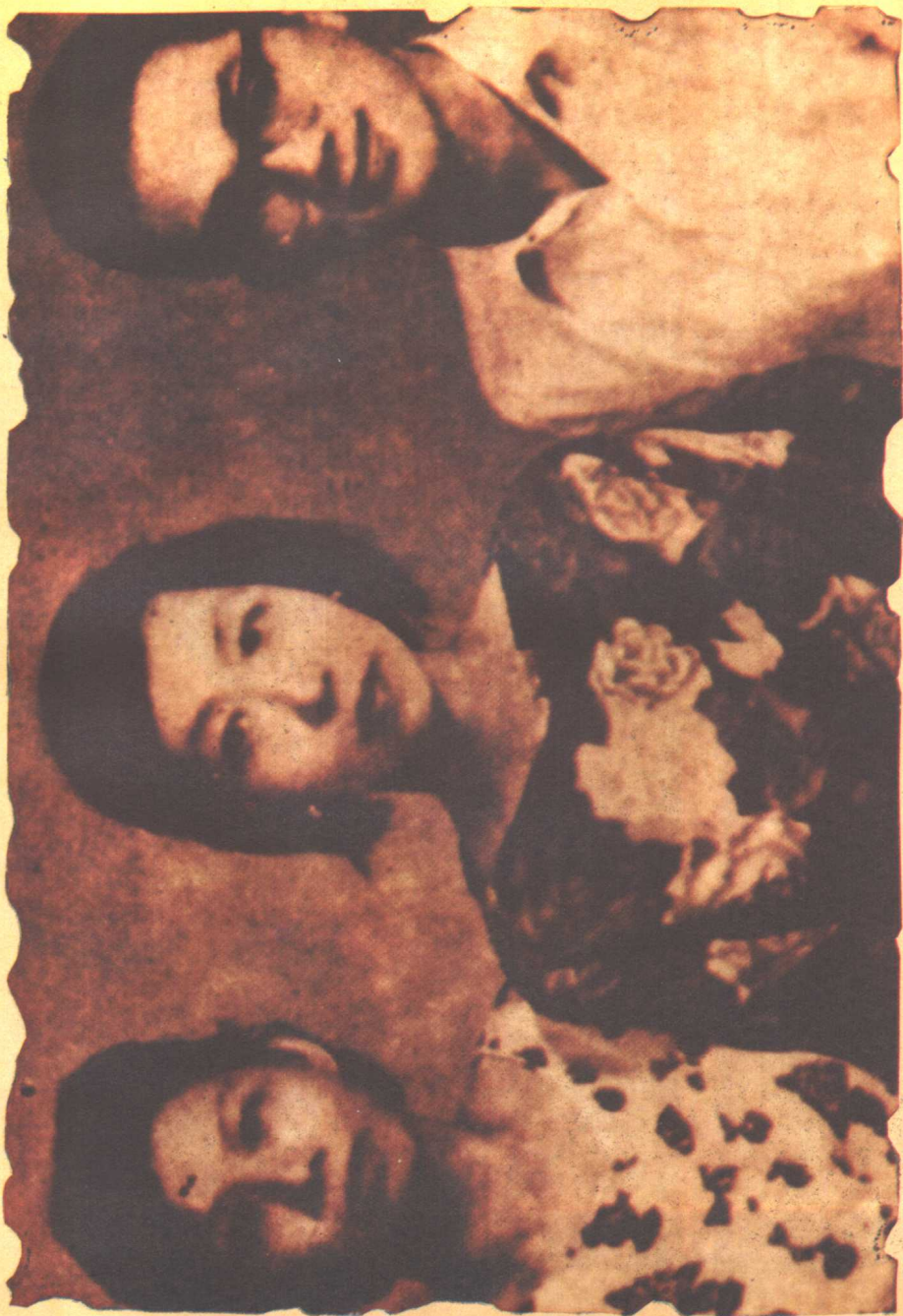
六十年代初摄于台湾，右为王桢和，中为张爱玲，左为王桢和的母亲。