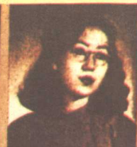
EILEEN CHANG "Chinese Life and Fashions"