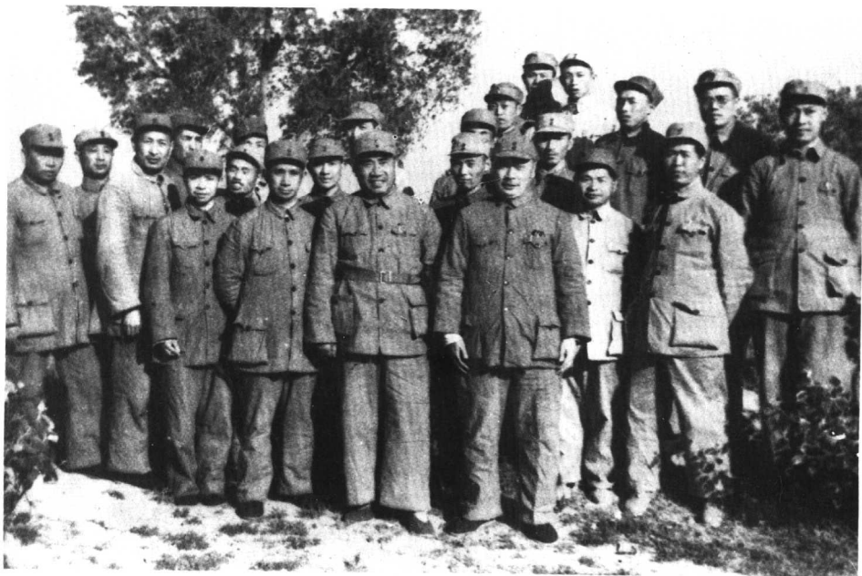
5 1948年5月，陈毅、粟裕陪同朱德总司令与华东野战军及一兵团部分干部合影