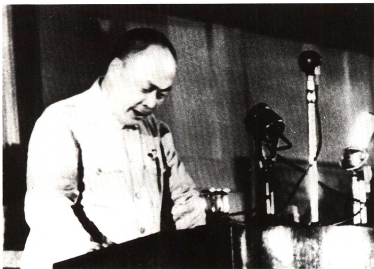
9 1949年9月，在中国人民政治协商会议上致词