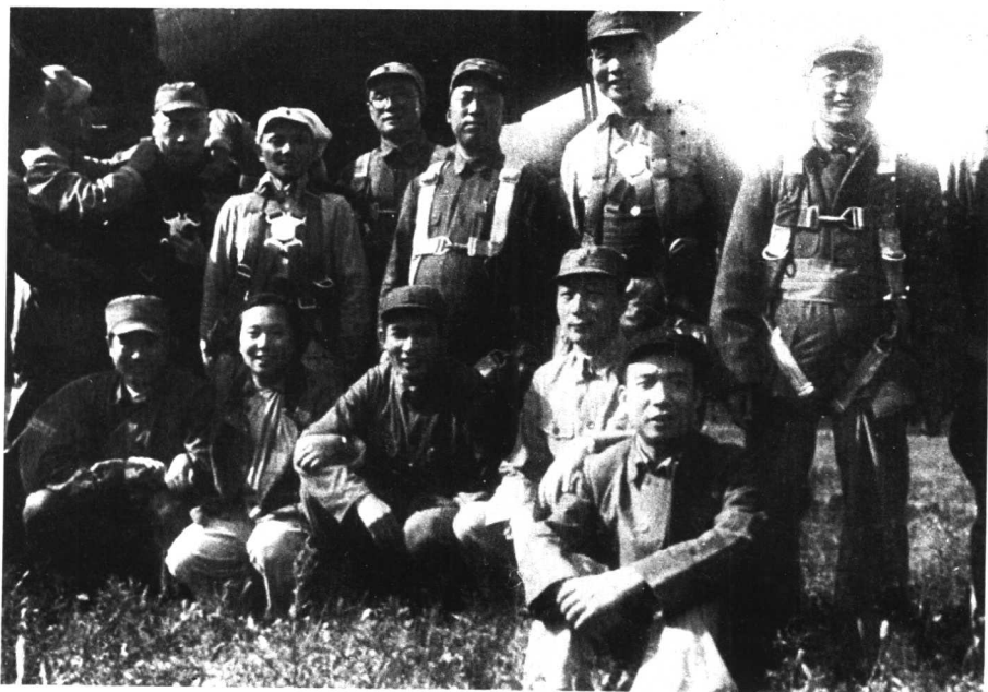
4 1945年8月25日，陈毅（后左2）与邓小平、刘伯承等飞离延安前，在机场与李富春、聂荣臻等合影。杨尚昆正为陈毅整理着装