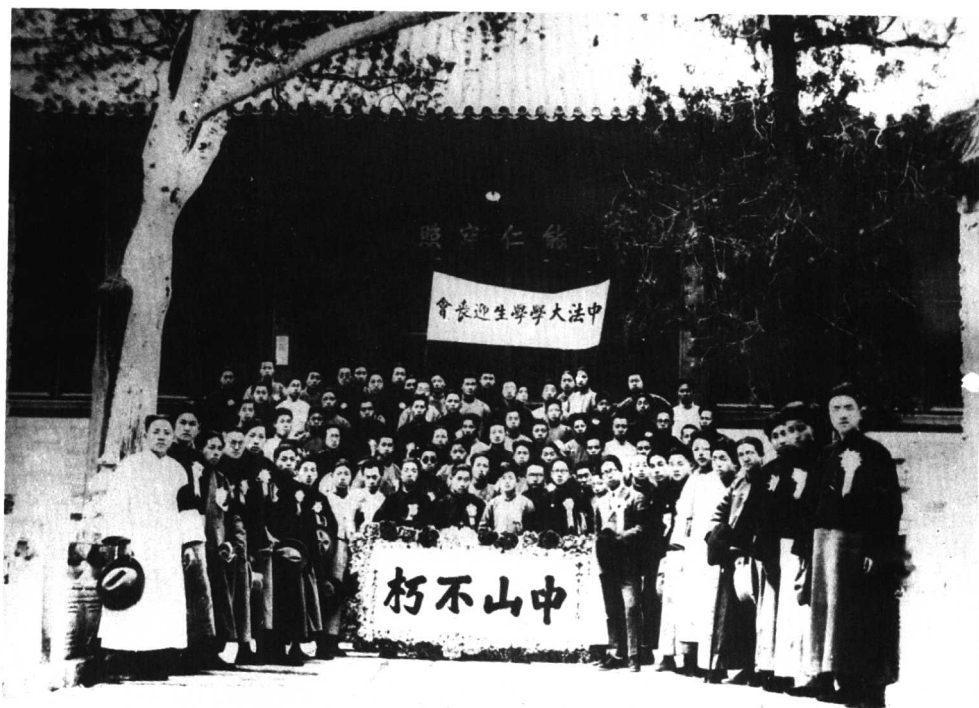
2 1925年，陈毅（前排左起第9人）在北京碧云寺参加中法大学学生为孙中山举行的迎丧会