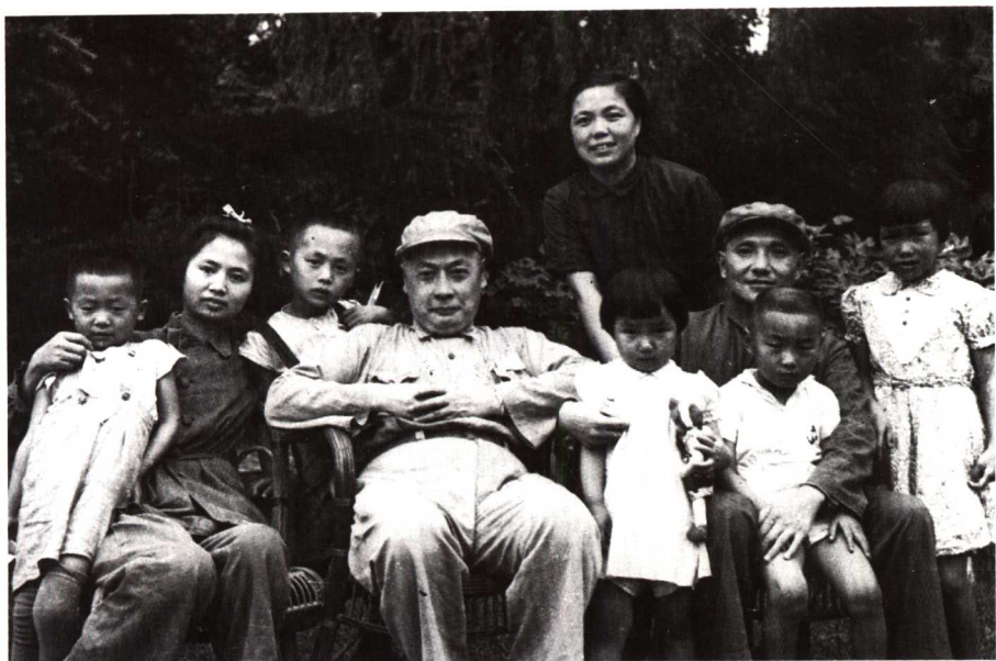
8 1949年5月，陈毅、邓小平两家在上海