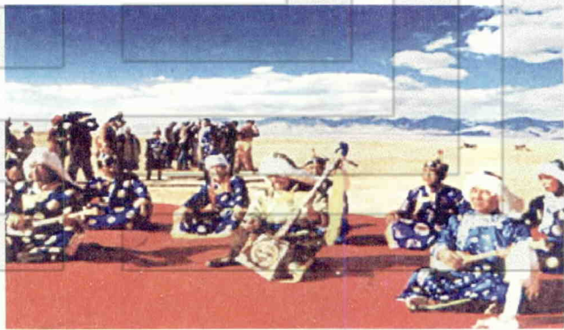
民间艺人在演唱《江格尔》

史诗在歌颂英雄的同时，对他们忠诚的朋友和生活的伴侣“骏马”也进行了赞颂。史诗中把马作为战神的象征，是马背民族在漫长的历史发展中形成的传统。诗中这样形容：