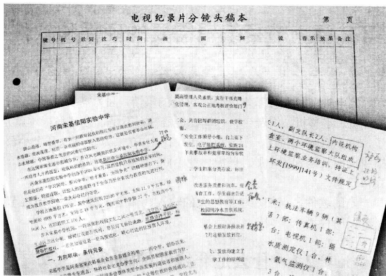
图 1-3-2 电视纪录片、专题片分镜头稿本式样

多电视台都将这个环节省略掉了。因为电视节目讲求时效性，很多人简化了这一程序，仅在文字稿本上简单做些标注，就进入了拍摄阶段（如图 1-3-2 所示）。