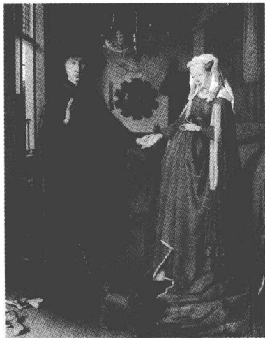
《阿尔诺芬尼夫妇像》

整个画面洋溢着虔诚与和平的气氛。在背景中央的墙壁上，有一面富有装饰性的凸镜，它是全画特别值得观者注意的细节：从这面小圆镜里，不仅看得见这对新婚者的背影，还能看见站在他们对面的另一个人，即画家本人。这种物理学上的游戏，显示了画家在运用光线反射方面的知识。小镜框的四周镶刻着十幅耶稣受难图，图像细小得几乎看不清。这是尼德兰特有的一种细密画传统，用镜子反射来扩大画面的空间，后来荷兰的风俗画和尼德兰的绘画，都得益于这种画法的启示。