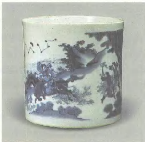
青花萧何月下追韩信笔筒 明崇祯 高 20.6cm 观复博物馆藏

很早的时候，我就对崇祯青花特别感兴趣。我发现这个时期的青花跟其他青花不一样，就开始注意收藏。有一回，我在北京古玩城买了一个青花笔筒。那是20世纪90年代初，国家刚允许市场卖古董。当时北京古玩城刚刚开张，还不是楼呢，用铁丝网围着一块地方，房子都是临时的木板房，你一进屋，房子还忽悠悠忽悠直晃荡。我就在那儿看到一个青花笔筒，非常大。那个人把笔筒刚掏出来，我一下就愣了，那是我到那时为止，甚至到今天为止，看到的最好的一个崇祯青花笔筒，上面的画片是“萧何月下追韩信”。