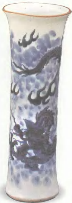
青花云龙纹花瓶 清顺治 高 27.2cm 北京故宫博物院藏

顺治青花有一个典型的对龙的绘法，只有这一朝这么画，叫“一身三现”。所谓“一身三现”，就是画一个龙头，画一段龙身，画一条龙尾，中间的地方都是云彩，好像一条龙被云彩遮挡，露出三段，叫一身三现。也有一身五现、一身七现，我还见过有一身九现的，但一定是单数。当时的这种绘法，是对龙纹的一种理解，这种理解多少跟政治也有点儿沾边儿。当时的政治不是很明朗，龙纹就表现得若隐若现；不像后来清朝坐稳了天下，龙纹就全部展现在你的眼前了。