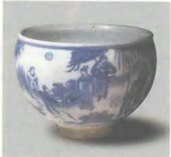
青花净水碗 明崇祯 高 15.3cm 中国国家博物馆藏