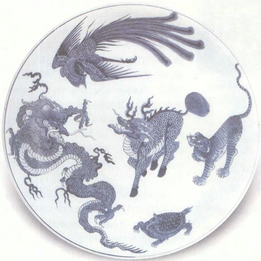
青花瑞兽图盘 清康熙 口径 27.4cm 北京故宫博物院藏

跟民窑不一样，民窑都是老百姓的事，自己想怎么烧就怎么烧，怎么能卖得好怎么烧。官窑不行，官窑要由官方定一个制式，必须按照这个制式烧出来。比如康熙晚期的龙凤纹就非常规范了，一看就是这个时期的瓷器，龙的身子怎么弯，须画多长，基本上都成了定式。民窑瓷器很多反映百姓生活的追求，而官窑中反映百姓生活的就逐渐减少了。