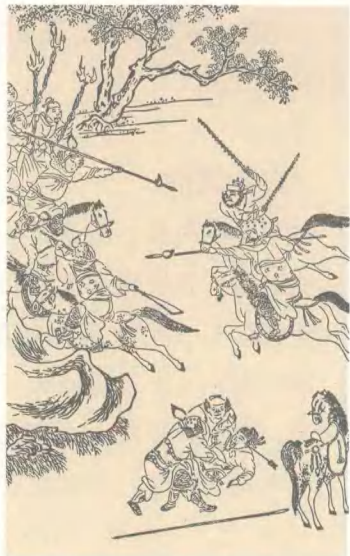
《忠义水浒传》插图版画 明万历

崇祯青花过去不受重视。在我喜欢青花的时候，很少有人研究，再往前推二十年，就更没有人研究了。过去都不知道崇祯一朝烧过青花瓷，往往一说就是嘉靖、万历，后面跟着是康熙、雍正，就到清朝了。近一百多年以来，几乎所有的收藏家、研究者、博物馆，都对崇祯青花有误解，认为这类青花一定不是崇祯的，而是后面康熙或者雍正的。因为只有在清朝的鼎盛时期，才可能生产出来如此精美的青花。崇祯青花很多都写干支款，不写“大明崇祯×年”，只写干支，比如“丙子”、“庚辰”，等等。当崇祯青花写干支款的时候，我们的判断往往会推后六十年，正好是康熙和雍正时期。所以大量崇祯青花的断代都被推后了。直到二十年前，研究崇祯青花的工作