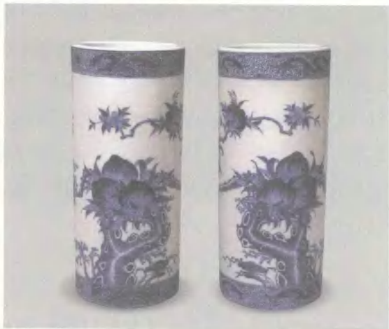
青花寿桃帽筒 民国 高 28.8cm

筒瓶这么有名，很多人收藏起来就知道有这么一个有名的东西。我有一个朋友，电话里跟我说：“我买了一个筒瓶，特好。”我问：“画的什么啊？”他说：“画的全是刀马人。”我一听，对，因为当时很多筒瓶画刀马人，就是一些骑马打仗的画片。我说：“你能肯定那个东西是清初的吗？”他说：“根据我所学的知识，那东西一定是清初的。”然后他就买了，兴高采烈地抱来给我瞧。他一进屋，我就乐了。我说：“您这筒瓶可真是筒瓶啊，上下一般粗。”他那是帽筒。清代晚期以后，帽筒盛行，都是直的。他学的知识非常不扎实，印象中反正是直筒子的都叫筒瓶，结果买回一个帽筒。帽筒跟筒瓶有天壤之别，我们注意看，筒瓶的口部并不是直的，而是有一个收口。他这“筒瓶”上下一般粗，倒着看和正着看，都是一样的。所以我就觉得，学习收藏是件认真的事，来不得半点儿马虎。过去就讲，怕就怕“认真”二字，你不认真，肯定要受到不认真的惩罚。