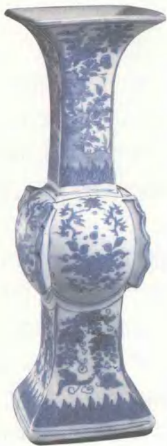
青花花卉出戟花觚 明天启 高 32cm 中国国家博物馆藏

首先，经济会受政治的影响，但当政治上完全处于放任的时候，经济也会自发地产生新的门类。经济的自我修复能力特别强，中国历史上有很多这样的例子，比如文景之治、贞观之治，历史上的这些盛世都是经济的自我修复。老百姓生活非常苦的时候，一旦政治气候宽松了，马上就开始自我修复，努力实现自己的生活目的。明末天启、崇祯统治者对瓷器生产采取完全放任的态度，根本顾不上；清初的顺治、康熙刚建立政权时，也没有能力控制景德镇的瓷器生产。在这种情况下，民窑的青花就蓬勃发展。这种发展表现在对质量的追求上。过去对晚