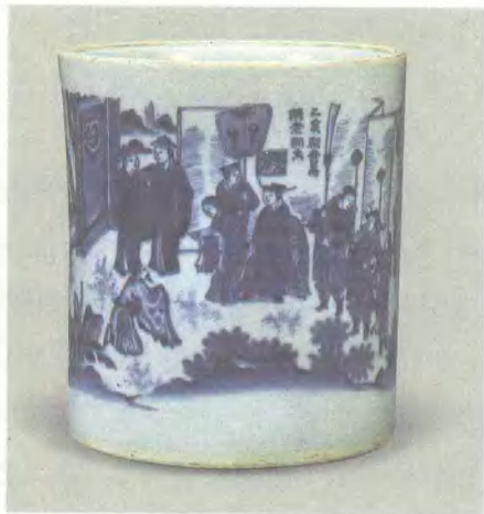
青花人物故事笔筒 明崇祯 高 22.5cm 观复博物馆藏

理论上讲，笔筒不能搁毛笔，这是所有人忽略的。毛笔怎么搁呢？笔筒里的毛笔是倒着搁，大头朝上。但使用过毛笔的人都知道，毛笔使用以后，一定要悬