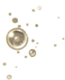
最原始的生命——微生物的出现