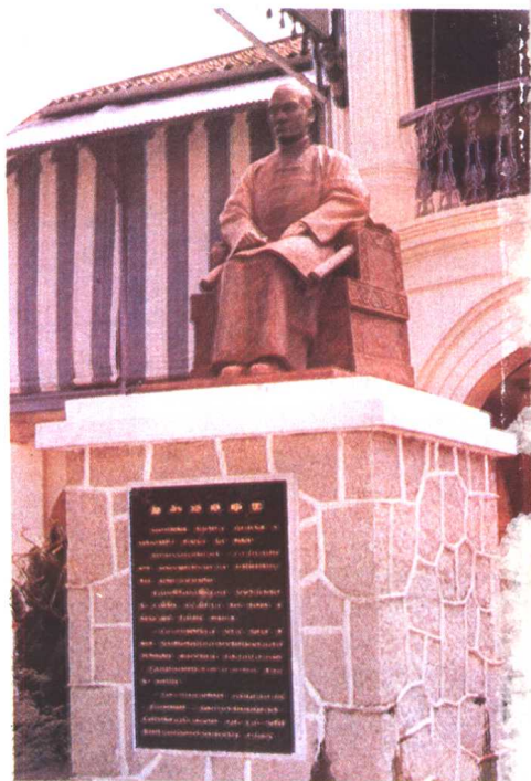
新加坡晚晴园的孙中山座像