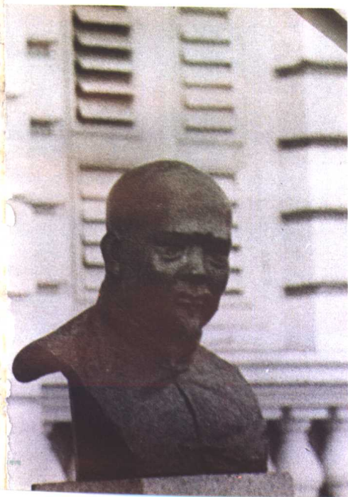
新加坡博物院无名华人纪念碑