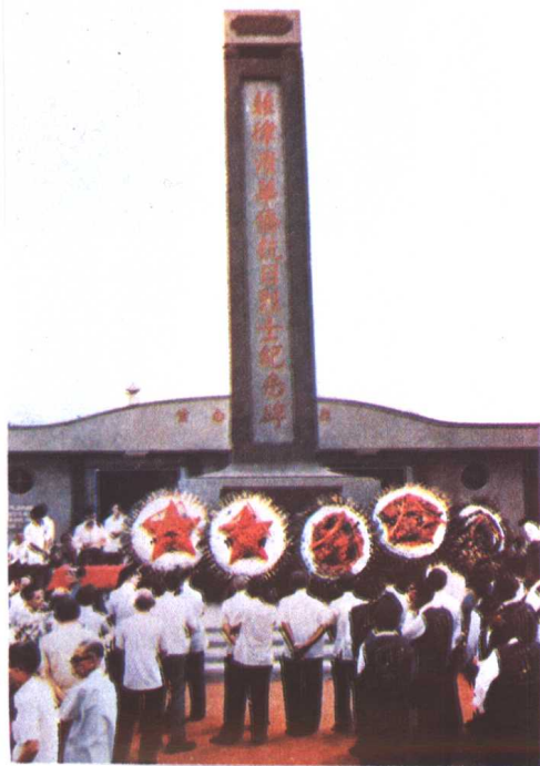
菲律宾华侨抗日烈士纪念碑