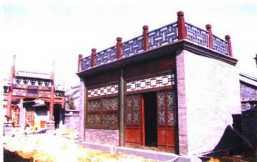
图 20-10 SPUA 技术 用于道具布景 的制作