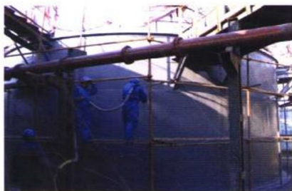
图 20-7 SPUA 技术施 工罐体侧壁