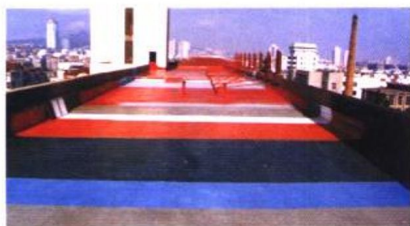
图 20-8 SPUA 技术用于 层面防水保温