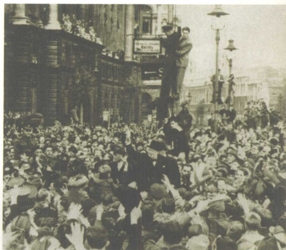
丘吉尔被伦敦人簇拥着前往英国议会，去发表欧战胜利纪念日演说。

感情有了迅速的进展。在1946年夏末，在英国王室的苏格兰皇庄巴尔莫勒尔，当希腊的菲利普亲王直接向伊丽莎白公主求婚时，她并没有顾及父王、母后以及政府的意见，就在此时此地，接受了菲利普的求婚。当时，排外情绪在英国仍然普遍存在，当订婚的消息最后公之于众的时候，英国有40%的人都因为菲利普是个外国