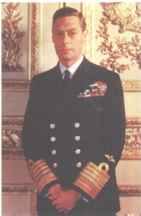
乔治六世,于1936年至1952年在位。

蒙巴顿勋爵(1900~1979),巴滕贝格的路易斯亲王和维多利亚公主的第四子,少年时代便进入英国皇家海军学院学习;在二战中指挥驱逐舰;1943~1946年任东南亚盟军最高统帅;1947年任英国驻印度总督;1956年成为海军元帅;1979年被爱尔兰共和军在其游艇上投放的炸弹炸死。