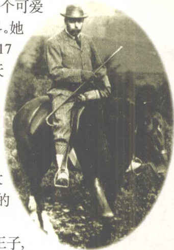
伊丽莎白二世的祖父乔治五世(1865~1936)摄于1905年的一次野外射击途中,他胯下的这匹心爱的坐骑“乔克”后来在它主人的葬礼上走在送葬队伍的最前面。

伊丽莎白二世的父亲约克公爵(1895~1952)在苏格兰高地的山岭间步行攀登跋涉,当他后来患动脉硬化后,还是坚持着自己系上宽腰带,由马牵着步行爬山。