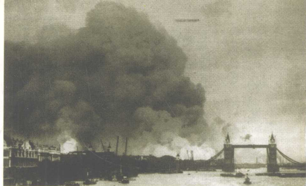
1940年9月7日，德军的炸弹投在了伦敦市中心泰晤士河上的塔桥边。

1940年4月，刚满14岁的伊丽莎白公主和妹妹玛格丽特一起在温莎的大花园内投入了劳动，这是她们为响应战时的口号“为胜利而努力！”而开展了自己的种植计划。