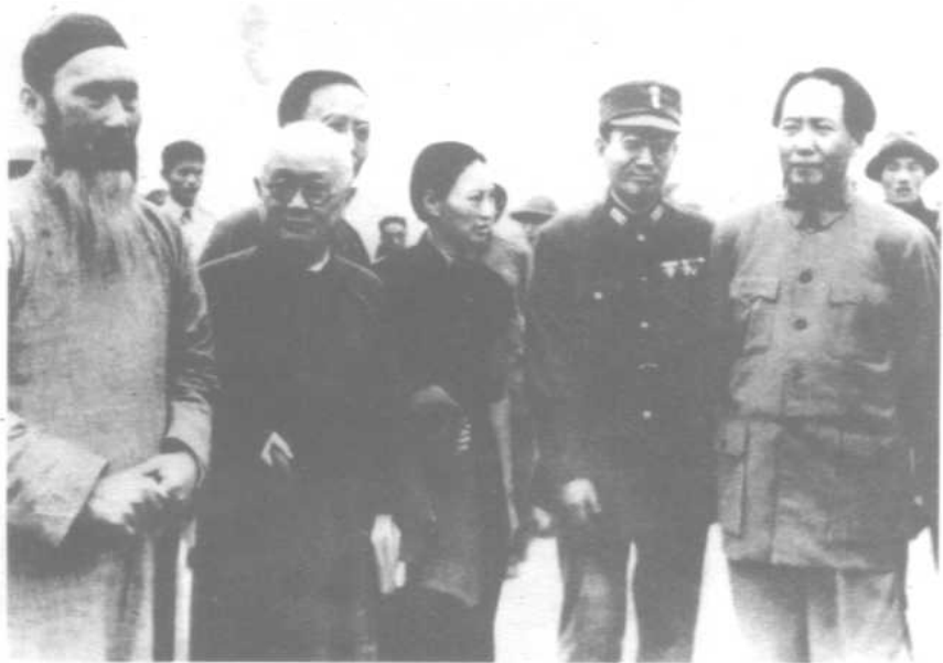
1945年10月11日毛泽东在重庆机场与欢迎者合影 右起：毛泽东 张治中 傅学文 郭沫若 邵力子 张澜