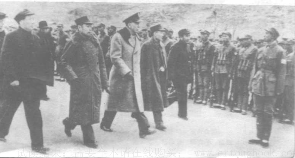
▼ 1946年3月4日军事三人小组 (中共代表周恩来、国民党代表 张治中、美国特使马歇尔)到达延安， 毛泽东、朱德到机场欢迎。