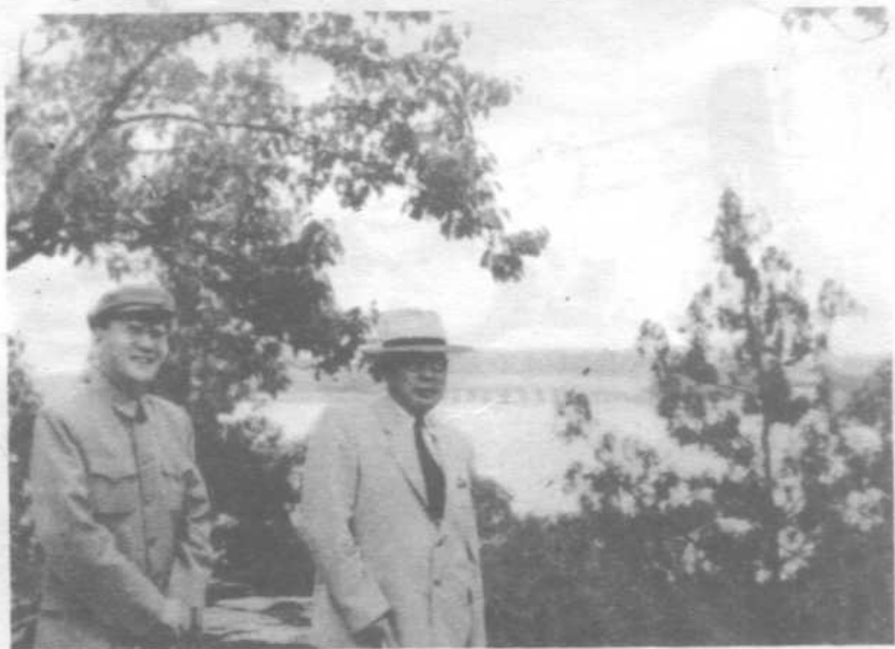
张治中邀陈毅元帅同游颐和园