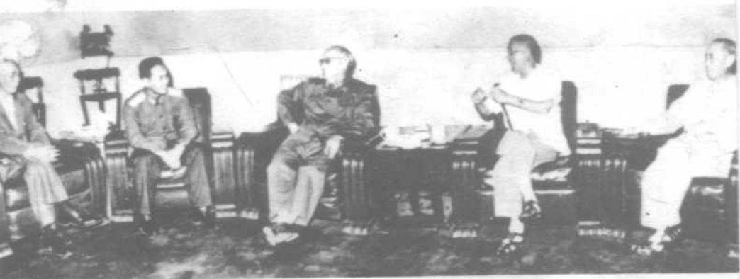
1963年6月22日国防委员会副主席叶剑英、张治中、傅作义、蔡廷锴接见徐廷泽。