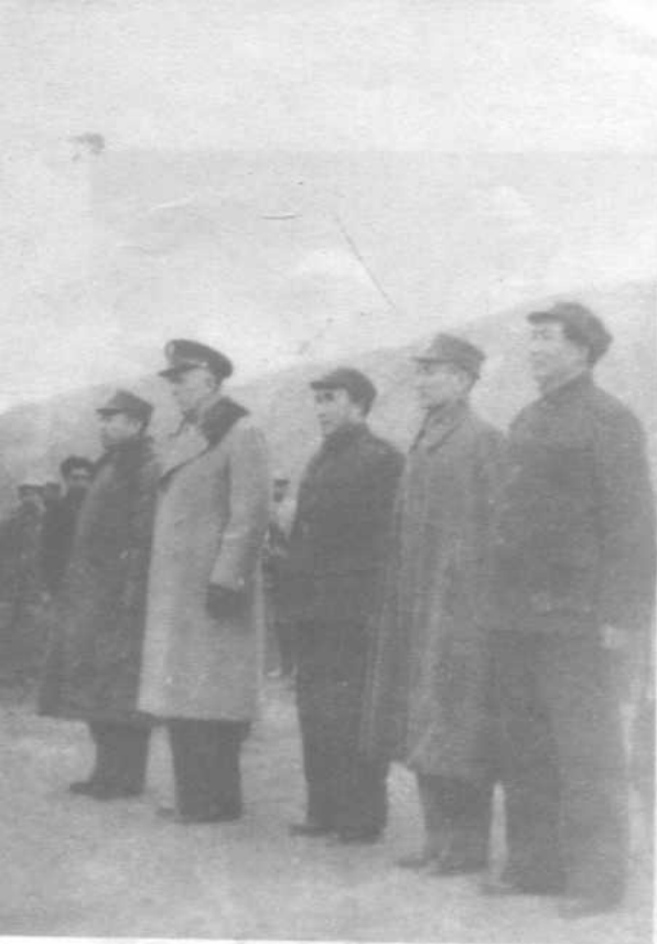
◀ 1946年3月在延安机场右起： 毛泽东 张治中 朱德 马歇尔 周恩来