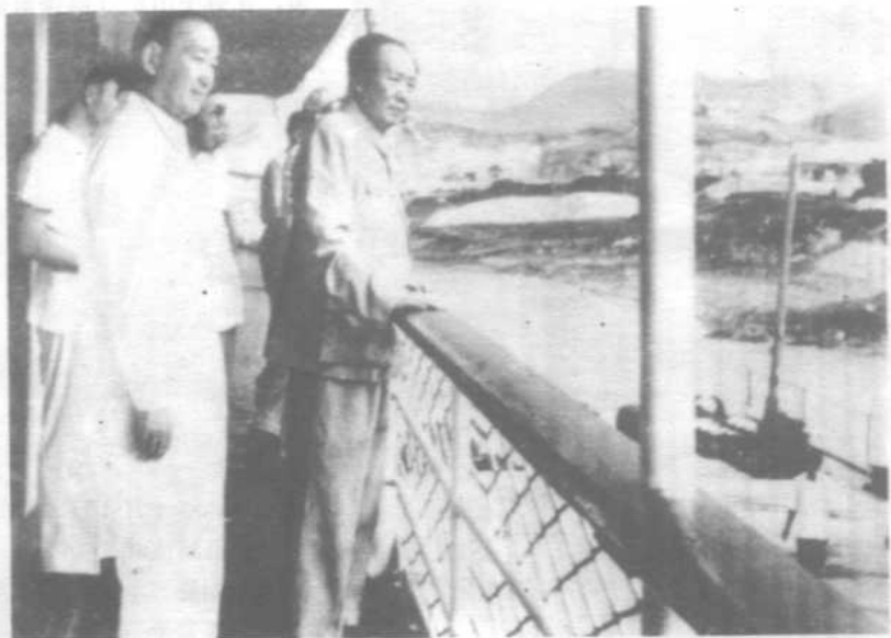
1958年9月，张治中随同毛主席视察大江南北时， 在长江途中轮上。