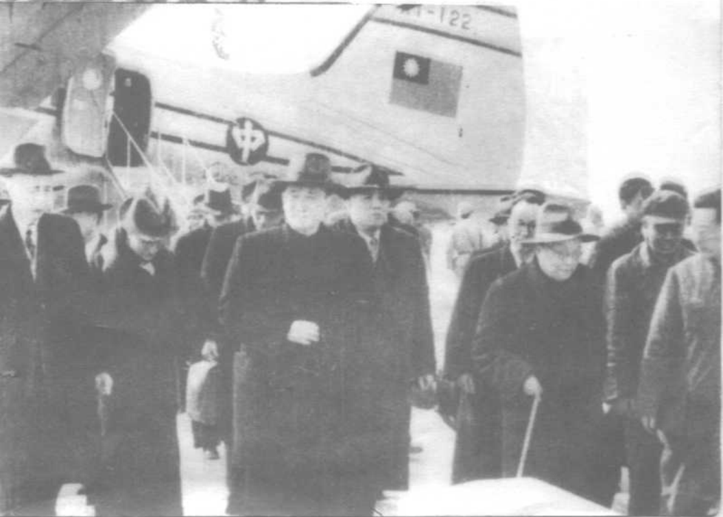
▼ 1949年4月1日国民党政府和平谈判代表团到达北平。