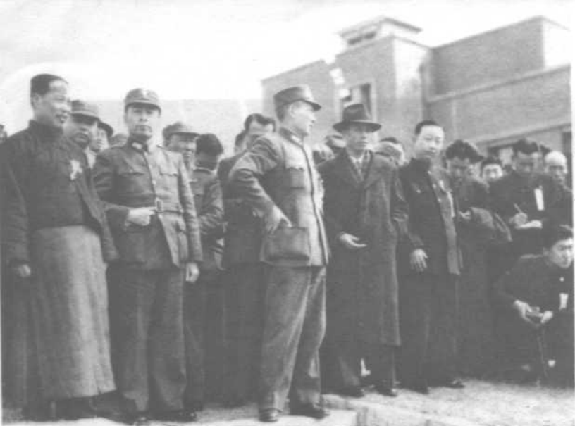
◀ 前排左一周恩来 左三张治中 一九四六年 在济南