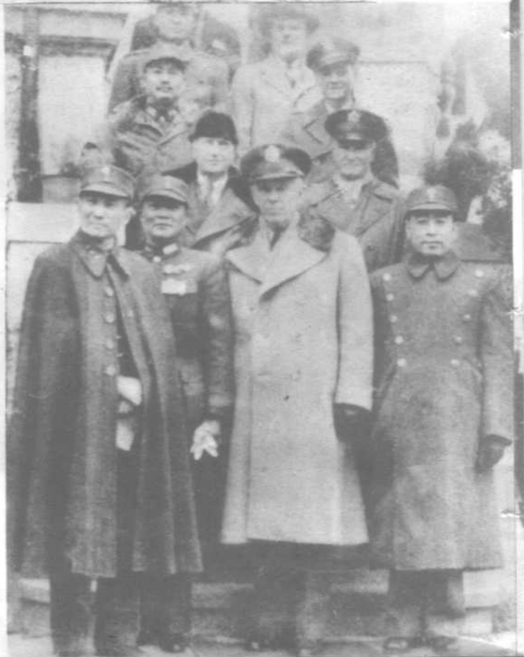
第三排左一为叶剑英 第一排左起张治中 郑介民 马歇尔 周恩来 (即今首都医院) 合影 ▶ 一九四六年三月三人小组在北平军调部门前