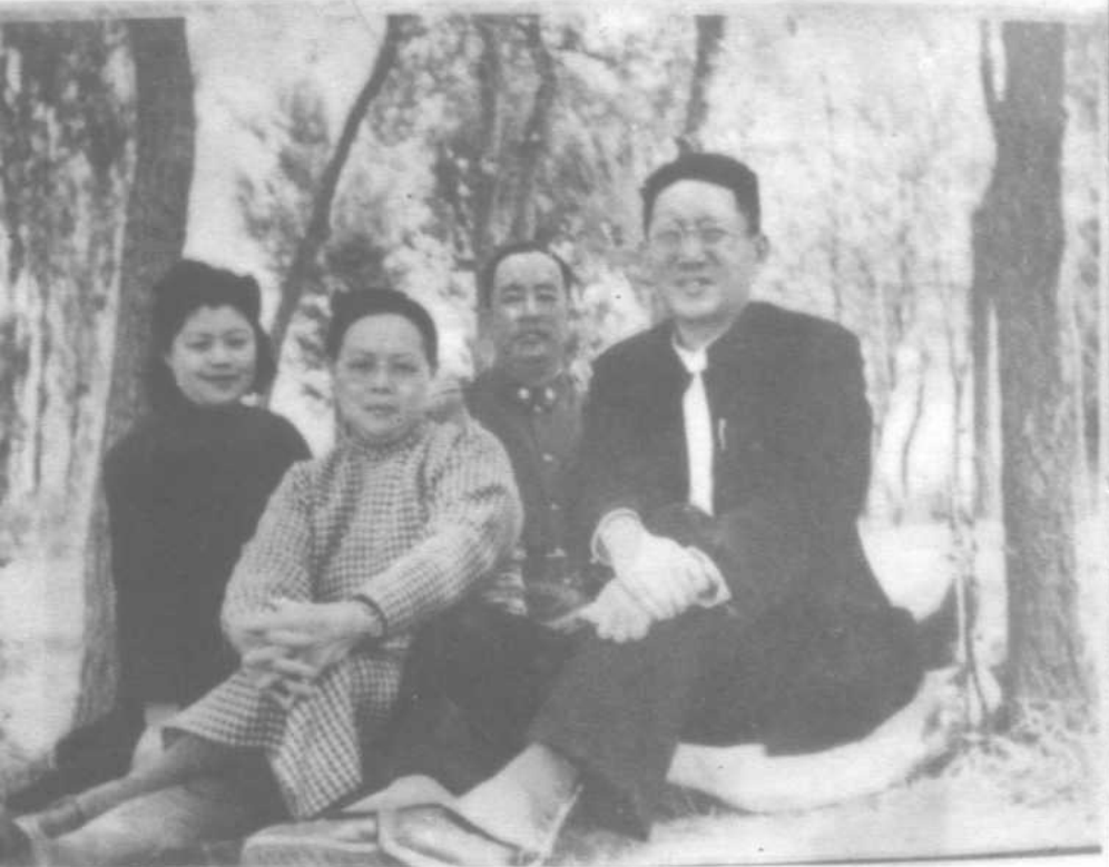
1948年5月23日在兰州黄河中雁野餐留影