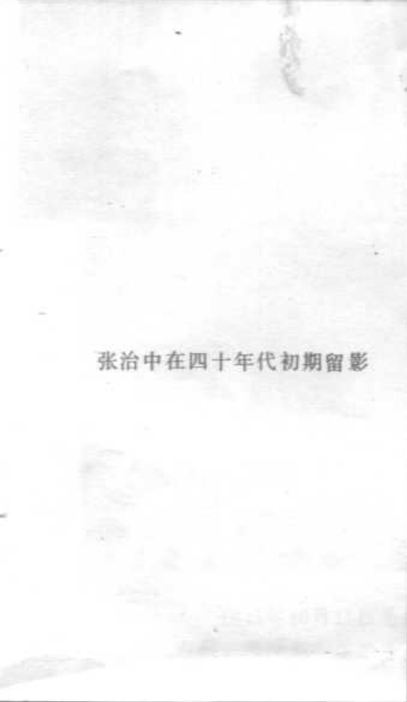
张治中在四十年代初期留影