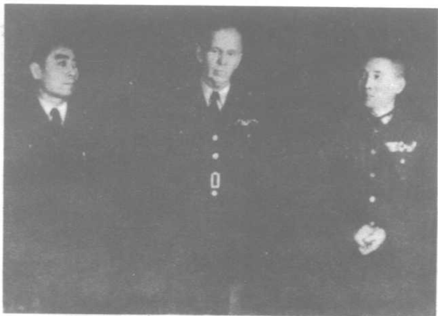
马歇尔 周恩来 张治中在整军谈判期间