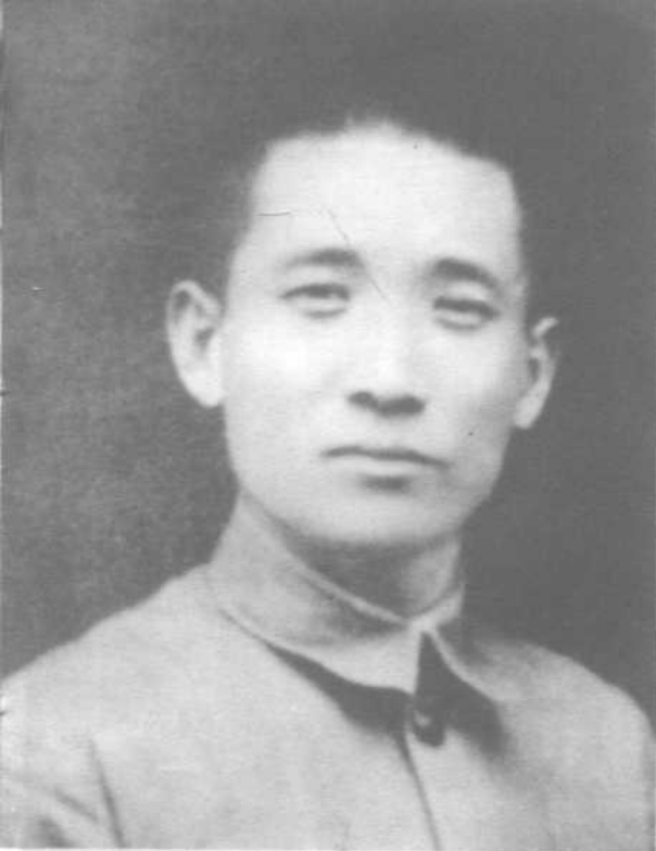
张治中在1932年一二八 抗日战争时留影