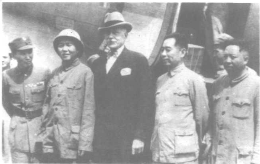
1945年8月28日在延安机场 右起：王若飞 周恩来 赫尔利 毛泽东 张治中