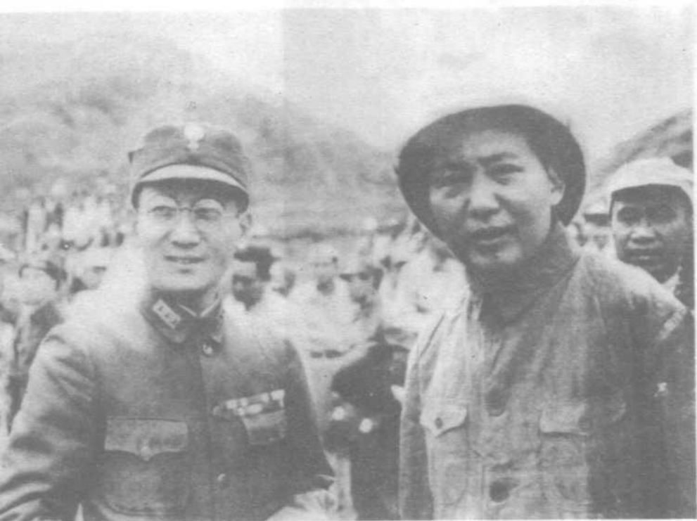
1945年10月11日毛泽东和张治中在延安机场