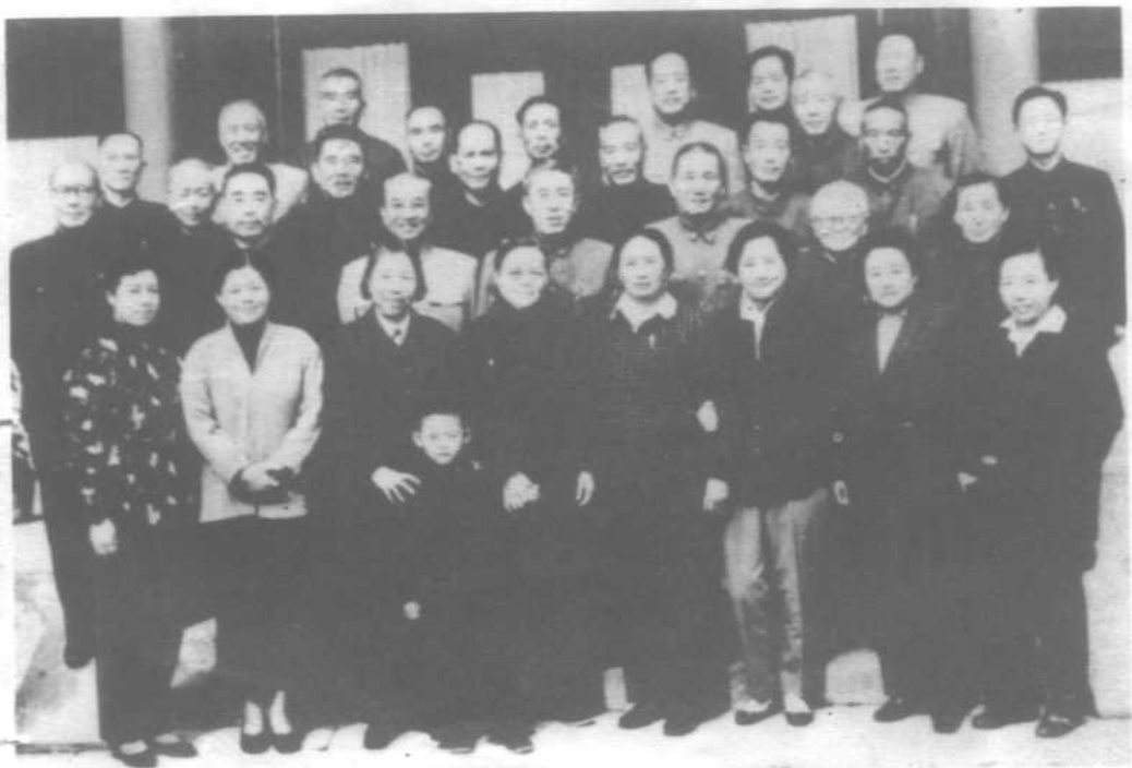
1960年10月在颐和园介寿堂，周恩来、邓颖超、张治中、邵力子接见在京黄埔军校早期毕业学生时合影。其中有杜聿明、王耀武、郑洞国、侯镜如、覃异之、宋希濂、杨伯涛、郑庭笈等。