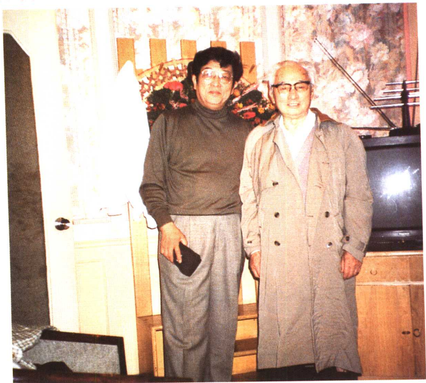
与著名美学家王朝闻合影