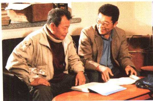
与著名电影导演于彦夫合影