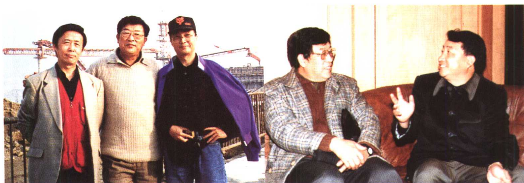
与评书名家田连元、京剧名家李光合影