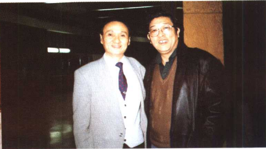
与京剧表演艺术家童祥苓合影