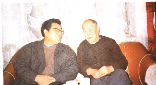
试读与相声界前辈于春明合影