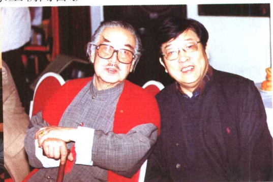
与著名话剧表演艺术家杜澎合影