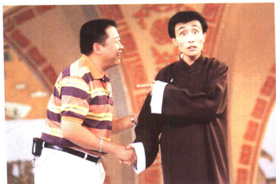
牛振华、巩汉林表演相声《巨星出台》