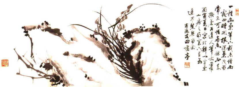
恩师田荫亭之墨宝