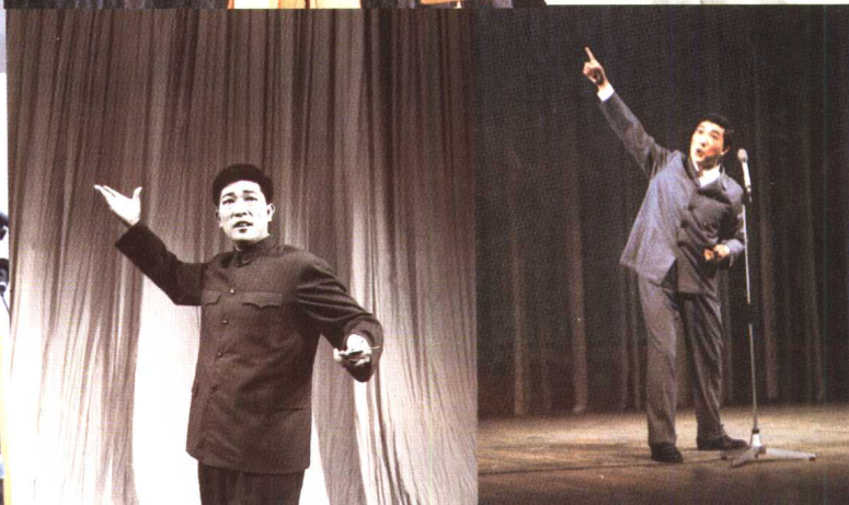
20世纪50~90年代演出山东快书的舞台照