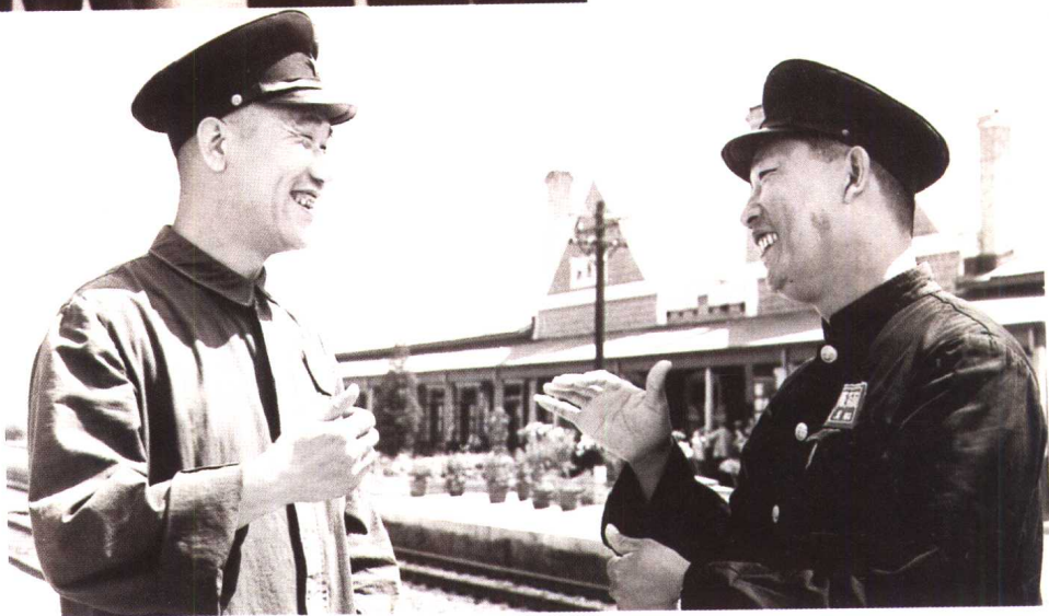
1964年与侯宝林在新民车站深入生活