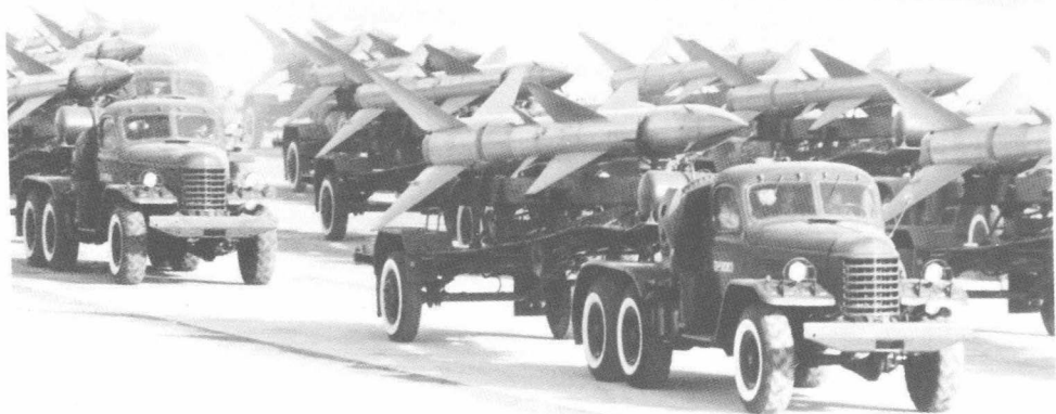
地空导弹方队通过主席台接受检阅