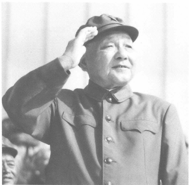
邓小平、胡耀邦等党和国家领导人在华北军事演习阅兵主席台上检阅部队