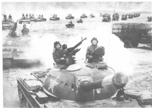
激战中“红军”二梯队加入战斗