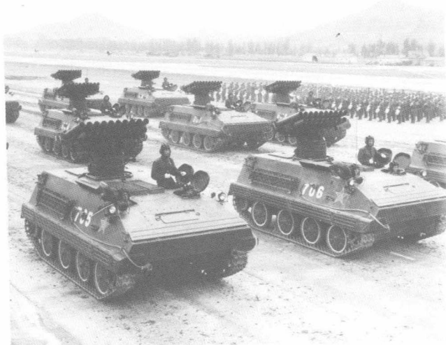
自行火炮方队接受检阅通过主席台