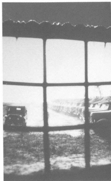
野营帐篷城