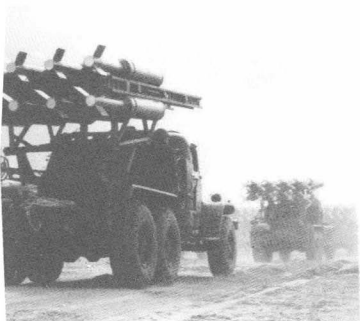
火箭布雷车奔赴发射地域